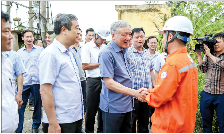
Đồng chí Nguyễn Hòa Bình, Ủy viên Bộ Chính trị, Bí thư Trung ương Đảng, Phó Thủ tướng thường trực Chính phủ động viên cán bộ, công nhân viên ngành điện khắc phục hậu quả, sớm khôi phục hạ tầng lưới điện sau bão.