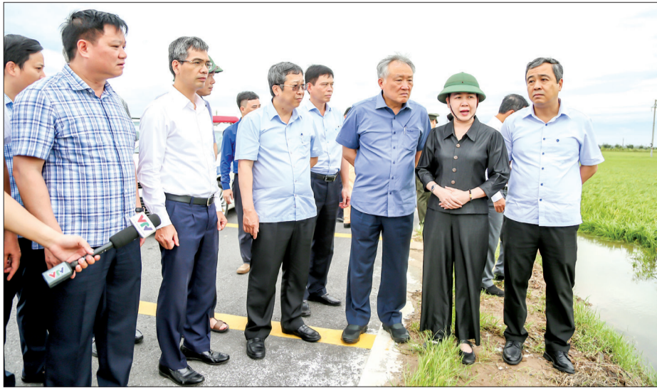
Đồng chí Nguyễn Hòa Bình, Ủy viên Bộ Chính trị, Bí thư Trung ương Đảng, Phó Thủ tướng thường trực Chính phủ kiểm tra thực tế tại huyện Thái Thụy.