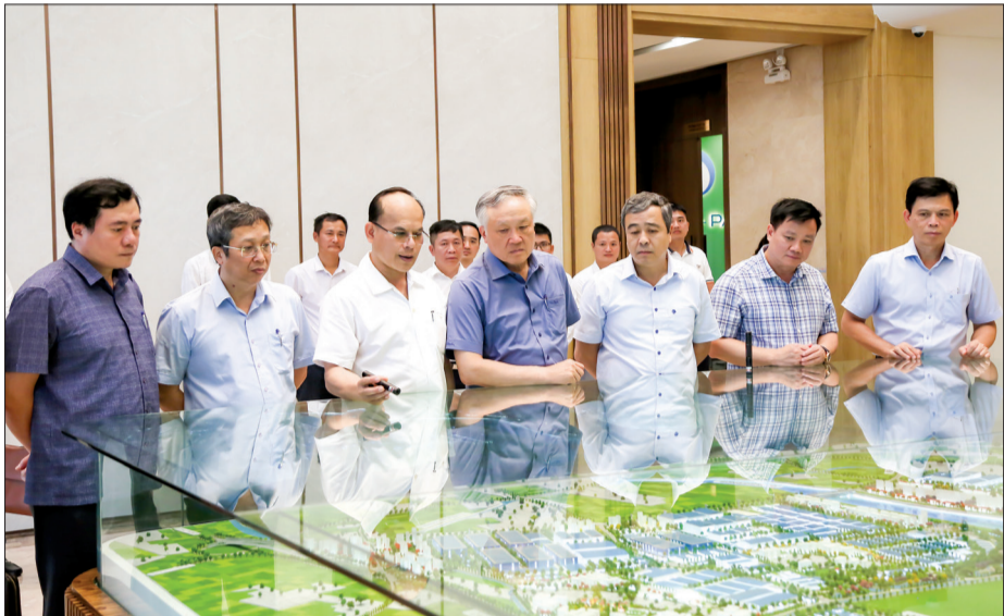
Đồng chí Nguyễn Hòa Bình, Ủy viên Bộ Chính trị, Bí thư Trung ương Đảng, Phó Thủ tướng thường trực Chính phủ ấn tượng với định hướng phát triển và quyết tâm của nhà đầu tư xây dựng khu công nghiệp Liên Hà Thái.