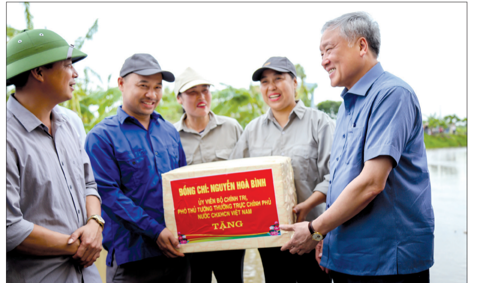
Đồng chí Nguyễn Hòa Bình, Ủy viên Bộ Chính trị, Bí thư Trung ương Đảng, Phó Thủ tướng thường trực Chính phủ tặng quà động viên lực lượng làm công tác thủy nông tại trạm bơm An Quốc (Kiến Xương).

vi trí tuyến kè, bờ sông, bờ biển và một số tuyến kênh nội đồng bị sạt lở. Kiểm tra công tác tiêu úng bảo vệ lúa mùa và hoa màu tại 2 huyện Kiến Xương, Thái Thụy, Phó Thủ tướng thường trực Chính phủ Nguyễn Hòa Bình ghi nhận nỗ lực của tỉnh Thái Bình trong chủ động ứng phó với bão số 3, qua đó góp phần giảm thiểu thiệt hại do bão gây ra, nhất là không có thiệt hại về người. Phó Thủ tướng thường trực Chính phủ đề nghị tỉnh tiếp tục tập trung chỉ đạo khắc phục hậu quả sau bão; tổ chức toàn