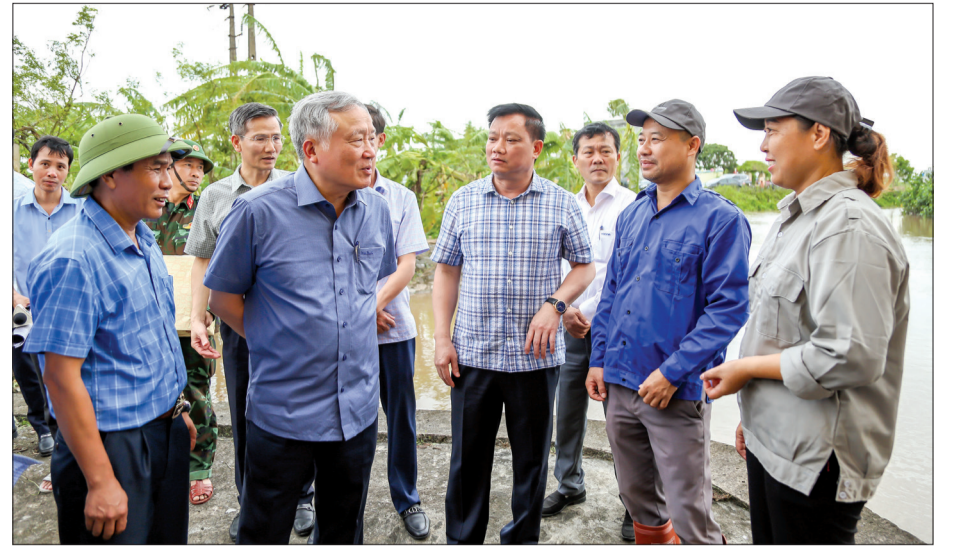
Đồng chí Nguyễn Hòa Bình, Ủy viên Bộ Chính trị, Bí thư Trung ương Đảng, Phó Thủ tướng thường trực Chính phủ kiểm tra công tác tiêu úng tại trạm bơm An Quốc (Kiến Xương).