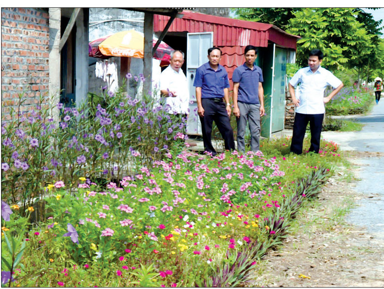
Những thảm hoa được người dân xã Thái Xuyên trồng bên cạnh các tuyến đường giao thông trên địa bàn.

Thường vụ Huyện ủy Thái Thụy về việc lãnh đạo, chỉ đạo trồng hoa, cây xanh, xây bể chứa rác thải nguy hại và tăng cường thu gom, xử lý rác thải trên địa bàn huyện. Trong đó, bên cạnh sự vào cuộc tích cực của các ban, ngành, đoàn thể, xã còn tuyên truyền, vận động được đông đảo nhân dân tham gia trồng hoa, cây xanh trên các trục đường giao thông trong xã. Khoảng hai tháng trước, nhiều đoạn đường trên địa bàn thôn Kim Bang vẫn còn nhiều cỏ dại mọc um tùm, nhất là đoạn đường từ thôn ra UBND xã. Giờ đây, những tuyến đường này đã được người dân dọn sạch cỏ dại để trồng bằng