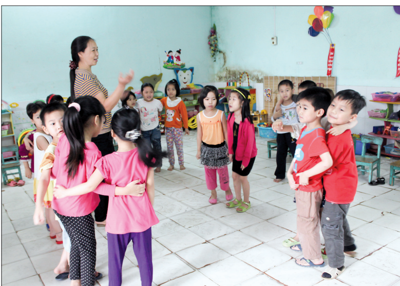
Cô và trò Trường Mầm non Đông Xuân (Đồng Hưng).

giá... Nhờ đó, tỷ lệ giáo viên đạt chuẩn trở lên của cấp mầm non đạt 99,88% (trên chuẩn là 91,5%), cấp tiểu học và THCS đạt 100% (trong đó tiểu học trên chuẩn là 99%, THCS trên chuẩn là 80,7%). Ngành cũng chú trọng và làm tốt việc huy động các nguồn lực tăng cường cơ sở vật chất, thiết bị trường học, xây dựng khuôn viên xanh, sạch, đẹp, thân thiện và hiệu quả, xây dựng trường đạt chuẩn quốc gia. Đến nay, toàn huyện có 70/100 trường đạt chuẩn quốc gia. Chất lượng giáo dục mũi nhọn có sự chuyển biến mạnh mẽ. Kỳ thi học sinh giỏi lớp 9 cấp tỉnh toàn huyện có 8 đội dự thi thì 3 đội xếp thứ nhất, 2 đội xếp thứ nhì, toàn đoàn xếp thứ nhì tính. Tại cuộc thi giao thông dành cho học sinh THCS cấp tỉnh, Đồng Hưng có 36 em dự thi thì 23 em đạt điểm cao nhất