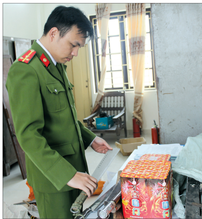
Công an huyện Thái Thụy vận động thu hồi nhiều loại vũ khí và pháo.

Những tháng đầu năm, tình hình tội phạm trên địa bàn huyện Thái Thụy có nhiều diễn biến phức tạp. Đặc biệt, dịp tết Nguyên đán là thời điểm các đối tượng thường lợi dụng sơ hở, mất cảnh giác của người dân để thực hiện hành vi phạm tội, nhất là trộm cắp, cướp giật tài sản, tổ chức đánh bạc, tàng trữ, mua bán, sử dụng trái phép chất ma túy, buôn bán, tự chế và đốt pháo trái phép... Trước tình hình đó, Công an huyện Thái Thụy đã làm tốt công tác nắm tình hình, tham mưu Huyện ủy, UBND huyện chỉ đạo các xã, thị trấn thực hiện quyết liệt, hiệu quả nhiều nội dung, biện pháp bảo đảm ANTT, an toàn giao thông, phòng cháy, chữa cháy, thực hiện Luật Quản lý, sử dụng vũ khí, vật liệu nổ, công cụ hỗ trợ, Nghị định số 137/2022/NĐ-CP của Chính phủ về quản lý, sử dụng pháo trong dịp tết Nguyên đán Nhâm Dần 2022. Trong đó, đã tham mưu ban hành 2 chỉ thị, 4 kế hoạch, 1 công văn, 1 quyết định triển khai công tác bảo đảm ANTT dịp tết Nguyên đán; mở đợt cao điểm thực hiện Luật Quản