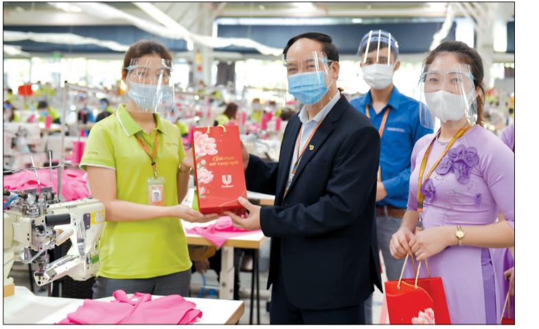
Công đoàn Công ty Tân Đệ trao quà cho công nhân nhà máy Tân Đệ 5 (Kiến Xương).

Sáng ngày 8/3, ban tổ chức cuộc thi minigame 8/3 của Công ty Tân Đệ tổ chức trao 500 suất quà giải ấn tượng và 3.000 suất quà giải nhất cho các công nhân nữ đạt giải cuộc thi.