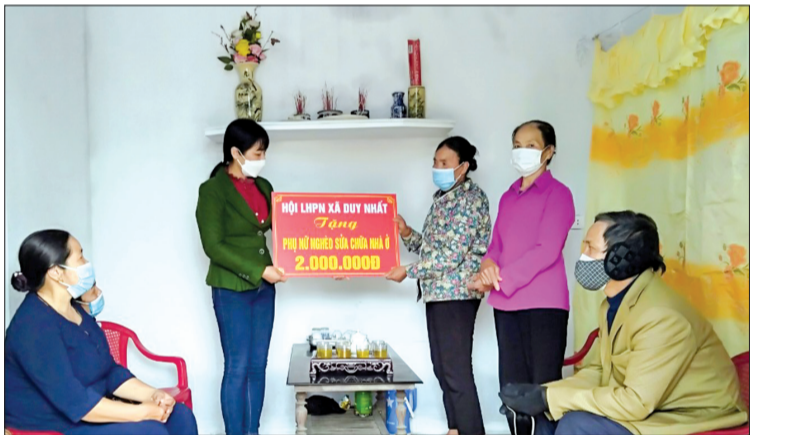
Hội Liên hiệp Phụ nữ xã Duy Nhất (Vũ Thư) trao kinh phí hỗ trợ hội viên sửa chữa nhà ở.

Trong đó, Hội Liên hiệp Phụ nữ huyện trao tặng 10 suất quà trị giá 3 triệu đồng cho hội viên, phụ nữ và trẻ em có hoàn cảnh đặc biệt khó khăn tại các địa phương. Hội liên hiệp phụ nữ các xã, thị trấn trao tặng gần 200 suất quà nhằm giúp đỡ, hỗ trợ hội viên, phụ nữ nghèo thêm chi phí sinh hoạt, sửa chữa nhà ở, tổng trị giá gần 25 triệu đồng.