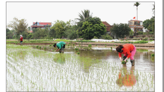
Nông dân huyện Đông Hưng gieo cấy lúa mùa.

Thời vụ gieo cấy lúa mùa diễn ra tập trung trong tháng 7, đây là thời gian được dự báo nắng nóng nhất trong năm. Đối với diện tích mạ chưa cấy, nếu nền bùn quá mỏng cần rắc thêm xỉ than, sử dụng lưới đen che nắng, nếu mạ có biểu hiện thiếu dinh dưỡng, vàng cần không được rắc đạm urê, có thể dùng phân bón qua lá để phân. Bảo đảm độ ẩm cho ruộng mạ bằng việc tưới liên tục, đối với mạ được có thể be bờ giữ nước cho chân ruộng mạ. Cần tranh thủ sáng sớm và chiều mát gieo cấy. Đối với lúa mới cấy, bà con cần giữ mực nước nóng (2 - 3cm) trên mặt ruộng, nếu ruộng cạn hoặc khô cạn sẽ làm bộ rễ không phục hồi, cây bị tấp.