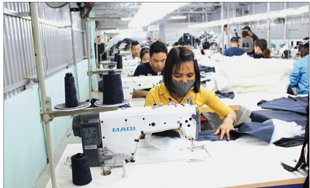
Công ty TNHH May xuất khẩu Quần Thu (thôn Độc Lập, xã Thái Thọ) phát triển từ nguồn vốn tín dụng của Quỹ Tín dụng nhân dân Thái Thọ.

khẩu Quần Thu (thôn Độc Lập, xã Thái Thọ) tâm sự: Mặc dù Công ty mới thành lập chưa đầy 2 năm nhưng Quỹ TDND Thái Thọ vẫn tin tưởng, tạo điều kiện cho gia đình tôi được vay vốn để phát triển sản xuất, kinh doanh. Không phụ lòng tin đó, tôi đã thường xuyên hướng dẫn, đào tạo nâng cao tay nghề cho công nhân, đồng thời tích cực tìm kiếm các đối tác kinh doanh nhằm tạo doanh thu