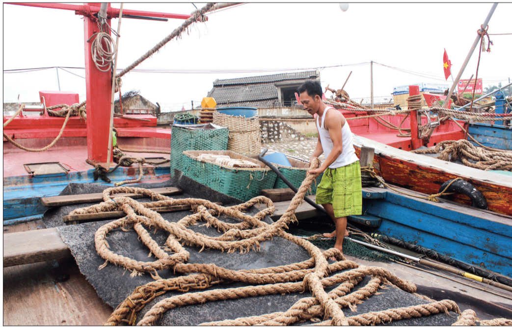
Người dân Thái Thụy neo đậu tàu thuyền vào nơi tránh trú bão.

Là 1 trong 6 xã, thị trấn ven biển của huyện, xã Thụy Trường hiện có hơn 100 hộ dân với 258ha nuôi trồng thủy sản ngoài khơi biển, 44 chòi nuôi ngao/44 lao động tại khu vực bãi triều ven biển; 25 tàu thuyền/50 lao động đang hoạt động khai thác thủy sản trên địa bàn xã nằm trong kế hoạch di dời về khu vực an toàn trước khi có thiên tai xảy ra. Theo ông Đồng Minh Chính, Phó Chủ tịch UBND xã: Những năm gần đây có nhiều cơn bão mạnh nên việc người dân ở lại khu vực ao đầm ngoài khơi biển, trên tàu thuyền khi có bão đổ vào đất liền là rất nguy hiểm. Vì vậy, trước khi có bão vào, xã kiên quyết