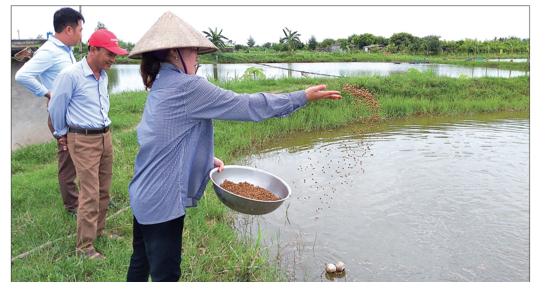
Chị Thủy cho tôm, cá ăn thức ăn có trộn EM tối hàng ngày.