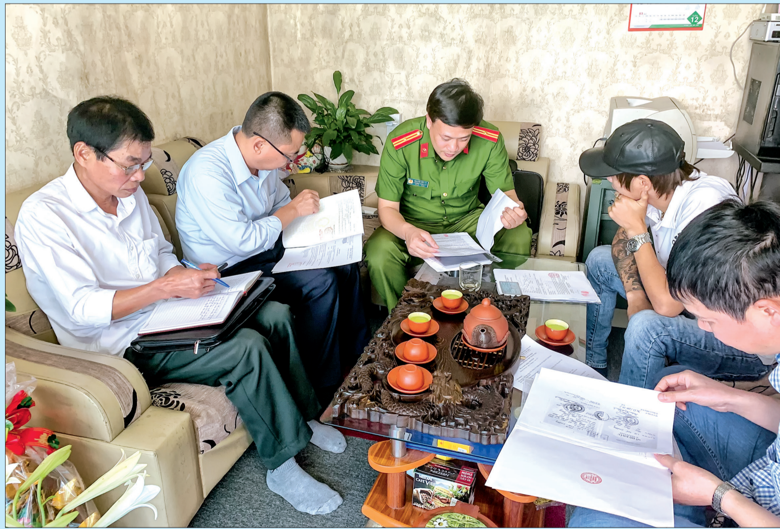
Thành viên đoàn kiểm tra liên ngành làm việc với cơ sở hỗ trợ tài chính, kinh doanh cầm đồ.