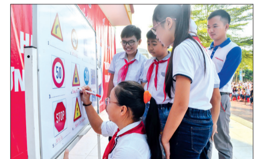
Học sinh tham gia trả lời các câu hỏi về biển báo giao thông.

Trường THCS Hoàng Diệu (thành phố Thái Bình) phối hợp với Công ty TNHH Kinh doanh xe máy Kường Ngân vừa tổ chức tuyên truyền thực hiện an toàn giao thông và việc đội mũ bảo hiểm khi ngồi trên xe máy, xe đạp điện.