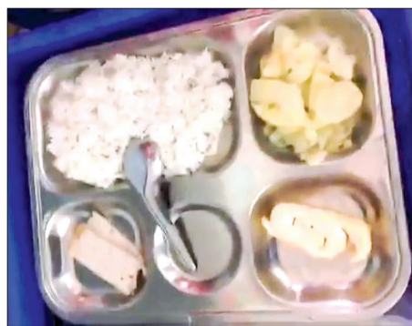
Suất ăn của học sinh trưa ngày 13/3 do phụ huynh học sinh kiểm tra, chụp lại.

sinh ăn bán trú đông nhất thành phố với 1.653 em. Trước sự việc trên, Phòng đã chỉ đạo Ban giám hiệu Trường Tiểu học Kỳ Bá làm rõ, xử lý nghiêm và chấn chỉnh ngay việc tổ chức ăn bán trú cho học sinh. Theo đó, hàng ngày, phân công lãnh đạo nhà trường trực bán trú, phân công người giao nhận thực phẩm, kiểm tra chất lượng thực phẩm tươi sống, giám sát khâu chế biến, chia, cấp phát thức ăn, lưu mẫu theo quy định. Tăng cường vai trò của các tổ chức đoàn thể và vai trò giám sát của ban đại diện cha mẹ học sinh; lập, lưu trữ hồ sơ sổ sách theo quy định, cập nhật ghi chép đầy đủ hàng ngày... Tất cả để đạt mục tiêu cao nhất là bảo đảm chất lượng và khẩu phần ăn của học sinh.