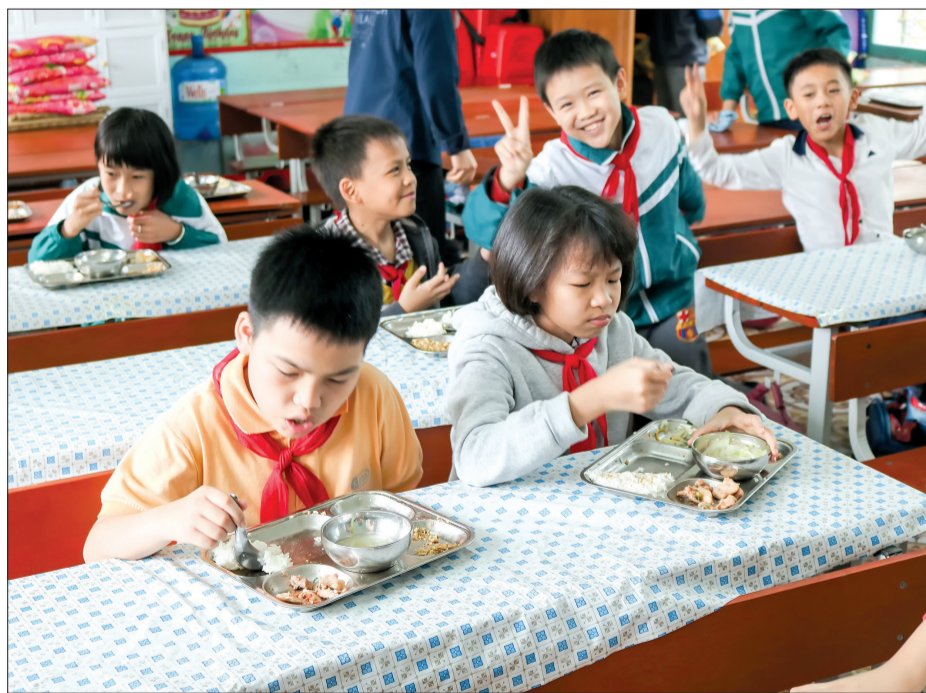
Học sinh Trường Tiểu học Kỳ Bá tại bữa ăn trưa ngày 14/3.

Mấy ngày qua, một clip được phụ huynh chia sẻ trên trang facebook cá nhân khiến dư luận rất bức xúc với việc suất ăn bán trú "thừa" cơm, thiếu thịt của các em học sinh Trường Tiểu học Kỳ Bá (thành phố Thái Bình). Phóng viên Báo Thái Bình đã tìm hiểu để làm rõ sự việc trên.