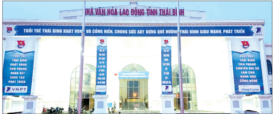
Nhà Văn hóa Lao động tỉnh - nơi diễn ra hội nghị.

Sáng ngày 21/3, tại Nhà Văn hóa Lao động tỉnh sẽ diễn ra hội nghị tiếp xúc, đối thoại giữa Thường trực Tỉnh ủy và đoàn viên, thanh niên với chủ đề: “Tuổi trẻ Thái Bình khát vọng và cống hiến, chung sức xây dựng tỉnh Thái Bình giàu mạnh, phát triển”.