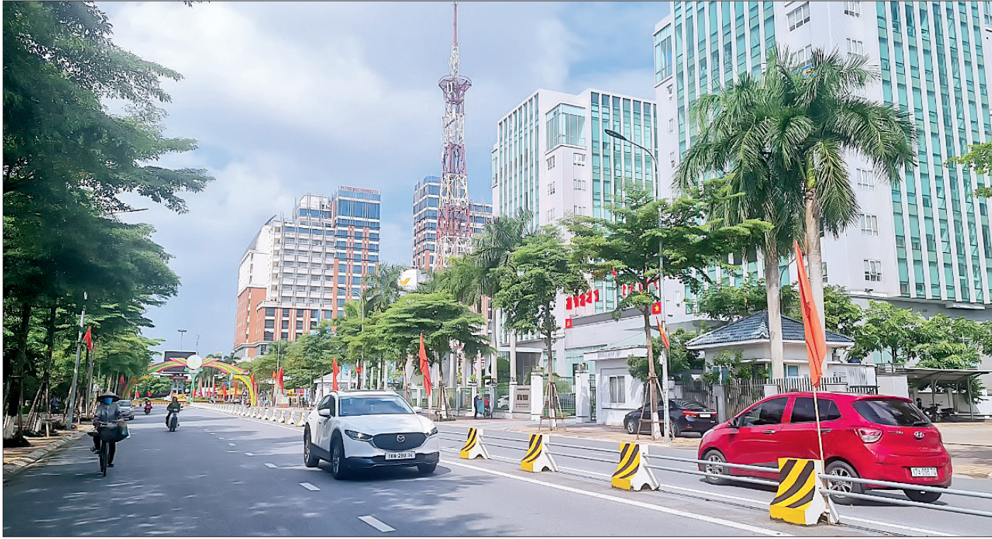
Thành phố Thái Bình.

Ngày 21/3/1890, Toàn quyền Đông Dương ra nghị định thành lập tỉnh Thái Bình, chính thức đánh dấu Thái Bình trở thành đơn vị hành chính trực thuộc nhà nước trung ương. Mặc dù là tỉnh được thành lập muộn song đất và người Thái Bình đã có từ hàng nghìn năm. Trải qua bao thăng trầm thời gian, vượt qua mọi khó khăn, thử thách khắc nghiệt, bằng tinh thần đoàn kết và lòng dũng cảm, người Thái Bình đã vận dụng linh hoạt, sáng tạo sức mạnh tạo nên những đột phá trong tư duy và hành động, đưa Thái Bình tiến nhanh, tiến vững chắc trong giai đoạn cách mạng mới.