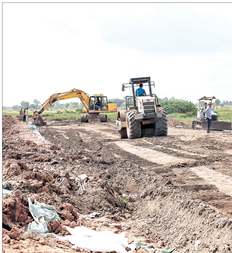
Dự án tuyến đường bộ ven biển đoạn qua xã Thụy Tân (Thái Thụy) đang thi công.

Mục tiêu phát triển chủ yếu là khai thác và phát huy có hiệu quả các tiềm năng, lợi thế của khu vực ven biển để xây dựng, phát triển Khu kinh tế theo mô hình khu kinh tế tổng hợp, đa ngành, năng động, hiệu quả và phát triển bền