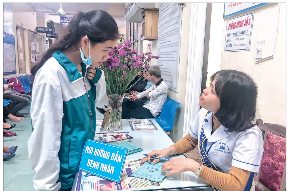
Bệnh viện bố trí cán bộ đón tiếp, hỗ trợ hướng dẫn người dân đến khám bệnh.