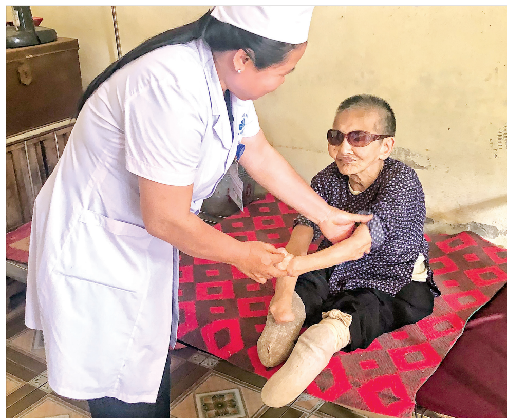
Khám bệnh cho bệnh nhân phong tàn tật.

người bệnh. Bệnh viện cũng đồng thời triển khai đề án liên doanh liên kết, đầu tư mua sắm trang thiết bị hiện đại phục vụ người bệnh bằng nhiều hình thức; cử cán bộ đi học nâng cao trình độ chuyên môn và triển khai thực hiện một số dịch vụ, kỹ thuật mới trong điều trị và chăm sóc như nâng cơ trẻ hóa da, xóa nếp nhăn; kỹ thuật đắp thuốc, chiếu tia UVB dải hẹp