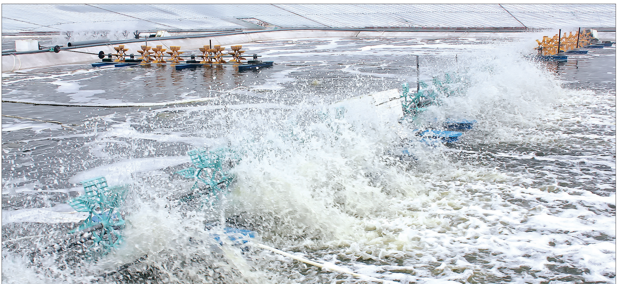
Mô hình nuôi tôm công nghiệp tại xã Thái Thượng (Thái Thụy).

Nhằm đẩy mạnh phát triển mối quan hệ đối tác hải quan - doanh nghiệp, dần xóa bỏ khoảng cách giữa cơ quan hải quan và cộng đồng doanh nghiệp, ngay từ đầu năm, Chi cục Hải quan Thái Bình đã chú trọng thực hiện các giải pháp từ đó tạo điều kiện thuận lợi cho doanh nghiệp mở rộng và phát triển. Cùng với việc tổ chức hội nghị hướng dẫn các doanh nghiệp trên địa bàn lập báo cáo quyết toán theo Thông tư số 39/2018/TT-BTC của Bộ Tài chính và giải đáp các vướng mắc về thủ tục hải quan, Chi cục Hải quan Thái Bình còn duy trì thực hiện có hiệu quả việc ký thỏa thuận với Hiệp hội Doanh nghiệp tỉnh đồng thời tích cực ứng dụng công nghệ thông tin nhằm cắt giảm tối đa các thủ tục hành chính, từ đó giảm thời gian thông quan cho doanh nghiệp. Đến nay, toàn tỉnh có 190 doanh nghiệp đang làm thủ tục tại Chi cục Hải quan Thái Bình; tổng kim ngạch xuất khẩu đến hết tháng 3/2019 đạt 336 triệu USD, tăng 6% so với cùng kỳ năm 2018; tổng thu thuế xuất nhập khẩu đến ngày 8/4 đạt 332,3 tỷ đồng, đạt 33% kế hoạch năm 2019.