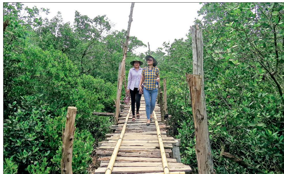
Đến cồn Đen, du khách có thể đi cầu tre xuyên rừng ngập mặn dài nhất Việt Nam để khám phá thiên nhiên kỳ thú.