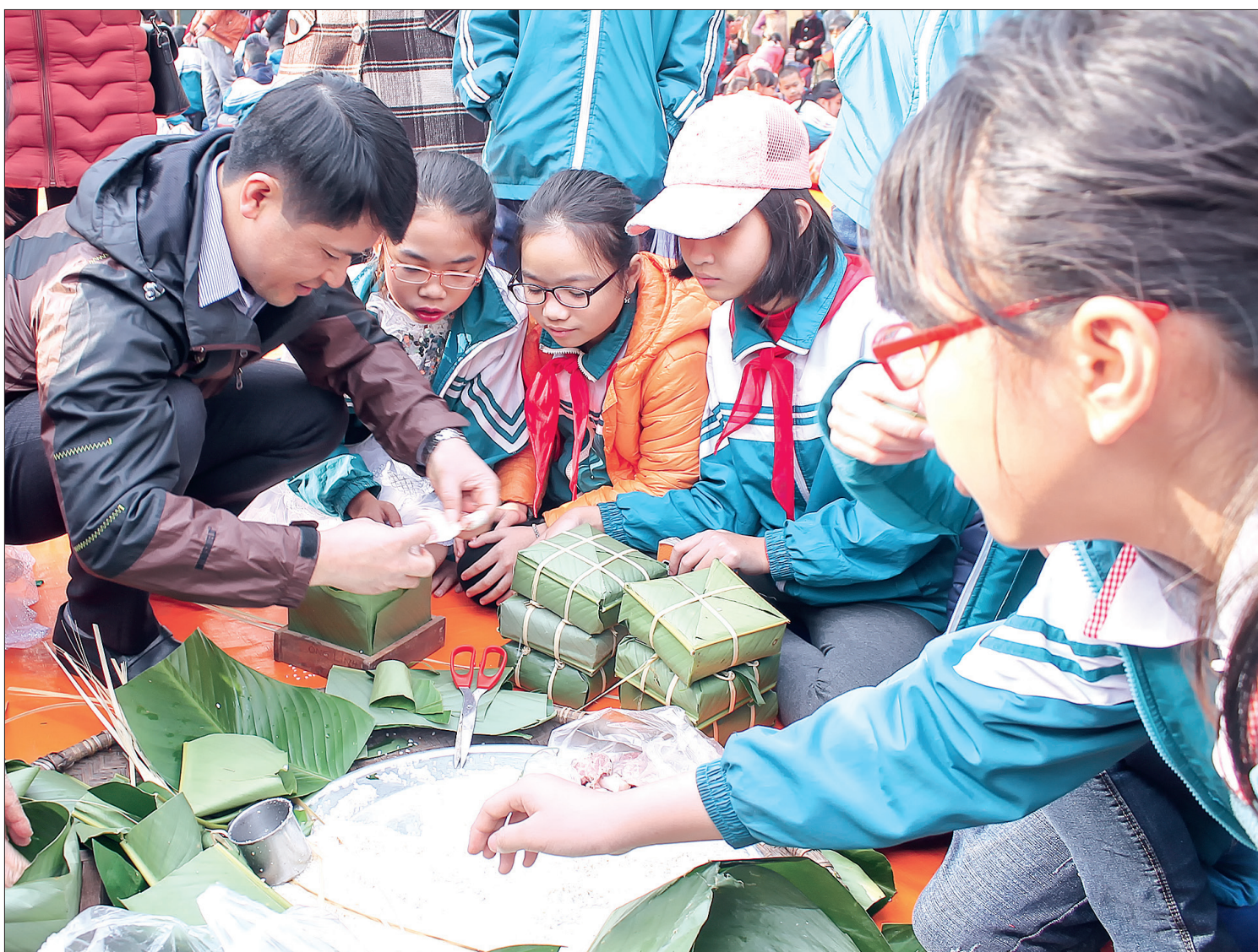
Phụ huynh và học sinh Trường Tiểu học thị trấn Vũ Thu tham gia giờ học trải nghiệm gói bánh chưng.

Những ngày vừa qua, dư luận xã hội lại thêm một lần phẫn nộ trước vụ việc một học sinh của một trường THCS tại Hưng Yên bị 5 học sinh cùng lớp lột quần áo, bạo hành ngay tại lớp học. Dư luận không khỏi phẫn uất trước hình ảnh một cô học sinh bé nhỏ, không quần áo, chỉ biết ngồi co rúm người khóc lóc trong khi các em khác thay nhau đánh, đá vào mặt, vào người và càng bức xúc hơn trước thông tin đây không phải là lần đầu em học sinh này bị các bạn đánh mà chưa có sự ngăn cản kịp thời của nhà trường và giáo viên. Khi vụ việc của nữ sinh ở Hưng Yên chưa kịp lắng thì lại thêm một vụ bạo lực trong học sinh nữa xuất hiện. Một nữ sinh khác ở thị xã Quảng Yên (Quảng Ninh) vừa bị “đánh hội đồng” phải nhập viện vào ngày 6/4.