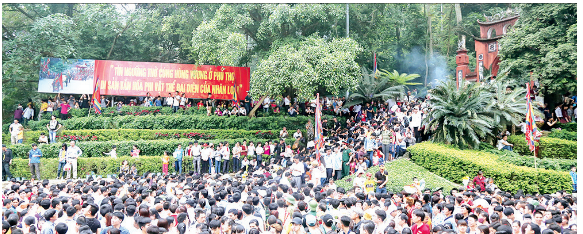
Hàng triệu con dân đất Việt hành hương về Đất Tổ mỗi dịp Giỗ Tổ Hùng Vương - Lễ hội Đền Hùng.