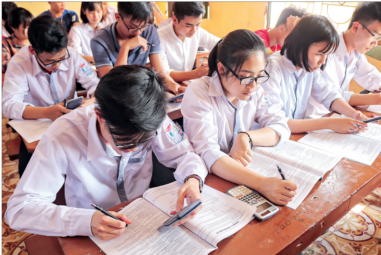
Giờ học của học sinh Trường THPT Tiên Hưng.

Chuẩn bị cho kỳ thi THPT quốc gia năm 2019 là một trong những nhiệm vụ được ngành Giáo dục chú trọng triển khai ngay từ đầu năm học. Đến thời điểm này, các điều kiện tổ chức kỳ thi đang được toàn ngành tiếp tục thực hiện, bảo đảm một mùa thi an toàn, hiệu quả.