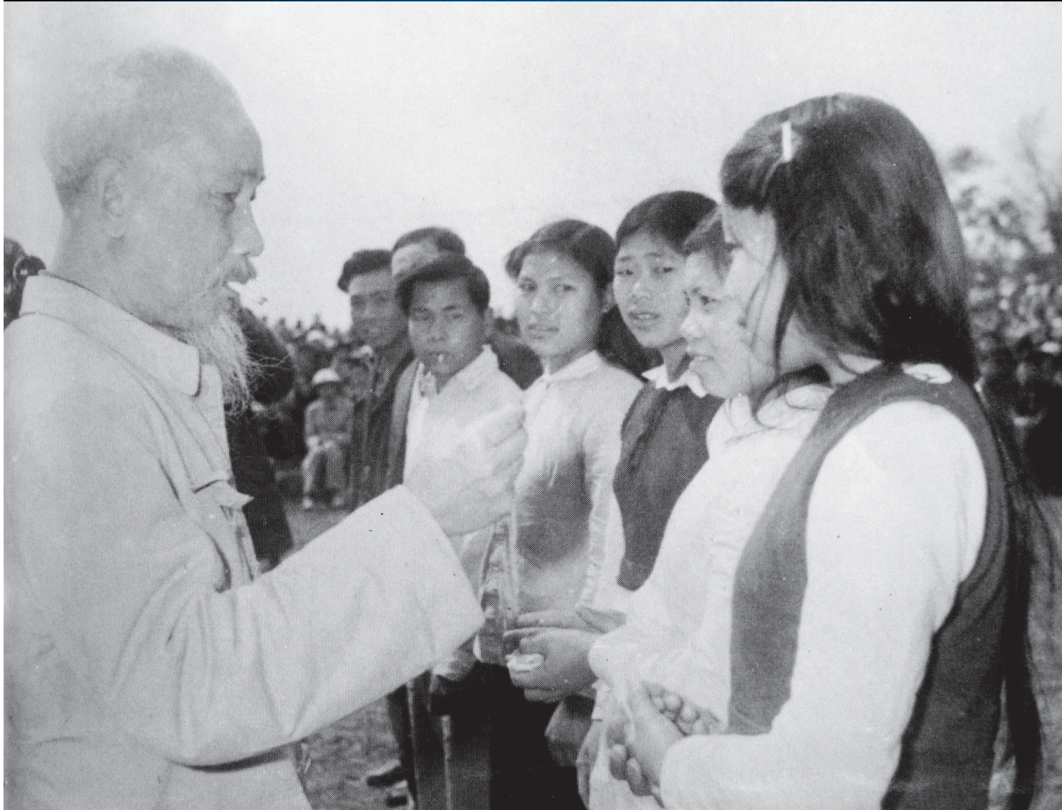
Chủ tịch Hồ Chí Minh thưởng Huy hiệu cho các chiến sĩ thi đua và lao động tiên tiến xã Nam Cường, huyện Tiên Hải, ngày 26/3/1962.

Năm 2019, nhiều ngày lễ, ngày kỷ niệm lớn diễn ra trên cả nước trong đó có các hoạt động kỷ niệm 50 năm thực hiện Di chúc của Chủ tịch Hồ Chí Minh.