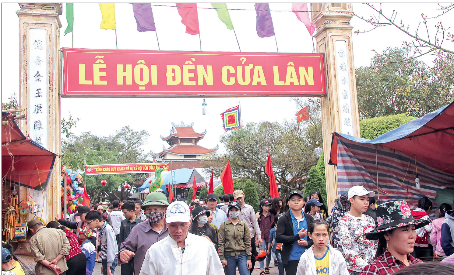
Du khách thập phương đến lễ hội đền Cửa Lân.

Đền Cửa Lân (còn gọi là đền Bà) thuộc xã Đông Minh (Tiền Hải) được xây dựng vào thế kỷ XIX, khoảng năm 1835 sau khi Doanh điền sứ Nguyễn Công Trứ mở mang bờ cõi khai sinh ra đất Tiên Châu, nay là huyện Tiền Hải.