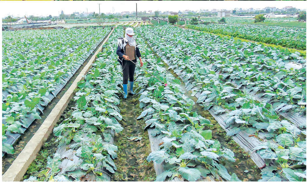
Vùng trồng cây rau màu của xã Quỳnh Hải (Quỳnh Phụ).