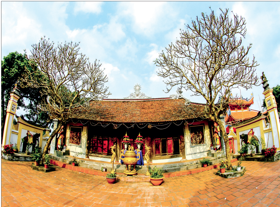
Trải ngàn năm, đền Năm Thôn vẫn trầm mặc bên dòng Bích Giang.