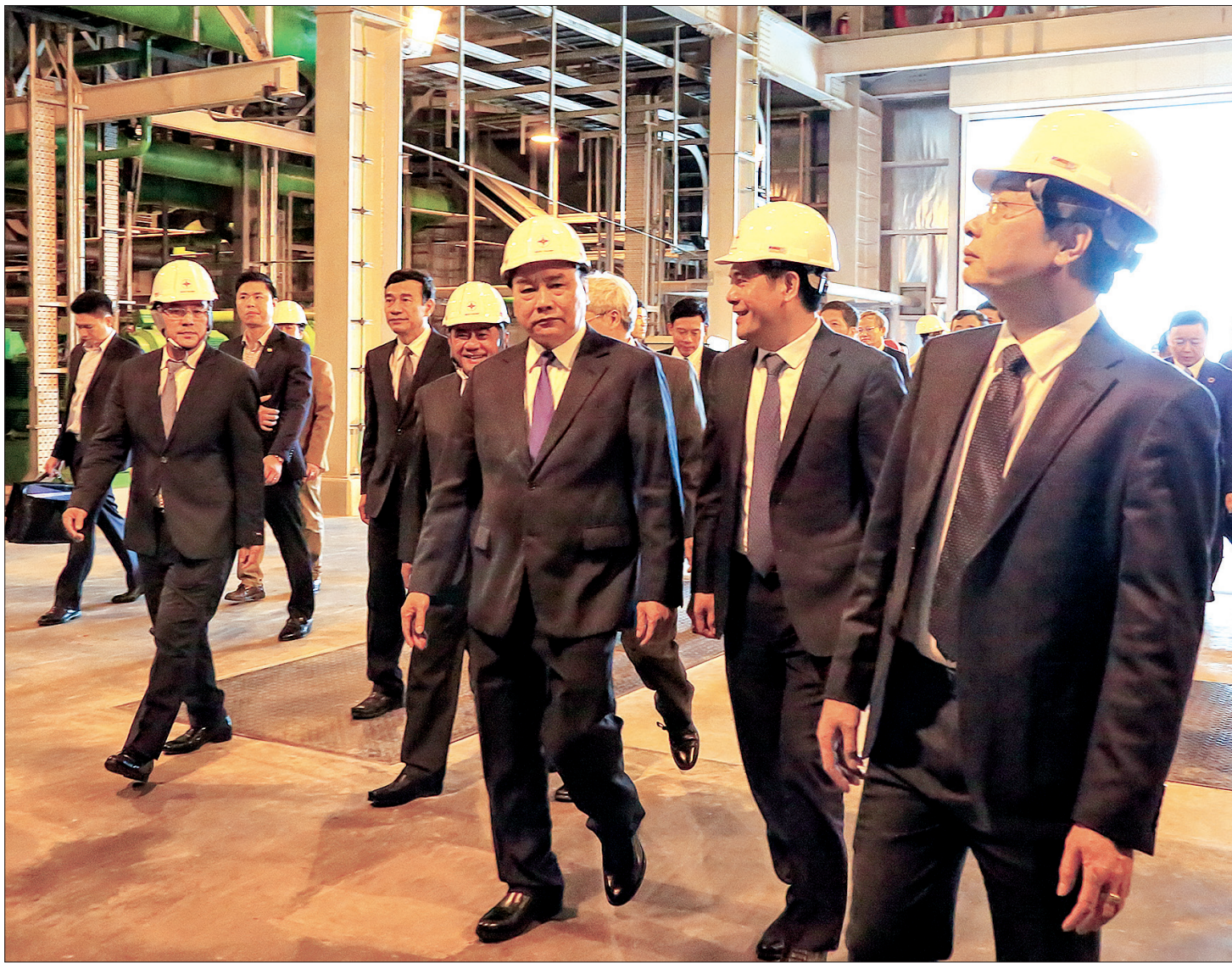
Thủ tướng Chính phủ Nguyễn Xuân Phúc cùng các đồng chí lãnh đạo tỉnh thăm Nhà máy nhiệt điện Thái Bình ngày 14/2/2019.