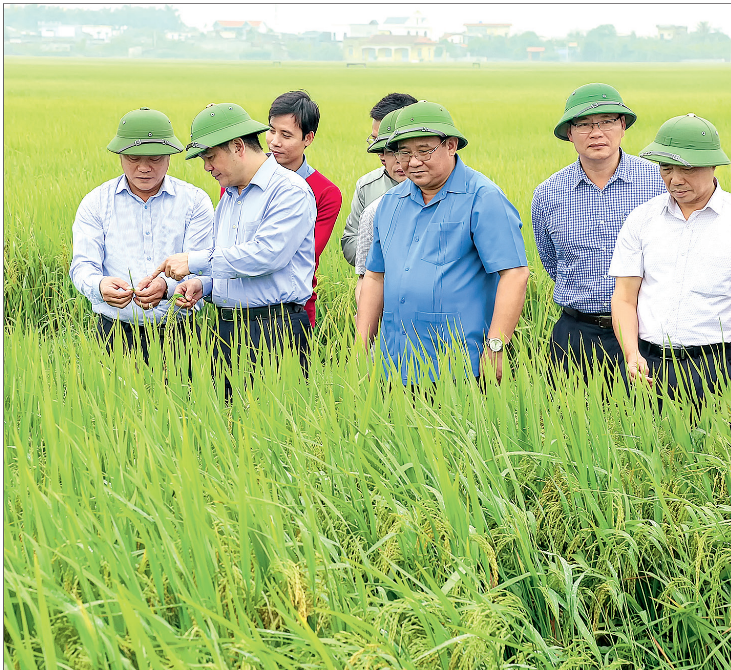
Đồng chí Nguyễn Hồng Diên, Ủy viên Trung ương Đảng, Bí thư Tỉnh ủy, Chủ tịch HĐND tỉnh kiểm tra sản xuất nông nghiệp tại xã Vân Trường (Tiên Hải).

Thái Bình là tỉnh top đầu các tỉnh, thành phố khu vực đồng bằng Bắc Bộ 3 năm liên tiếp tăng trưởng kinh tế đạt 2 con số, cán đích trước thời hạn các mục tiêu phát triển kinh tế - xã hội Nghị quyết Đại hội Đảng bộ tỉnh lần thứ XIX đề ra. Trên nền tảng những thành tựu đã đạt được, với cơ hội “thiên thời, địa lợi, nhân hòa”, Thái Bình đã và đang có nhiều giải pháp bứt phá để sớm trở thành tỉnh công nghiệp, nông nghiệp theo hướng hiện đại như mong muốn của Thủ tướng Chính phủ trong dịp về dự lễ khởi công các công trình trọng điểm đầu xuân 2019. Nhân dịp này, phóng viên đã có cuộc phỏng vấn đồng chí Nguyễn Hồng Diên, Ủy viên Trung ương Đảng, Bí thư Tỉnh ủy, Chủ tịch HĐND tỉnh.