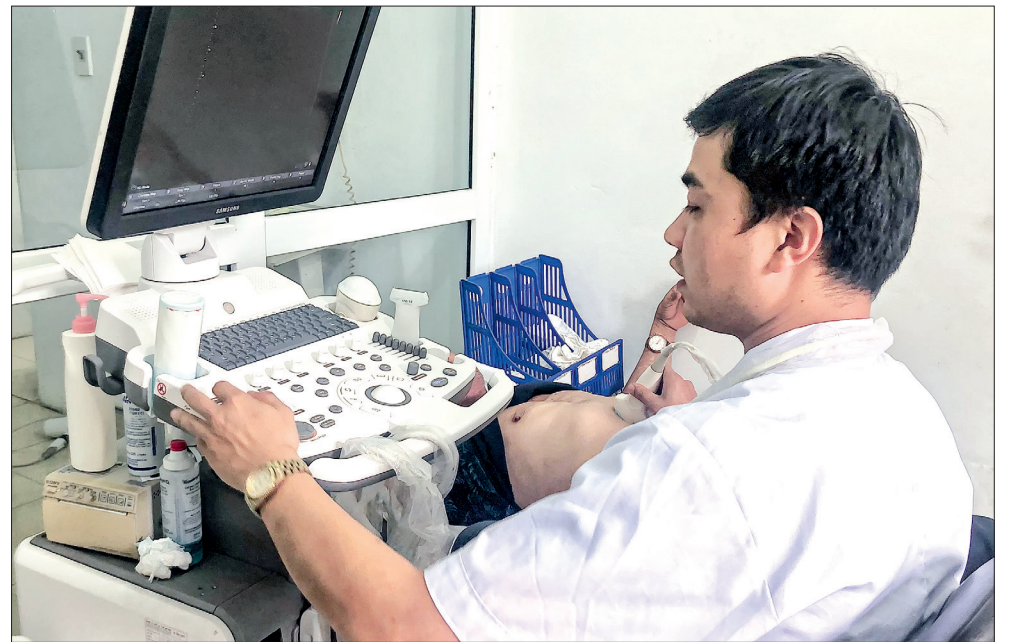
Bệnh viện Da liễu Thái Bình đầu tư máy siêu âm hiện đại phục vụ bệnh nhân.

chuyên môn nghiệp vụ, góp sức xây dựng Bệnh viện cũng như ngành da liễu Thái Bình ngày càng phát triển vững mạnh.