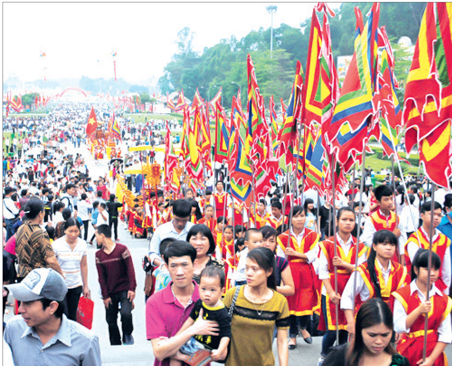
Con Lạc cháu Hồng từ khắp mọi miền hành hương về Đất Tổ.

Có lẽ trên thế giới hiếm có nơi nào lại có hình thức tín ngưỡng thờ tổ tiên độc đáo như ở Việt Nam khiến chúng ta phải nhìn nhận nó như một hiện tượng xã hội mang bản sắc riêng của dân tộc, góp phần tạo nên hệ giá trị tinh thần và bản sắc văn hóa dân tộc. Đó là truyền thống thờ gia tiên trong từng gia đình, thờ tổ họ của dòng họ, thờ thành hoàng của làng và thờ tổ chung của đất nước ở Đền Hùng.