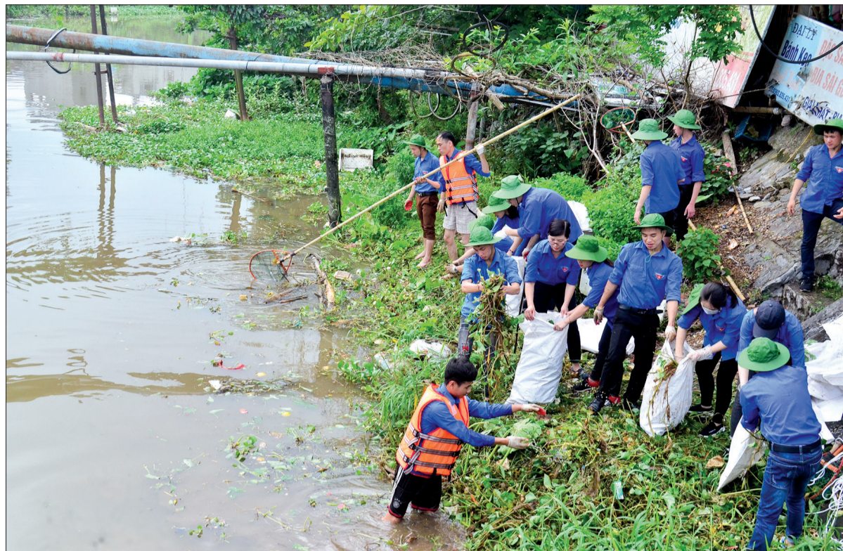
Hoạt động bảo vệ dòng sông quê hương được các cấp bộ đoàn tổ chức thường xuyên.

Ngày Chủ nhật xanh đã trở thành phong trào sôi nổi trong các cấp bộ đoàn, góp phần nâng cao nhận thức, hành vi của tuổi trẻ và nhân dân trong việc giữ gìn môi trường xanh - sạch - đẹp.