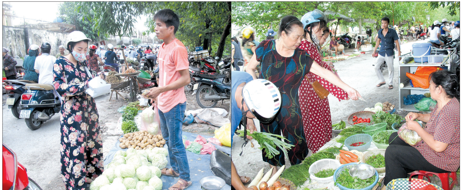
Giá rau tiếp tục tăng cao, đặc biệt là các loại rau thơm giá tăng gấp nhiều lần.