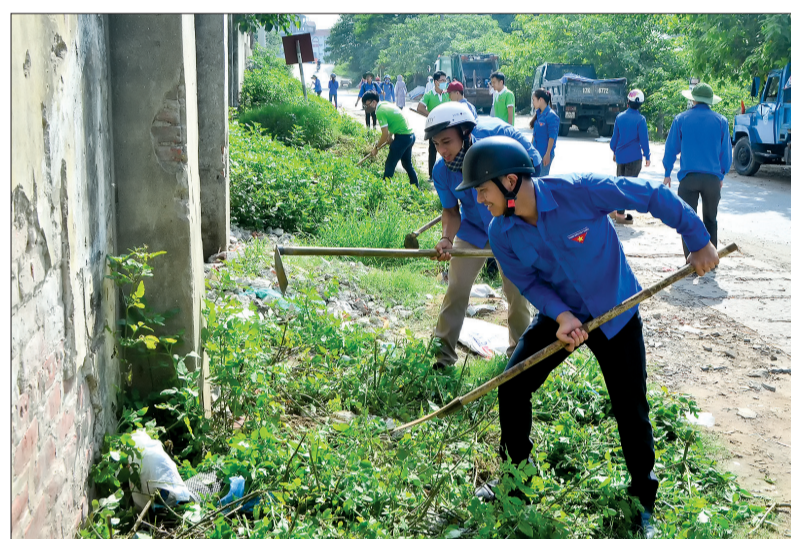
Đoàn viên, thanh niên phát quang bụi rậm khu vực chợ hải sản (phường Lê Hồng Phong, thành phố Thái Bình).