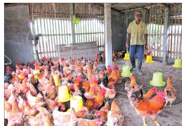
Chuồng trại chăn nuôi bảo đảm luôn khô ráo, thông thoáng, đủ ánh sáng, che chắn tránh mưa tạt, gió lùa.