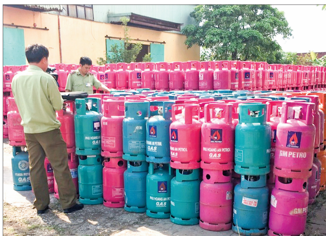
242 bình gas không rõ nguồn gốc được cơ quan quản lý thị trường phát hiện, thu giữ.