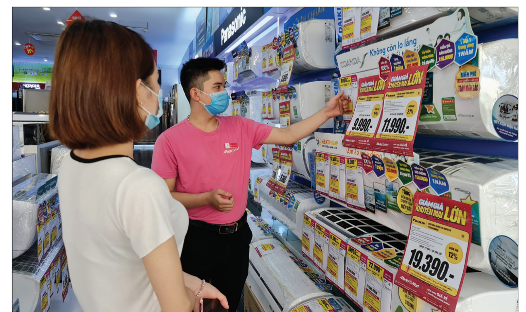
Các siêu thị, cửa hàng kinh doanh điện tử, điện lạnh áp dụng nhiều chính sách khuyến mãi để kích cầu tiêu dùng.