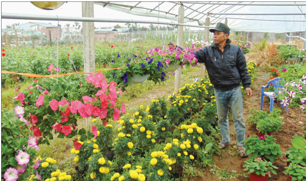
Nông dân xã Vũ Chính (thành phố Thái Bình) phát triển mô hình trồng hoa từ nguồn vốn ưu đãi của Chính phủ.

Mặc dù có tỷ lệ hộ nghèo thấp nhất tỉnh, chiếm 1,31% với 903 hộ; hộ cận nghèo còn 1,4% với 960 hộ nhưng thời gian qua thành phố Thái Bình luôn chú trọng thực hiện các giải pháp nâng cao hiệu quả vốn tín dụng chính sách, coi đây là đòn bẩy quan trọng thực hiện thắng lợi chương trình mục tiêu quốc gia giảm nghèo bền vững của địa phương.