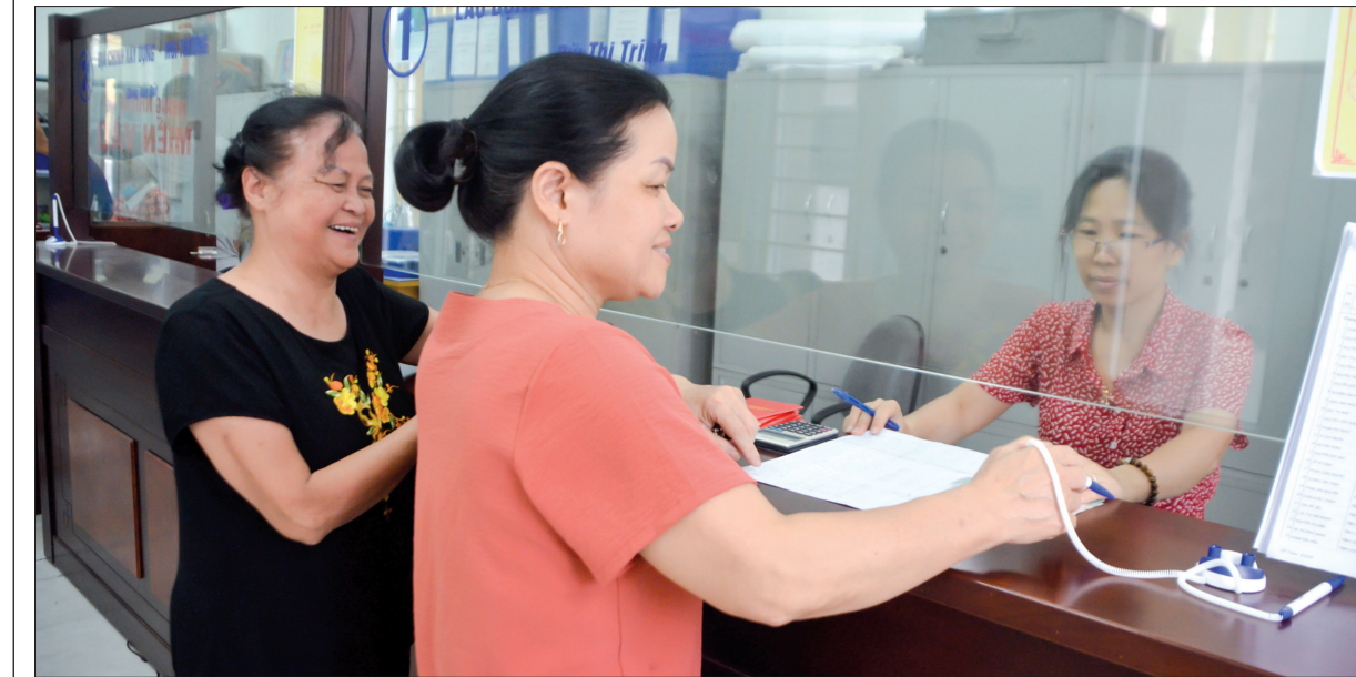
Lao động bị mất việc làm phường Đê Thâm (thành phố Thái Bình) hoàn thiện các thủ tục nhận tiền hỗ trợ.