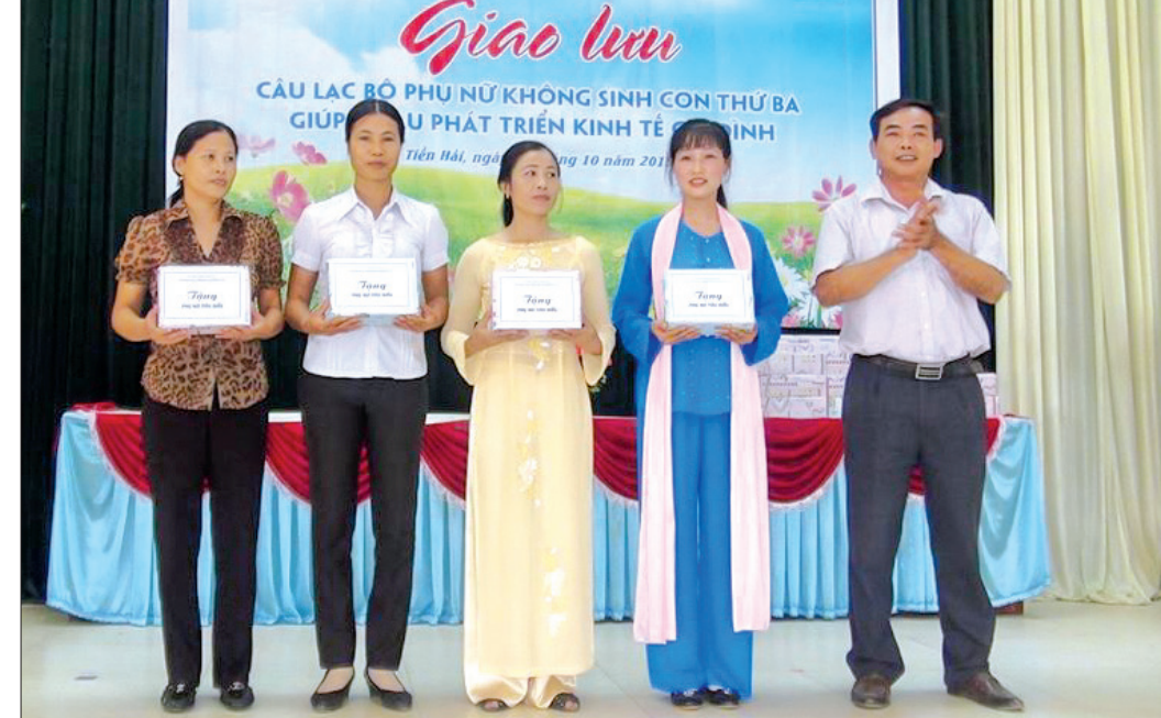
Tặng quà phụ nữ tiêu biểu thực hiện tốt chính sách dân số - KHHGD huyện Tiên Hải.