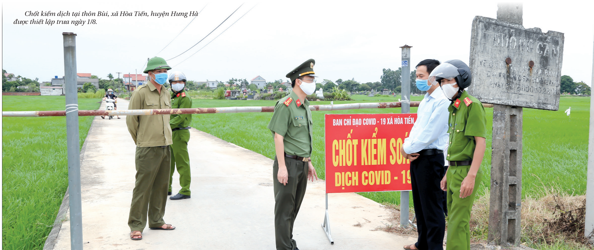
Chốt kiểm dịch tại thôn Bù, xã Hòa Tiến, huyện Hưng Hà được thiết lập trưa ngày 1/8.