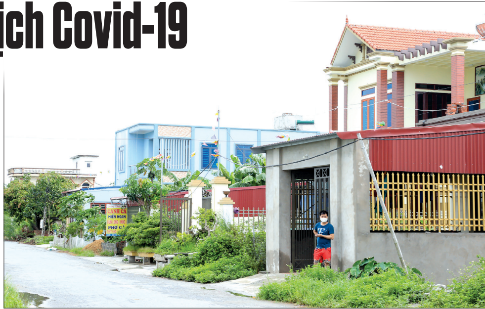
Một khu dân cư xã Hòa Tiến (Hưng Hà) trong thời gian giãn cách.