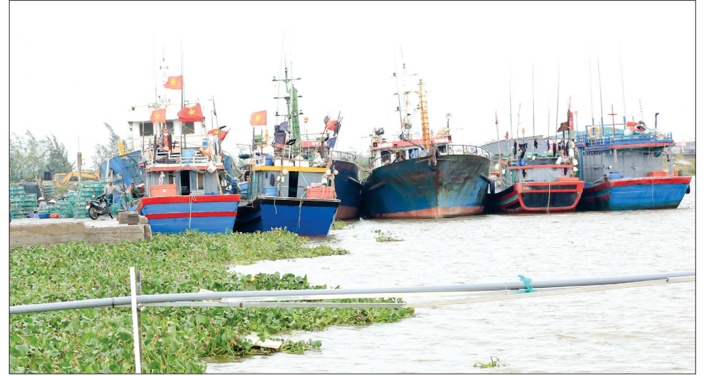
Tàu thuyền khai thác hải sản của ngư dân Tiên Hải về neo đậu tránh trú bão tại Cửa Lân an toàn.