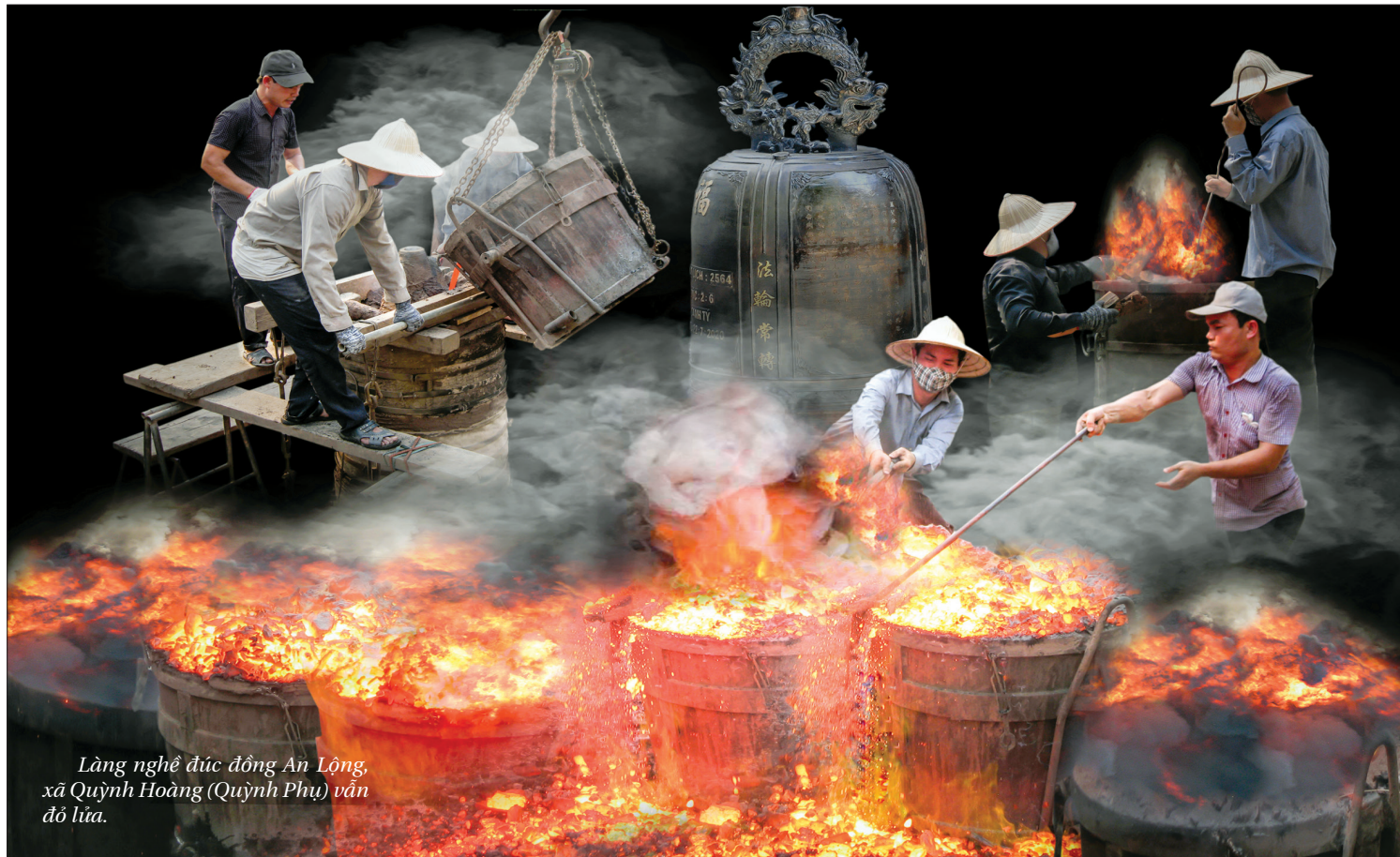
Làng nghề đúc đồng An Lộng, xã Quỳnh Hoàng (Quỳnh Phụ) vẫn đổ lửa.