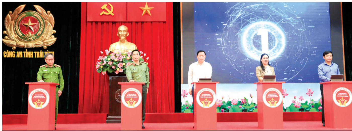
Các đồng chí lãnh đạo tỉnh và đại biểu bấm nút phát động cuộc thi.