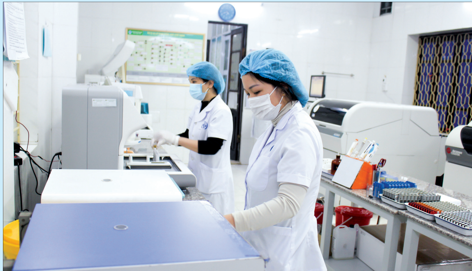
Nhân viên y tế Bệnh viện Đa khoa tỉnh làm các mẫu xét nghiệm.