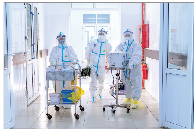
Công việc buổi sáng bắt đầu bằng việc lấy mẫu xét nghiệm, cấp đồ ăn sáng cho bệnh nhân, sau đó các bác sĩ, nhân viên y tế sẽ đi khám, phát thuốc, thực hiện đo chỉ số SpO2.

Ảnh do bác sĩ Ngọc Ánh (Bệnh viện Phổi Thái Bình) cung cấp