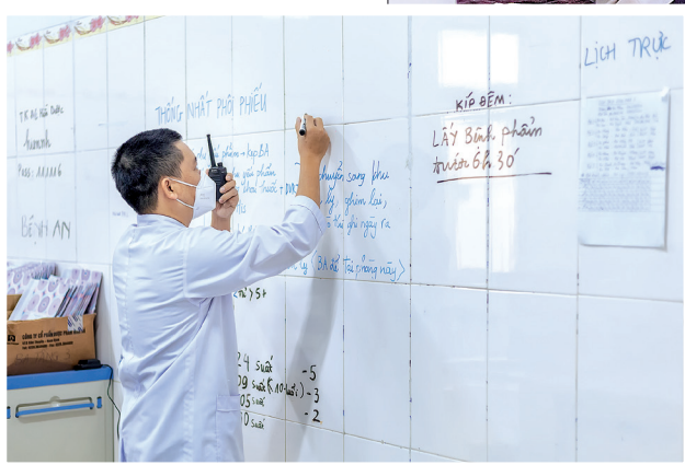
Bộ phận trực hành chính tiếp nhận, xử lý thông tin. Đa dạng thông tin được ghi trên "tấm bảng" sáng tạo mùa dịch.