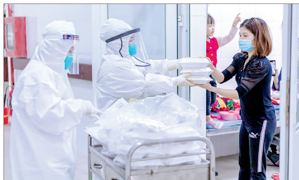
Xong công việc chuyên môn, các bác sĩ lại tất bật chuẩn bị bữa trưa, tối cho bệnh nhân.