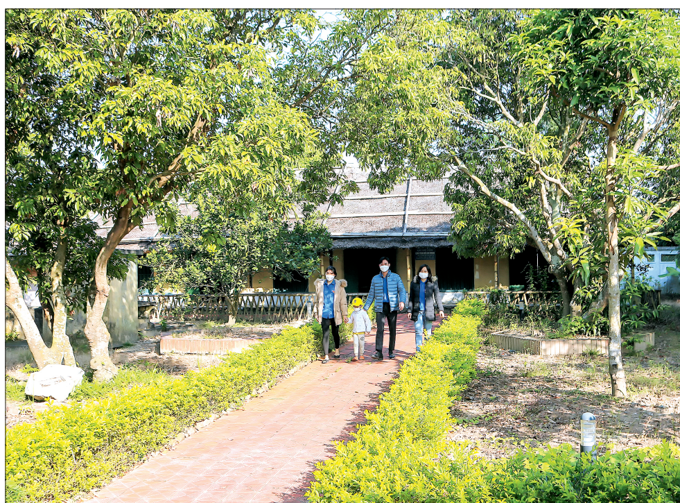
Căn nhà lá tại Khu lưu niệm Bác Hồ (xã Tân Hòa, huyện Vũ Thư).