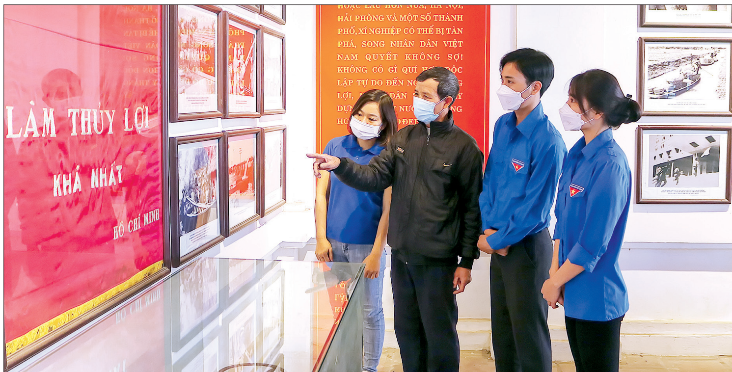
Giáo dục truyền thống cách mạng tại Khu lưu niệm Bác Hồ (xã Tân Hòa, huyện Vũ Thư).

Vào một buổi chiều cuối năm, ngày 31/12/1966, Đảng bộ và nhân dân Thái Bình vinh dự được đón Bác Hồ về thăm, thưởng công mừng tinh đạt năng suất 5 tấn thóc/ha. Đêm đó, Bác nghỉ lại khu sơ tán của Văn phòng Tỉnh ủy ở thôn Đại Đồng, xã Tân Hòa (Vũ Thư). Sáng hôm sau, ngày 1/1/1967, Bác có buổi nói chuyện với cán bộ và nhân dân Thái Bình tại đình Phương Cáp, xã Hiệp Hòa. Qua 55 năm, hình ảnh thân thương vị Cha già dân tộc mãi khắc ghi trong lòng người dân Tân Hòa, những lời căn dặn của Người trở thành điểm tựa để Tân Hòa vượt khó vươn lên.