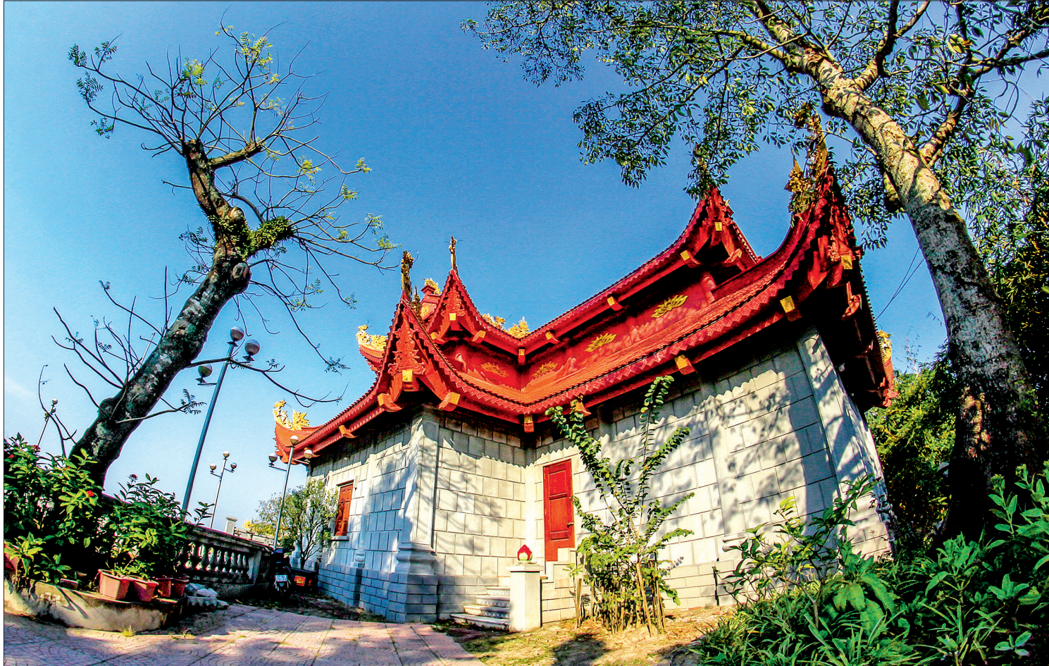
Đền Thượng Ngạn dân gian thường gọi đền nhà vua, làng Ngạn, xã Văn Lang, huyện Hưng Hà, nơi thực hành nghi lễ thờ cúng Hùng Vương độc đáo của Thái Bình.