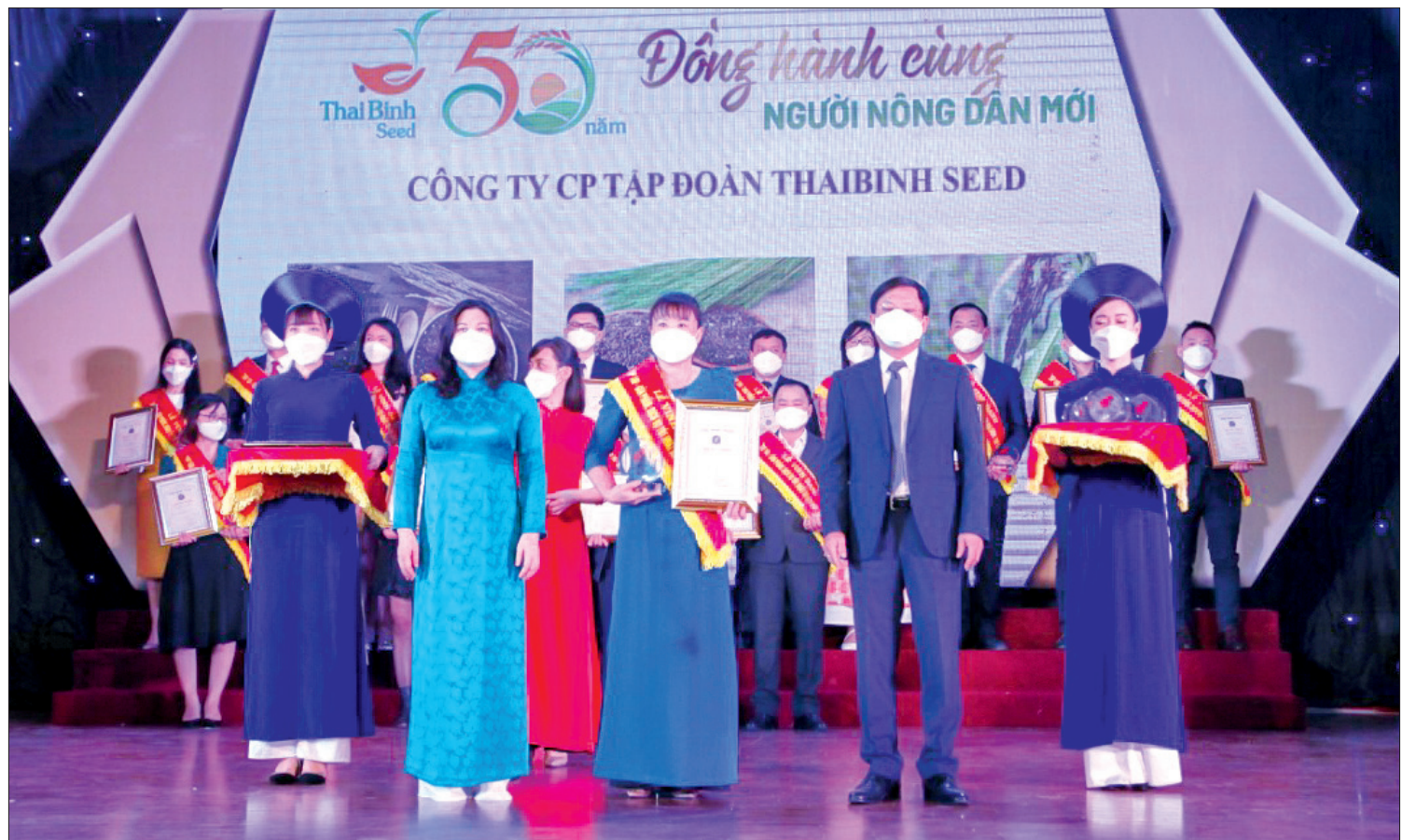
Gạo dinh dưỡng lứt tím ThaiBinh Seed nằm trong top 100 sản phẩm, dịch vụ tốt nhất cho gia đình, trẻ em.

doanh ThaiBinh Seed cho biết: Gạo dinh dưỡng lứt tím ThaiBinh Seed được sản xuất từ giống lúa tím bản quyền của Công ty - đơn vị có lịch sử 50 năm nghiên cứu chọn tạo giống. Vì vậy, với mỗi sản phẩm gạo của ThaiBinh Seed nói chung và gạo dinh dưỡng lứt tím nói riêng đều được sản xuất theo quy trình khép kín và được quản lý chặt chẽ từ khâu chọn giống, kỹ thuật gieo trồng cho đến đầu ra của thành phẩm gạo. Với hàm lượng dinh dưỡng cao, tốt cho sức khỏe gạo dinh dưỡng lứt tím ThaiBinh Seed có rất nhiều công dụng: giảm cân, chống béo phì; chống lão hóa, đẹp da; ngăn ngừa bệnh tim mạch; tốt cho người bệnh tiểu đường; hỗ trợ tiêu hóa tốt, ổn định đường ruột; duy trì hệ thần kinh khỏe mạnh; tăng cường “sức khỏe” của xương. Khi nấu không cần phải ngâm gạo trước, để nấu như