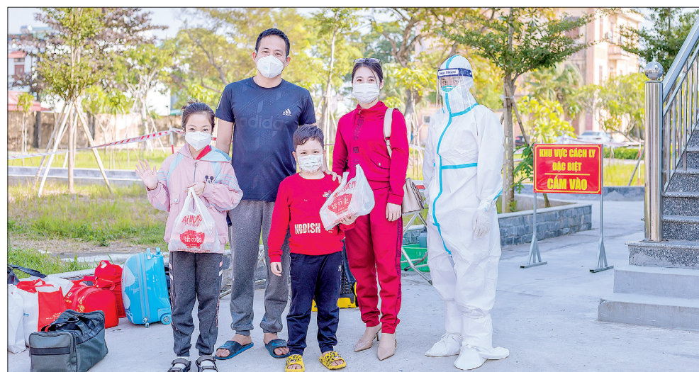
Niềm vui của các bệnh nhân và các bác sĩ khi bệnh nhân đủ điều kiện xuất viện, được về nhà. Từ ngày 22/11 đến ngày 3/12, Bệnh viện đã điều trị khỏi cho hơn 200 bệnh nhân Covid-19.