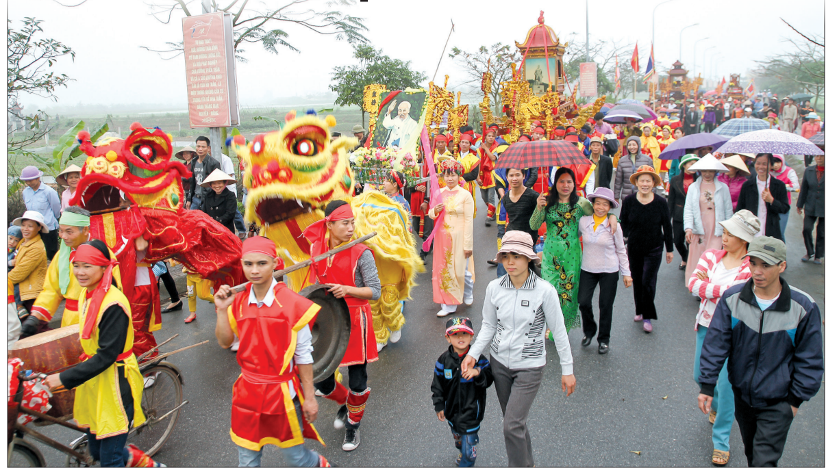
Lễ rước bộ truyền thống đến A Sào.

Am Qua, bến Tượng, đặc biệt tên gọi A Sào mang ý nghĩa là cái ổ, cái tổ của nhà Trần là một sự tôn vinh độc đáo, nhà Trần lập A Sào thành Đệ nhị Sinh tử (đứng sau Kiếp Bạc). Đặc biệt, trong cuộc kháng chiến chống quân Nguyên Mông lần thứ ba (1288), địa danh A Sào nơi đại bại bán doanh của Hưng Đạo Đại Vương Trần Quốc Tuấn đã đi vào lịch sử dân tộc và trường tồn cùng năm tháng với những chiến công vĩ đại. Sử sách còn ghi, khi Hưng Đạo Đại Vương đưa quân về Đệ nhị Sinh tử, con voi chiến bị sa xuống bãi lầy lớn ven sông, dân chúng cứu voi nhưng không được đã dùng thuyền mảng đưa Trần Hưng Đạo cùng tượng sĩ vượt sông và già hàng nghìn chiếc bánh giầy làm lương thực cho quân sĩ nhà Trần trên đường tiến công. Con vật trung nghĩa nhìn chủ tướng ứa nước