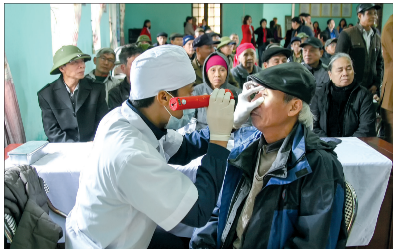
Hoạt động khám bệnh, tư vấn và cấp thuốc miễn phí cho đối tượng chính sách, người cao tuổi xã An Bồi của Huyện đoàn Kiến Xương.

tỉnh đã tổ chức các hoạt động tại hai huyện Kiến Xương, Đông Hưng và thành phố Thái Bình; đồng thời, tổ chức đoàn cao huyện, thành phố phát động ra quân ngày chủ nhật xanh trên toàn địa bàn. Kết quả, toàn tỉnh đã tổ chức khám, tư vấn và cấp thuốc miễn phí cho gần 800 đối tượng chính sách có hoàn cảnh khó khăn, người nghèo; tặng 1.300 suất quà; trồng gần 3.000 cây xanh; khơi thông gần 10km dòng chảy; phát gần 2.000 tờ rơi tuyên truyền cách nhận biết và phòng, chống bệnh dịch tả lợn châu Phi; thành lập 70 đội hình thanh niên tình nguyện với bộ đội, phun hóa chất tiêu độc, khử trùng phòng bệnh dịch tả lợn châu Phi... Tại thành phố Thái Bình, tổng kinh phí tổ chức các hoạt động ngày chủ nhật xanh cấp tỉnh gần 200 triệu đồng. Thành đoàn Thái Bình xác định các hoạt động của tuổi trẻ thành phố sẽ tổ chức vào các tháng trong năm chứ không chỉ tập trung vào tháng thanh niên. Năm nay, ngoài những chỉ tiêu, nội dung cụ thể trong năm thanh niên, Thành đoàn Thái Bình cũng sẽ kết hợp, lồng ghép thực hiện với nhiều phong trào thi đua, cuộc