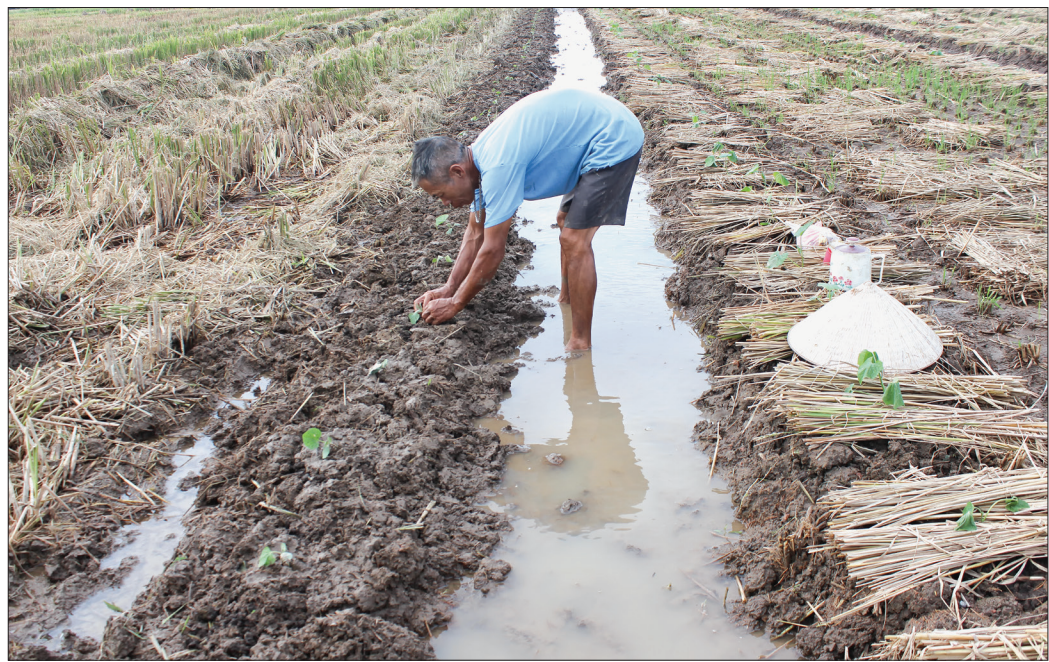
Nông dân xã Thụy Bình (Thái Thụy) tích cực trồng bí xanh - một trong những cây màu chủ lực tại địa phương.