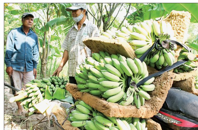
Chuối tây Thái Lan của nông dân xã Vũ Vân được thương lái thu mua tại vườn.