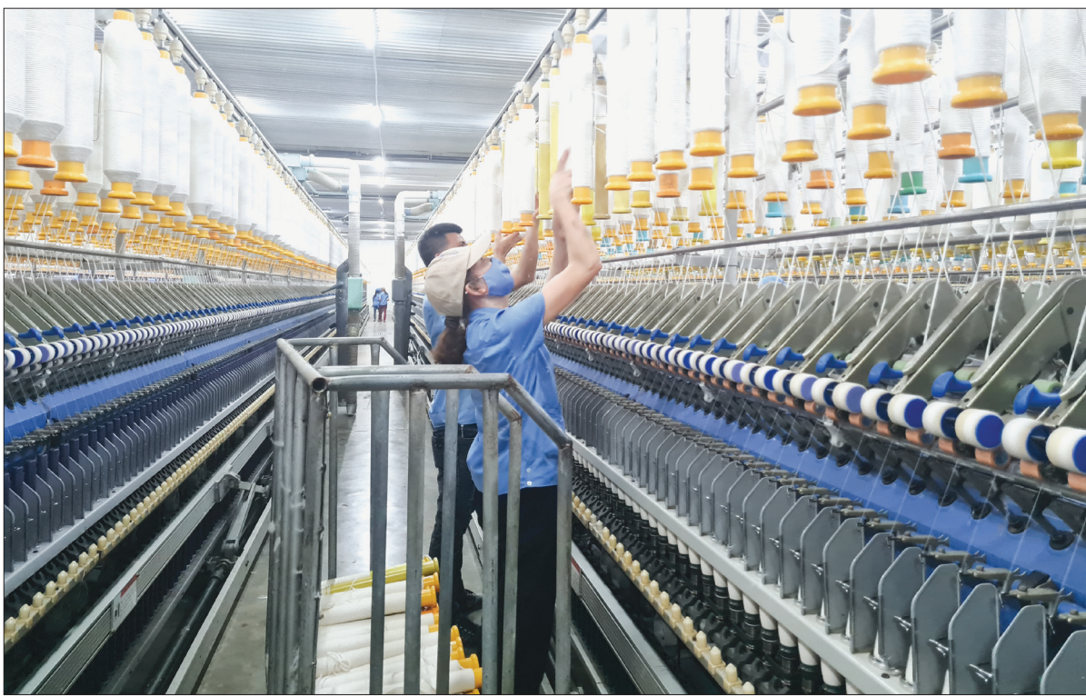
Dây chuyền sản xuất sợi của Công ty Cổ phần Damsan (khu công nghiệp Nguyễn Đức Cảnh, thành phố Thái Bình).

Những năm gần đây, Hội Doanh nghiệp thành phố Thái Bình đã có những bước chuyển mình, lớn mạnh, đóng góp tích cực cho sự phát triển của tỉnh và thành phố.