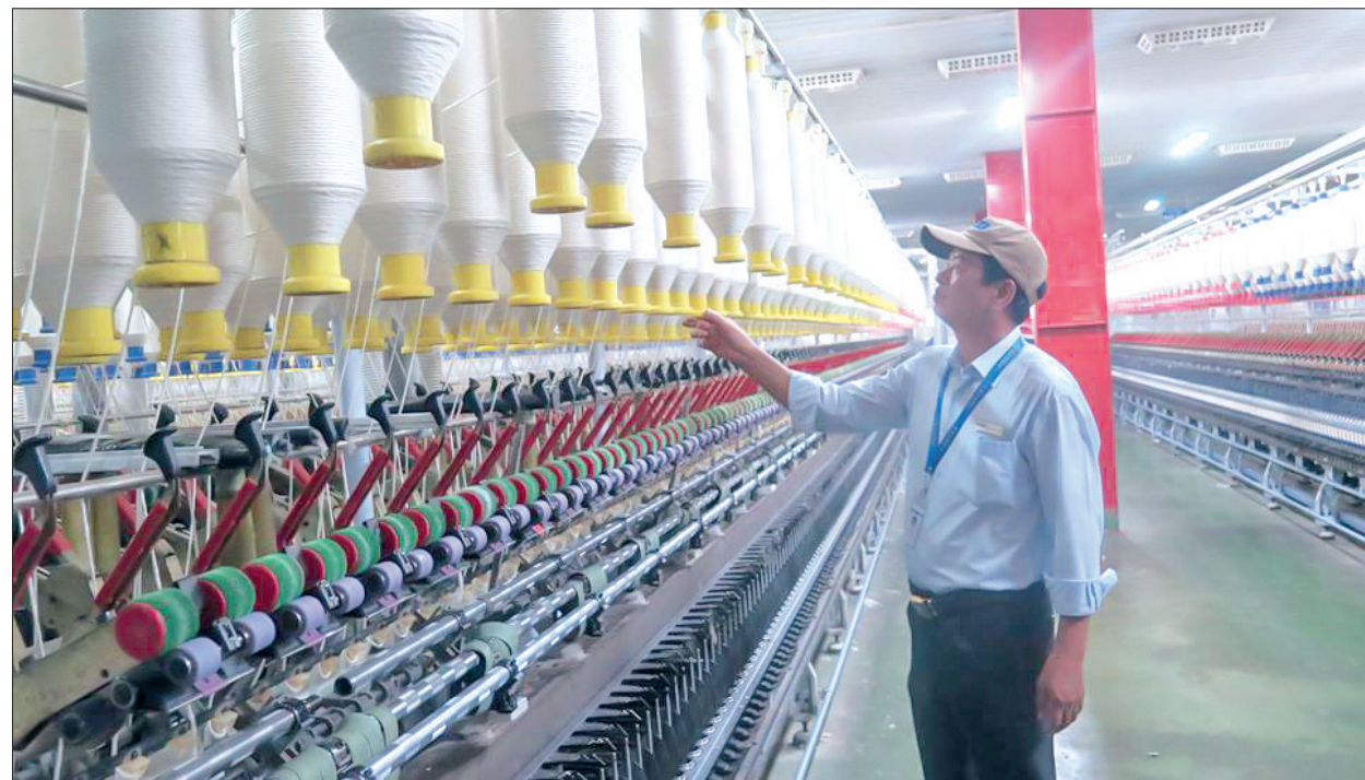
Sản xuất ở Công ty Cổ phần Đầu tư và Phát triển Đức Quân (khu công nghiệp Nguyễn Đức Cảnh, thành phố Thái Bình).

Tổng sản phẩm trên địa bàn GRDP 9 tháng đầu năm tăng 11,35% so với cùng kỳ năm 2017, đạt 71,3% kế hoạch năm 2018. Với đà tăng trưởng đó thì mục tiêu gần 50.000 tỷ đồng tổng giá trị sản phẩm trên địa bàn năm 2018 sẽ không khó để đạt được nếu có sự vào cuộc tích cực của cấp ủy, chính quyền các cấp, các ngành, đơn vị trong tỉnh.