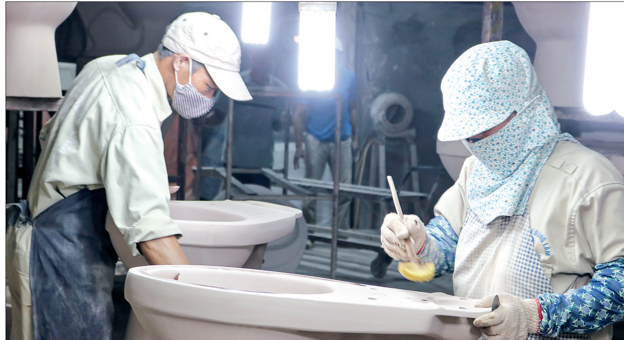
Công nhân Công ty TNHH Sứ Đông Lâm thi đua lao động giỏi, lao động sáng tạo.

(tiếp theo và hết) KỶ 2: "HẠT GIỐNG ĐỎ" CHO TRÁI NGỌT