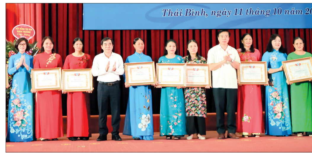
Thái Bình, ngày 11 tháng 10 năm 2021

Thời gian qua, mặc dù gặp nhiều khó khăn, đặc biệt là ảnh hưởng của dịch Covid-19, các cấp hội, cán bộ, hội viên, phụ nữ càng đa dạng các hoạt động hỗ trợ phụ nữ sáng