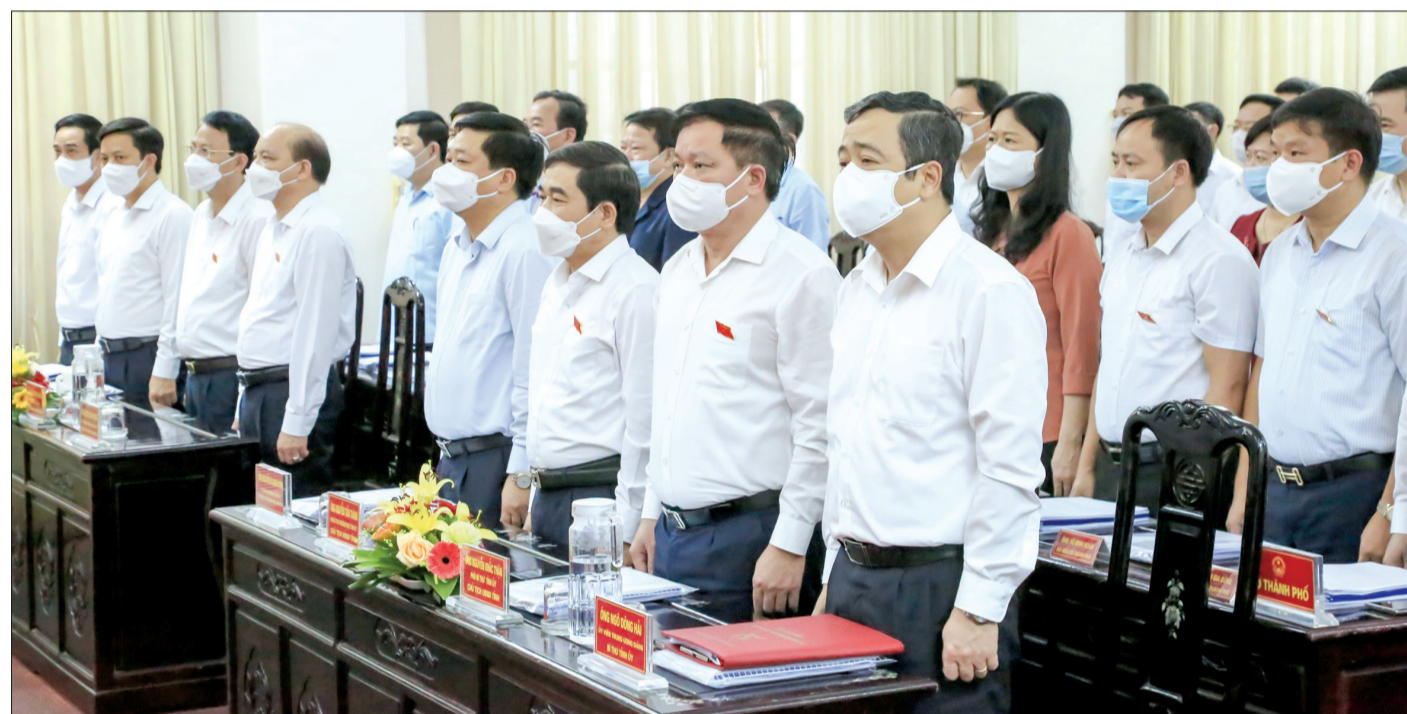
Các đồng chí lãnh đạo tỉnh và đại biểu dự khai mạc kỳ họp.