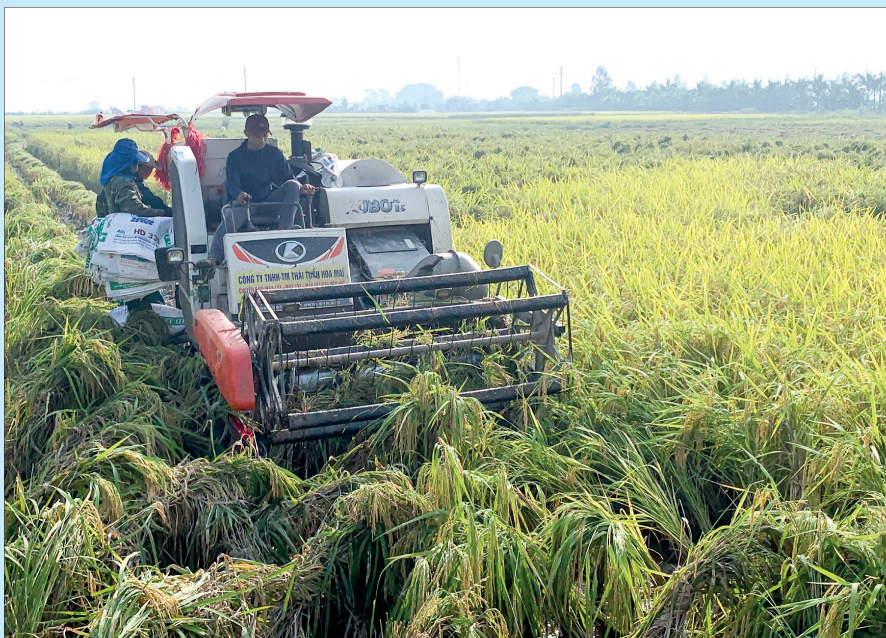
Nông dân xã Thụy Ninh (Thái Thụy) thu hoạch lúa mùa.