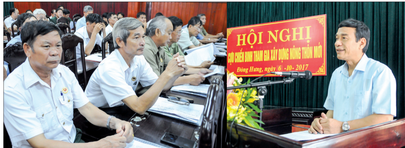
Đồng chí Đặng Trọng Thăng, Phó Bí thư thường trực Tỉnh ủy, Chủ tịch HĐND tỉnh phát biểu tại buổi làm việc.