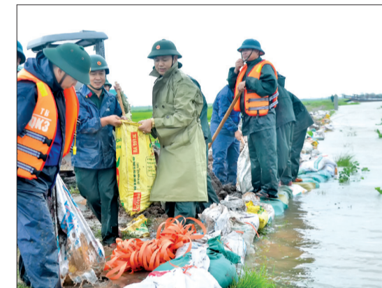
Lực lượng vũ trang huyện Tiên Hải giúp dân khắc phục sự cố nước dâng tràn bờ bao.

Năm 2017, đảng ủy, ban CHQS 8 huyện, thành phố đã tập trung lãnh đạo, chỉ đạo, quán triệt và tổ chức thực hiện nghiêm các nội dung, chỉ tiêu phong trào thi đua quyết thắng do Đảng ủy, Bộ CHQS tỉnh phát động. Phong trào thi đua quyết thắng của LLVT đã gắn kết chặt chẽ với phong trào thi đua yêu nước của địa phương và các phong trào, cuộc vận động của các cấp, các ngành. Phong trào thi đua quyết thắng đã phát huy được sức mạnh tổng hợp, tạo động lực thúc đẩy thực hiện có hiệu quả nhiệm vụ quân sự, quốc phòng địa phương, trong đó có các nhiệm vụ như tuyển quân, huấn luyện, sẵn sàng chiến đấu, bồi dưỡng kiến thức quốc phòng - an ninh cho các đối tượng..., nhiều nhiệm vụ hoàn thành xuất sắc, được Đảng ủy, Bộ CHQS tỉnh đánh giá cao. Tại hội nghị, đại biểu các đơn vị đã tập trung thảo luận, làm rõ những kết quả đã đạt được, đồng thời chỉ ra các mặt hạn chế cần khắc phục trong thời gian tới.