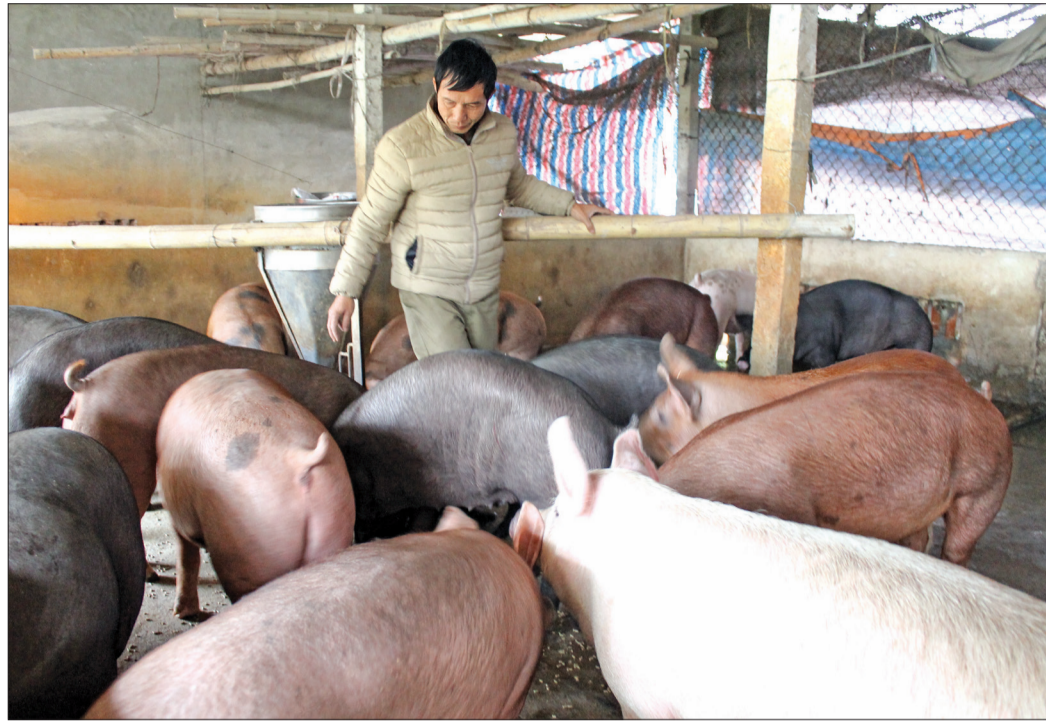
Giá thịt lợn tăng, người chăn nuôi phấn khởi nhưng không tái đàn ô ạt.

Những ngày qua, giá thịt lợn trên thị trường huyện Vũ Thư nói riêng và nhiều địa phương nói chung tăng cao, tác động mạnh đến hoạt động chăn nuôi và tâm lý chủ hộ chăn nuôi. Tuy phần khởi vì giá thịt lợn tăng nhưng người chăn nuôi vẫn thận trọng khi tái đàn lợn do bệnh dịch tả lợn châu Phi chưa chấm dứt và giá lợn trên thị trường có thể giảm nhanh.