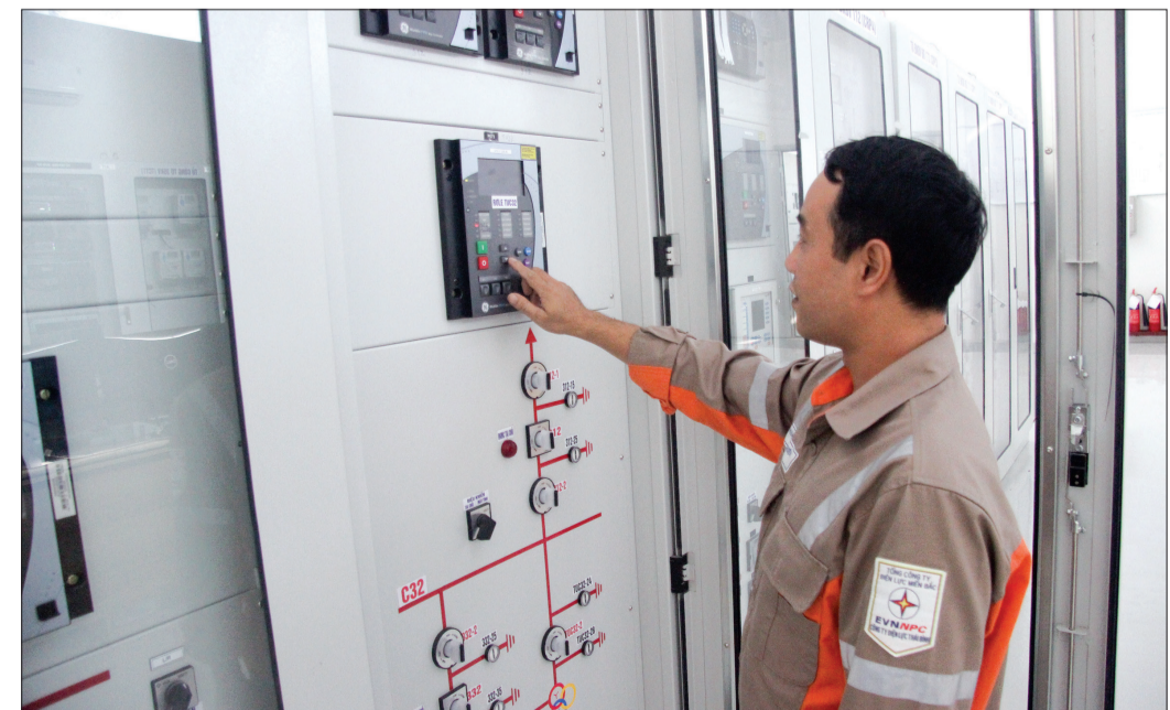
Công ty Điện lực Thái Bình nỗ lực cung cấp điện ổn định, an toàn trên địa bàn toàn tỉnh.