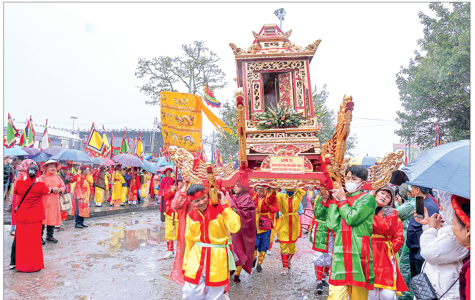
Nghi thức rước nước trong lễ hội đền Trần (xã Tiên Đức, huyện Hưng Hà).

Huyện Hưng Hà thành lập ngày 17/6/1969, trên cơ sở hợp nhất huyện Hưng Nhân và huyện Duyên Hà, tiếp nhận thêm 5 xã của huyện Tiên Hưng (Hòa Bình, Chi Lăng, Tây Đô, Đông Đô, Bắc Sơn). Thời cổ, miền quê này có tên là hương Đa Cương (hương nhiều gò đồng). Từ ngàn xưa, đất thiêng Hưng Hà đời đời sinh ra những anh tài tuấn kiệt mà rạng rỡ hơn cả là vào thế kỷ XIII, họ Trần từ đất này đã sáng nghiệp đế vương, lập nên triều Trần, một triều đại “văn giỏi, võ nhiều”, hiển hách vào bậc nhất trong các triều đại phong kiến của Việt Nam. Sử gia Phan Huy Chú (1782 - 1840) từng ca ngợi nơi này: “Đất tự khí tinh hoa, là cái bình phong che chắn trung đô, những người học giỏi, những bề tôi hiển đứng đầu cả xứ miền dưới”.