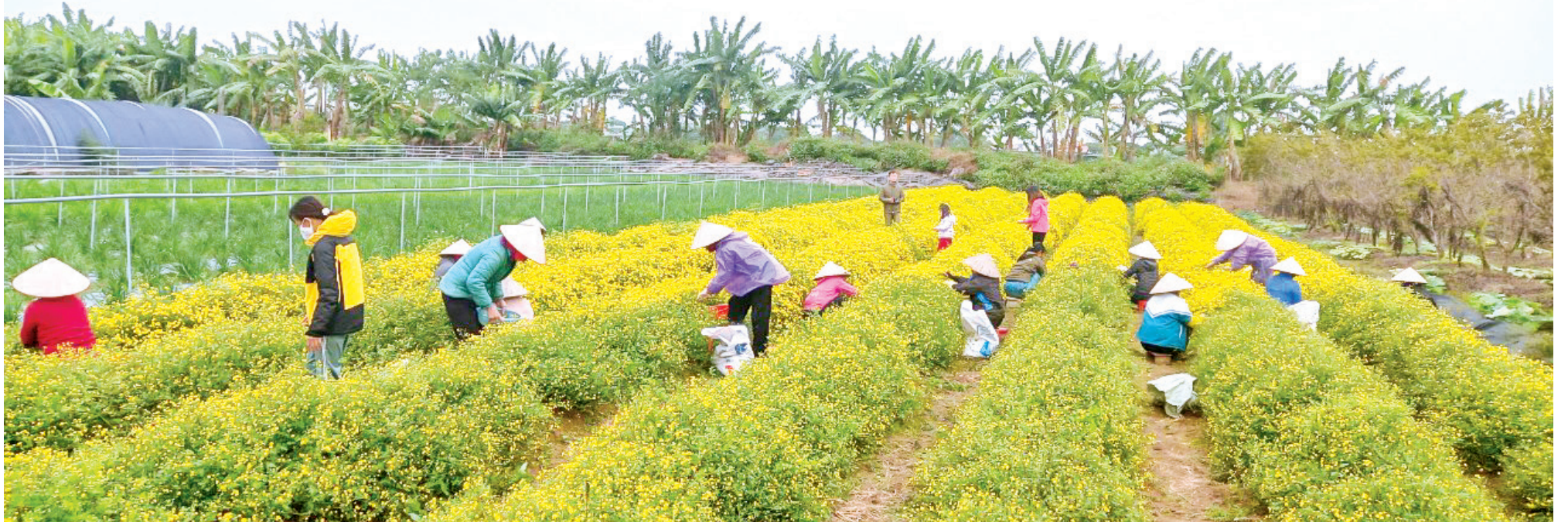
Mô hình trồng hoa cúc chi chế biến trà theo hướng hữu cơ của HTX Nông sản dược liệu Đồng Tâm, xã An Đông cho hiệu quả kinh tế cao.