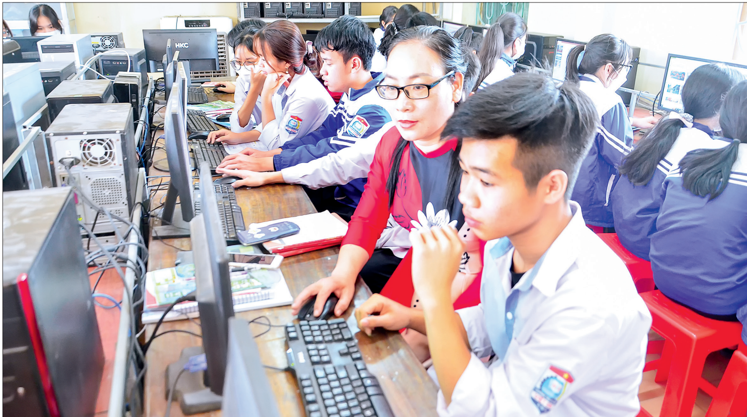
Mỗi thầy cô giáo Trường Tiểu học và THCS Việt Hùng đều nhận đỡ đầu ít nhất một học sinh có hoàn cảnh khó khăn.

Đẩy mạnh học tập và làm theo tư tưởng, đạo đức, phong cách Hồ Chí Minh, thời gian qua, Ban Thường vụ Huyện ủy Vũ Thư đã chỉ đạo các tổ chức cơ sở đảng, các cơ quan, đơn vị nghiêm túc triển khai thực hiện gắn với phong trào thi đua “Người tốt, việc tốt báo công dâng Bác”, từ đó đã xuất hiện nhiều tấm gương tiêu biểu với những việc làm cụ thể, thiết thực, có ý nghĩa xã hội sâu sắc, tạo sự lan tỏa mạnh mẽ trong cộng đồng.