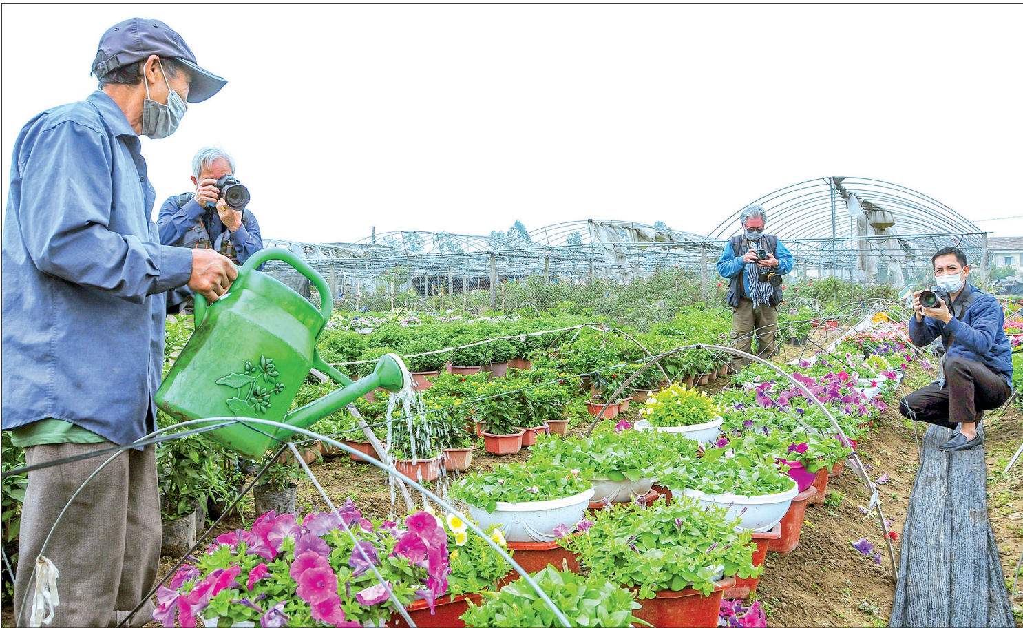
Nghệ sĩ Chi hội Nhiếp ảnh thực tế sáng tác tại làng hoa Vũ Chính, thành phố Thái Bình.

Sáng tinh mơ, trời mưa tầm tã, nhưng trên chuyến xe khởi hành từ Hội Văn học Nghệ thuật Thái Bình đi trại sáng tác tại tỉnh Ninh Bình của các văn nghệ sĩ không ngớt niềm vui, tiếng cười. Chia sẻ với nhau ca khúc vừa hoàn thành hòa âm phối khí, ý thơ vừa chợt thoáng qua nhưng cũng đã đủ để những mái đầu tóc điểm hoa râm như được trẻ lại với độ tuổi đầy nhiệt huyết, đam mê.