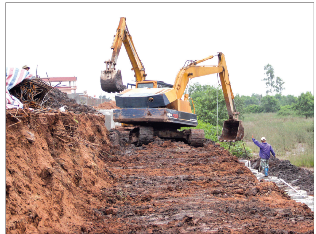
Hệ thống đê cửa sông Diêm Hộ (Thái Thụy) được đầu tư, nâng cấp đáp ứng tốt nhu cầu sản xuất nông nghiệp.

đại hóa HTTL giai đoạn 2014 - 2020 và những năm tiếp theo với mục tiêu nâng cao hiệu quả phục vụ của HTTL trước yêu cầu phát triển của nông nghiệp, các ngành kinh tế và bảo vệ môi trường; chủ động ứng phó với biến đổi khí hậu; ứng dụng các tiến bộ khoa học công nghệ hiện hướng hiện đại hóa nhằm nâng cao hiệu quả quản lý, khai thác các công trình thủy lợi. Theo đó, tổng kinh phí dự kiến thực hiện để án 14.455 tỷ đồng để làm mới, nâng cấp, cải tạo các công trình. Tuy nhiên, do khó khăn về nguồn vốn, tiến độ thực hiện không đạt so với kế hoạch đề ra, mới tập trung