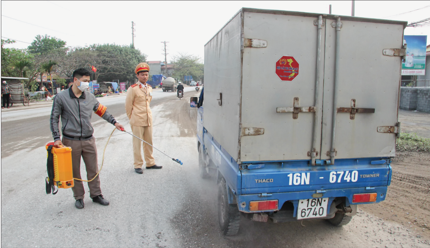
Chốt kiểm dịch thú y Tiến Hải giám sát chặt chẽ phương tiện ra vào huyện.

Tính đến ngày 11/3, trên địa bàn huyện Tiến Hải chưa xuất hiện bệnh dịch tả lợn châu Phi. Tuy nhiên, để chủ động phòng, chống bệnh dịch, địa phương đã tích cực tuyên truyền, lập chốt kiểm dịch thú y tại các xã giáp ranh với các huyện có dịch để bảo vệ đàn lợn.