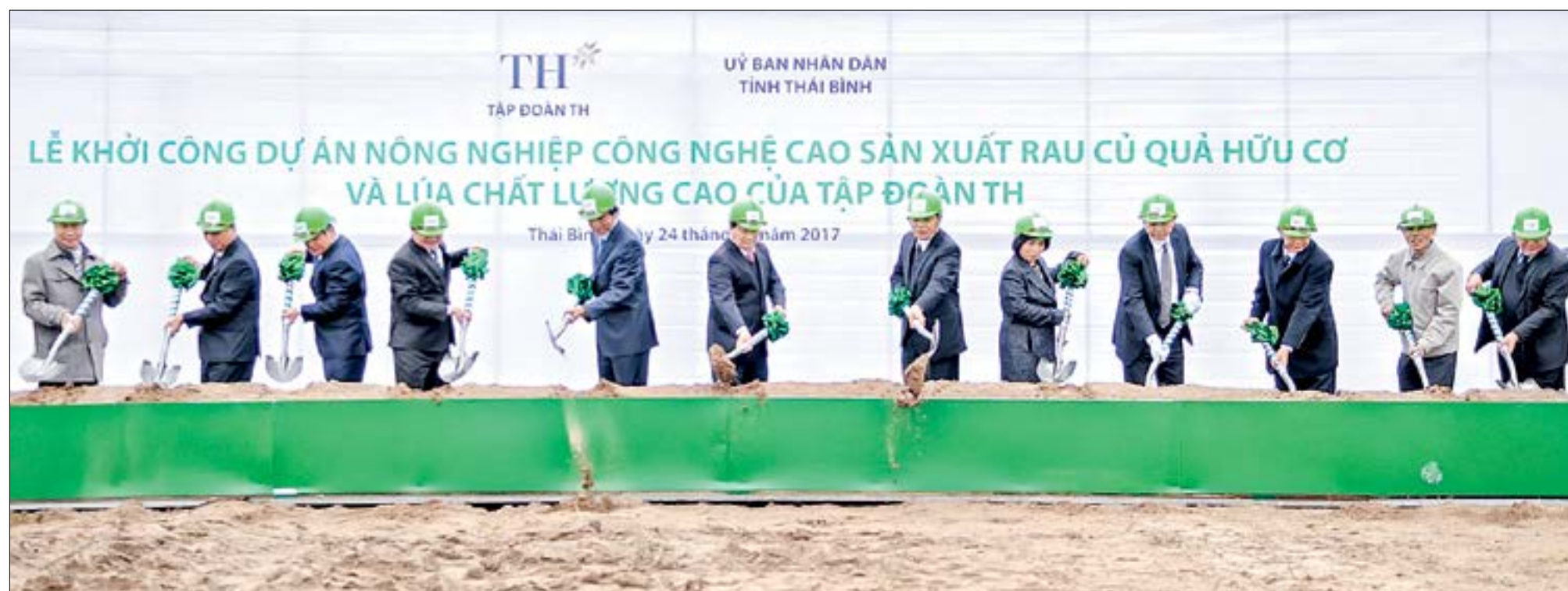
Phó Thủ tướng Chính phủ Trịnh Đình Dũng cùng các đồng chí lãnh đạo tỉnh khởi công dự án nông nghiệp công nghệ cao sản xuất rau, củ, quả hữu cơ và lúa chất lượng cao của Tập đoàn TH.