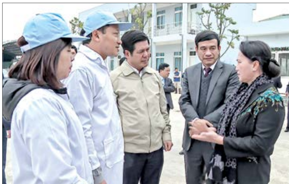
Chủ tịch Quốc hội Nguyễn Thị Kim Ngân cùng các đồng chí lãnh đạo tỉnh thăm Công ty TNHH Một thành viên Chăn nuôi Việt Hùng thuộc Tập đoàn Hòa Phát (xã Hồng Minh, huyện Hưng Hà).