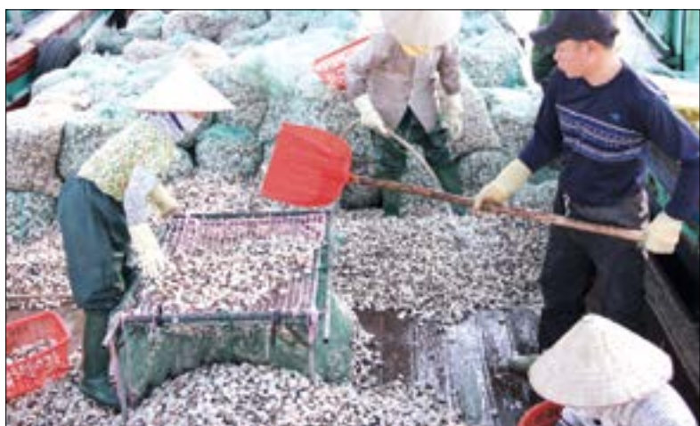
Thêm một vụ ngao được mùa.