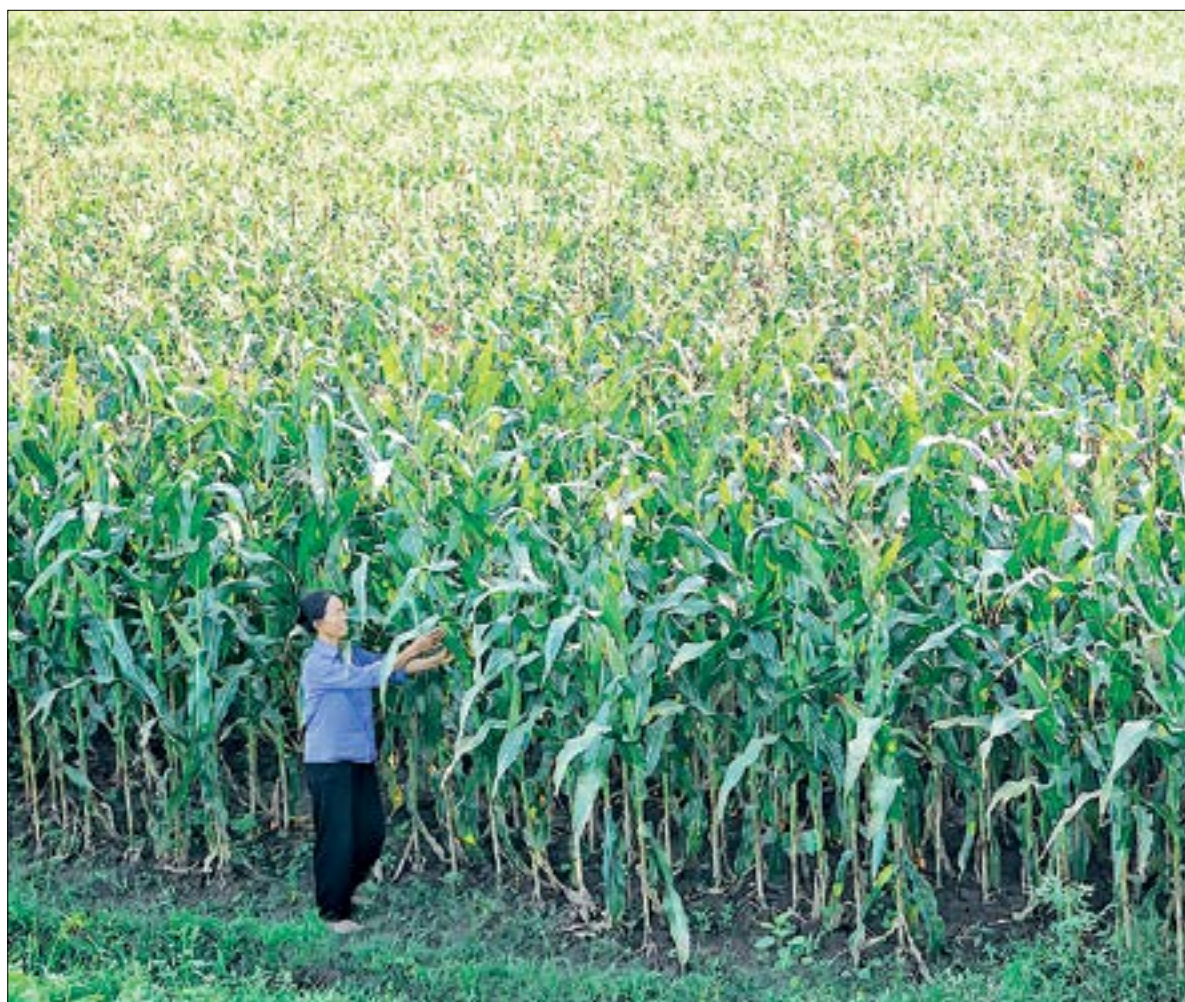
Cánh đồng ngô vụ đông ở Nguyên Xá (Vũ Thư).