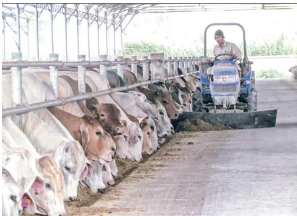
Trang trại nuôi bò thịt công nghệ cao của Công ty TNHH Một thành viên Chăn nuôi Việt Hùng thuộc Tập đoàn Hòa Phát (xã Hồng Minh, huyện Hưng Hà).