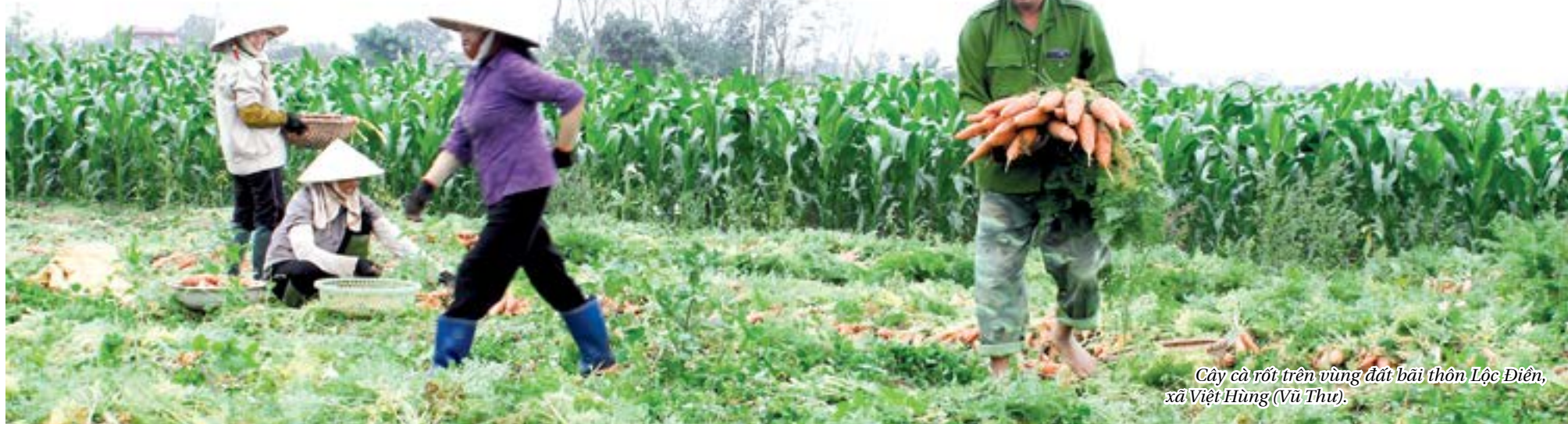
Cây cà rốt trên vùng đất bãi thôn Lộc Điền, xã Việt Hùng (Vũ Thư).