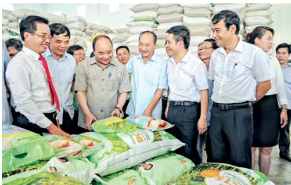
Thủ tướng Chính phủ Nguyễn Xuân Phúc cùng các đồng chí lãnh đạo tỉnh thăm nhà máy chế biến hạt giống chất lượng cao của Công ty Cổ phần Tổng công ty Giống cây trồng Thái Bình.

Là tỉnh có 3 mặt giáp sông, 1 mặt giáp biển, thuộc vùng ảnh hưởng trực tiếp của tam giác tăng trưởng kinh tế Hà Nội - Hải Phòng - Quảng Ninh, Thái Bình có điều kiện tự nhiên, sinh thái thuận lợi cho phát triển sản xuất nông nghiệp theo hướng thâm canh và công nghệ cao. Với 105.755ha đất nông nghiệp màu mỡ, hơn 1 triệu lao động cần cù, chịu khó, sáng tạo cùng tiềm năng về du lịch sinh thái, trải nghiệm đồng quê và du lịch văn hóa tâm linh, đặc biệt là các cơ chế, chính sách ưu việt, sự vào cuộc tích cực của cả hệ thống chính trị trong thu hút đầu tư đã, đang và sẽ đưa Thái Bình trở thành điểm đến hấp dẫn, địa chỉ “đỏ” của nhà đầu tư trong lĩnh vực nông nghiệp. Báo Thái Bình trân trọng giới thiệu loạt bài phản ánh xung quanh vấn đề trên.