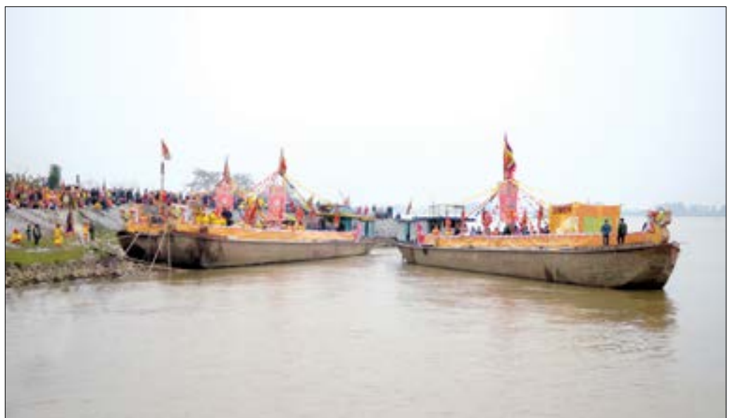
Lễ rước nước trên sông Hồng tại lễ hội đền Trần Thái Bình.