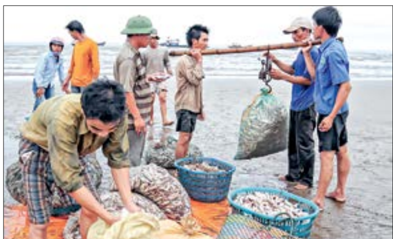
Sau chuyến vươn khơi của ngư dân Nam Phú (Tiền Hải).