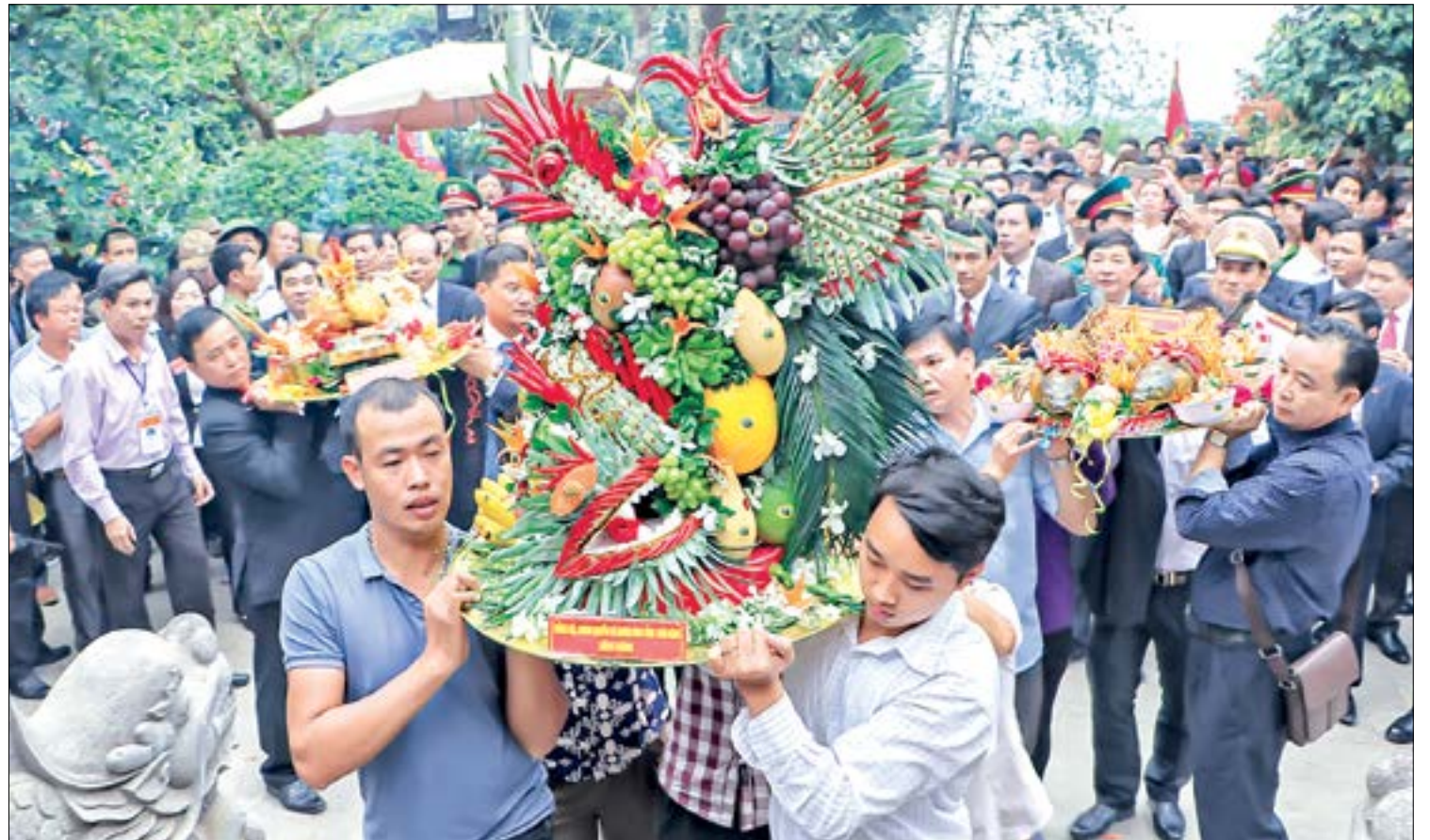
Hương, hoa, sản vật của Đoàn đại biểu tỉnh Thái Bình tiến dâng tri ân công đức các vua Hùng.

Sáng nay, ngày 6/4 (10/3 âm lịch), Đoàn đại biểu tỉnh Thái Bình sẽ tham gia lễ dâng hương tưởng niệm các vua Hùng cùng với đoàn đại biểu trung ương và 4 tỉnh, thành phố: Phú Thọ, Hà Nội, Bình Phước, Bến Tre.