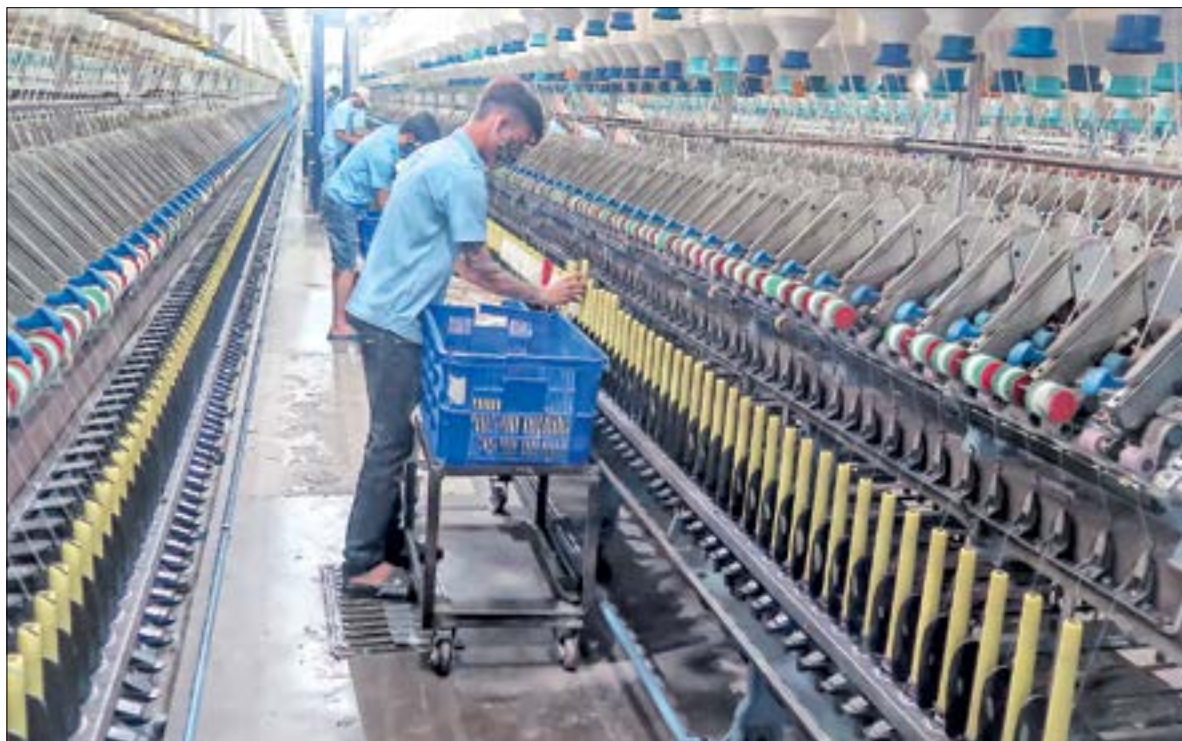
Sản xuất tại Công ty Cổ phần Damsan.

Tập trung cải cách hành chính (CCHC), nâng cao năng lực cạnh tranh, cải thiện môi trường đầu tư, kinh doanh là một trong ba đột phá chiến lược tăng trưởng kinh tế được xác định tại Đại hội Đảng bộ tỉnh lần thứ XIX. Với tiềm năng, thế mạnh của địa phương cùng với chính sách "mở" ưu đãi, Thái Bình đang tạo điều kiện thuận lợi nhất cho các nhà đầu tư.