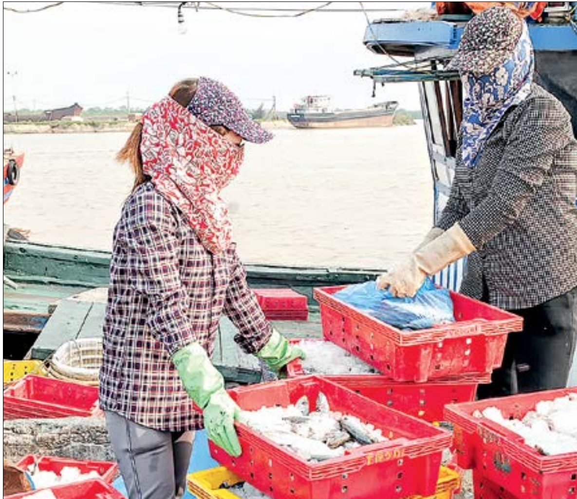
Khai thác hải sản của ngư dân Diêm Điền (Thái Thụy).

Thái Bình có nhiều lợi thế để khoanh vùng ương dưỡng các giống thủy sản do được bao bọc bởi hệ thống sông, biển khép kín. Để thúc đẩy phát triển sản xuất giống thủy sản có chất lượng, tỉnh đã ban hành nhiều chính sách, trong đó có Quyết định số 648/QĐ-UBND ngày 22/4/2011 của UBND tỉnh phê duyệt quy hoạch phát triển giống thủy sản tỉnh Thái Bình giai đoạn 2011 - 2015, định hướng đến năm 2020. Theo đó, khuyến khích các địa phương có lợi thế hình thành các vùng ương nuôi có quy mô lớn, phục vụ nuôi trồng thủy sản xuất khẩu. Xây dựng cơ chế, chính sách thu hút đầu tư từ các doanh nghiệp, phát triển các mô hình liên doanh, liên kết giữa doanh nghiệp để sản xuất giống thủy sản. Không ngừng chuyển dịch cơ cấu, phát triển mạnh nguồn giống, các đối tượng đặc sản tạo sản phẩm chủ lực theo nhu cầu của thị trường, phù hợp với điều kiện của từng vùng. Đưa nhanh tiến bộ khoa học kỹ thuật, các biện pháp quản lý tiên tiến vào các vùng nuôi trồng thủy sản tập trung để tăng năng suất, sản lượng. Tăng cường các biện pháp quản lý nhà nước về chất lượng thủy sản, quản lý chất lượng theo chuỗi sản phẩm gắn với truy xuất nguồn gốc, đặc biệt về chất lượng giống... Hỗ trợ đầu tư xây dựng cơ sở sản xuất giống ngao sinh sản. Các doanh nghiệp đầu tư vào các vùng ương nuôi trồng thủy sản được thuê đất với mức giá thấp nhất của loại đất tương ứng trong bảng giá đất, miễn tiền thuê đất. Hỗ trợ các hộ nuôi áp dụng công nghệ cao. Xây dựng, nâng cấp cơ sở vật chất Trung