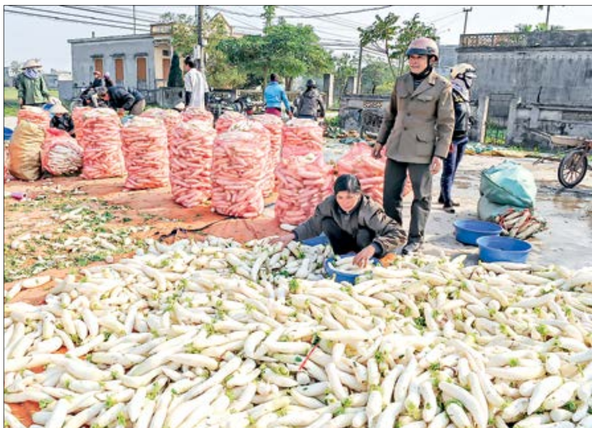
Thu mua nông sản ở Vũ Lễ (Kiến Xương).