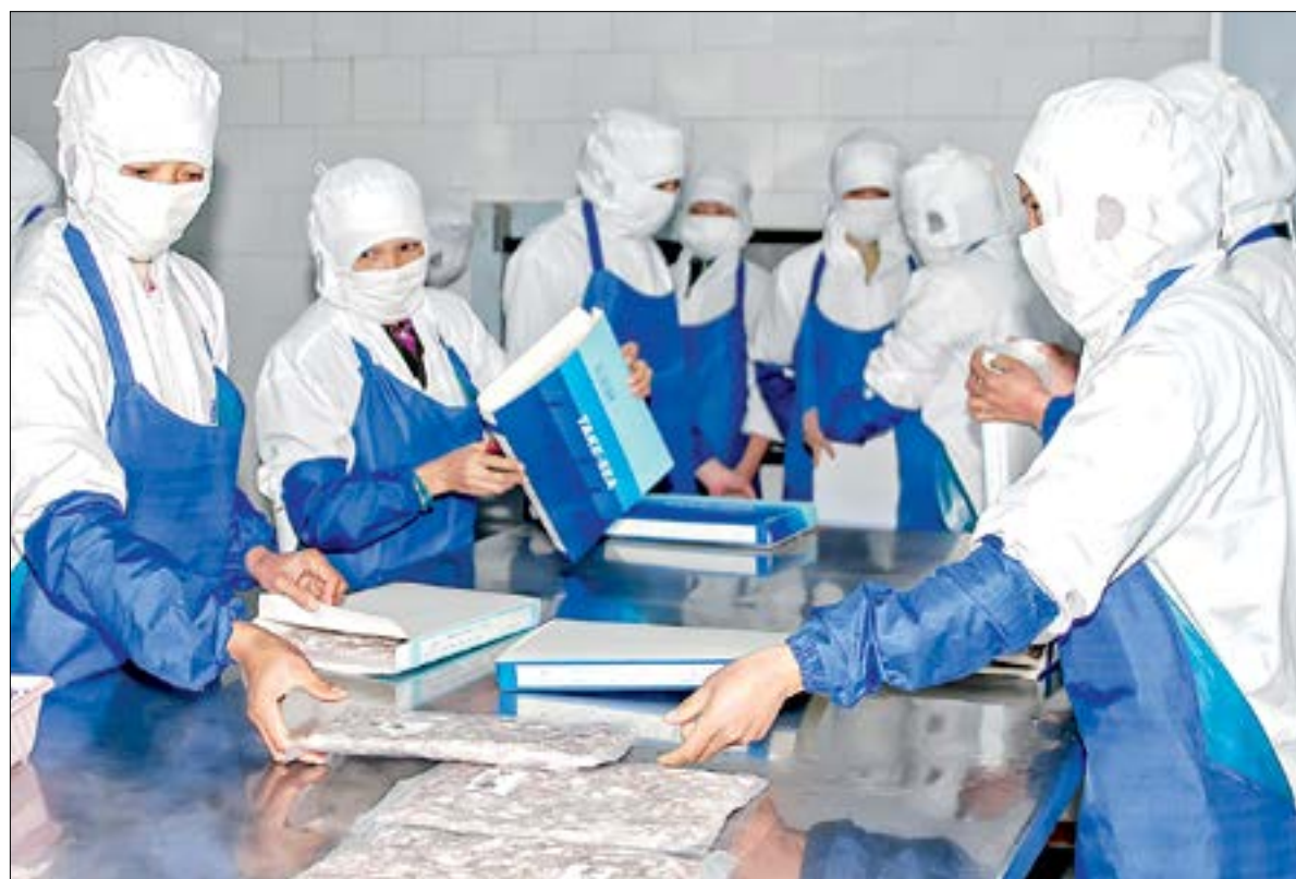
Chế biến hải sản xuất khẩu ở Công ty TNHH Thực phẩm RICHBEAUTY Việt Nam (cụm công nghiệp Thái Thụy).

Phát triển công nghiệp chế biến nông, lâm, thủy sản là một trong những nội dung quan trọng của chuyển dịch cơ cấu kinh tế nông nghiệp, nông thôn theo hướng công nghiệp hóa, hiện đại hóa. Mặc dù những năm qua Thái Bình coi đây là nhiệm vụ trọng tâm trong phát triển công nghiệp nói chung, bước đầu đã hình thành nhiều cơ sở sản xuất đem lại hiệu quả cao nhưng vẫn chưa tương xứng với tiềm năng của tỉnh.