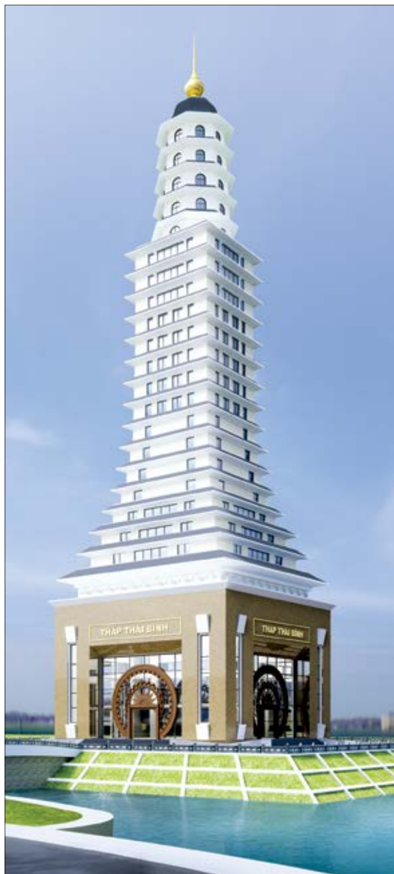
Phối cảnh công trình Tháp Thái Bình.

Tháp Thái Bình gần 300 tỷ đồng, được huy động từ nguồn xã hội hóa, qua đó khơi dậy tình yêu quê hương, hướng về quê hương của nhân dân. Việc huy động các tổ chức, doanh nghiệp, cá nhân tham gia đóng góp xây dựng Tháp Thái Bình theo tinh thần tự nguyện, không ép buộc... Đối tượng huy động là các cơ quan, tổ chức, doanh nghiệp và đoàn thể xã hội trong và ngoài tỉnh; các doanh nhân và bà con quê hương Thái Bình đang học tập, lao động, công tác ở tỉnh ngoài hoặc nước ngoài; cán bộ, công chức, viên chức, người lao động và các tầng lớp nhân dân trong và ngoài tỉnh... Mặc dù mới được phát động trong thời gian ngắn nhưng đến nay Ban Vận động xây dựng công trình Tháp Thái Bình đã tiếp nhận tiền và hiện vật từ các nhà hảo tâm trong và ngoài tỉnh.