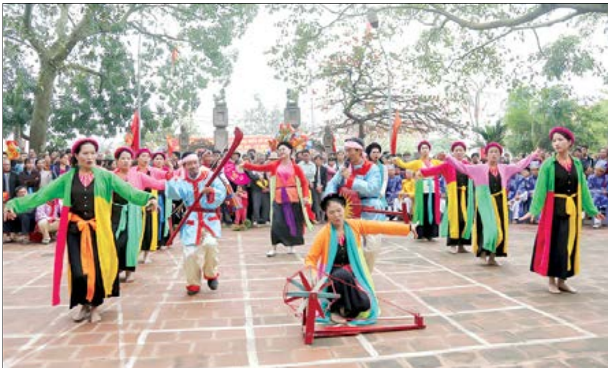
Trình diễn tu dân chi nghiệp trong lễ hội Trò Trám (xã Tú Xá, huyện Lâm Thao, tỉnh Phú Thọ).

Bằng quyết tâm của các đồng chí lãnh đạo tỉnh, trách nhiệm và tâm huyết của các nhà khoa học, sự vào cuộc của các cấp, các ngành và sự đồng thuận, hưởng ứng của nhân dân, chúng ta đã xây dựng được bộ hồ sơ khoa học chặt chẽ, sâu sắc, có sức thuyết phục cao đối với các chuyên gia thẩm định quốc tế. Trong chúng tôi lúc đó có cả sự lo âu về "cuộc thi"... nếu chẳng may chưa tới đích thì sẽ ra sao, báo cáo thế nào với tổ tiên... Thế rồi, kể từ