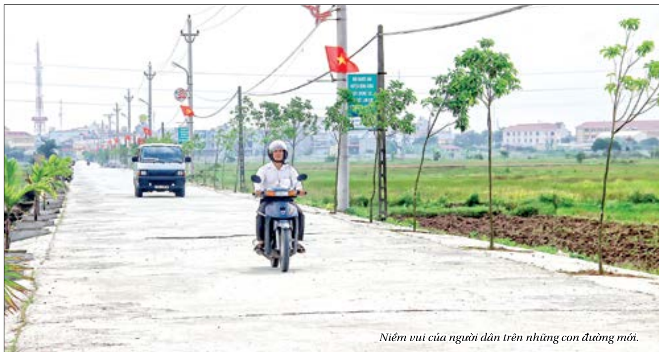
Niềm vui của người dân trên những con đường mới.