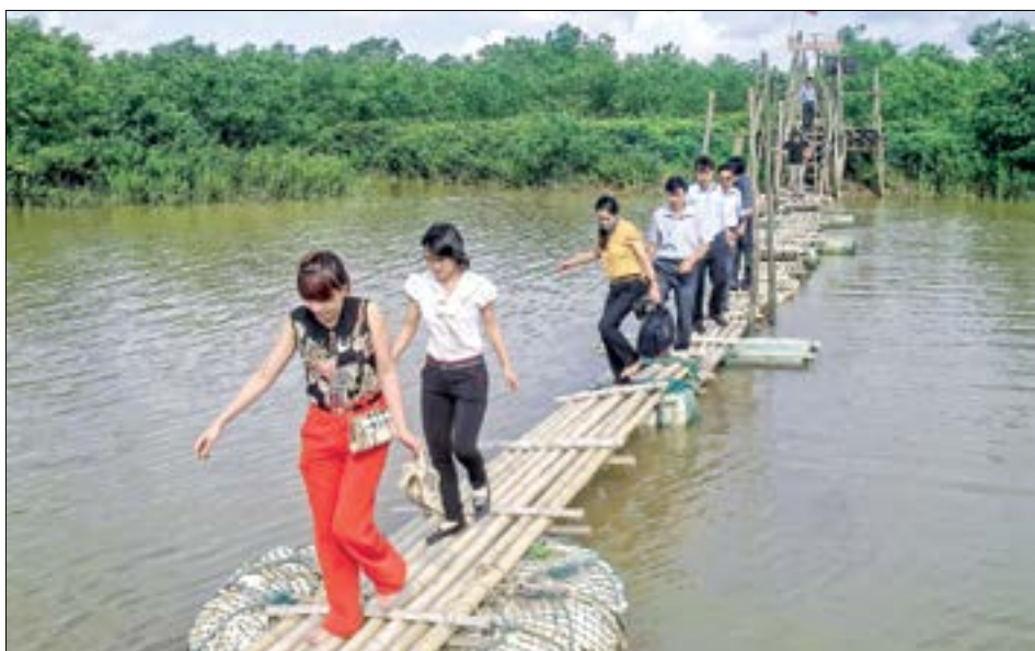
Khu du lịch sinh thái cồn Đen (xã Thái Đô, huyện Thái Thụy).