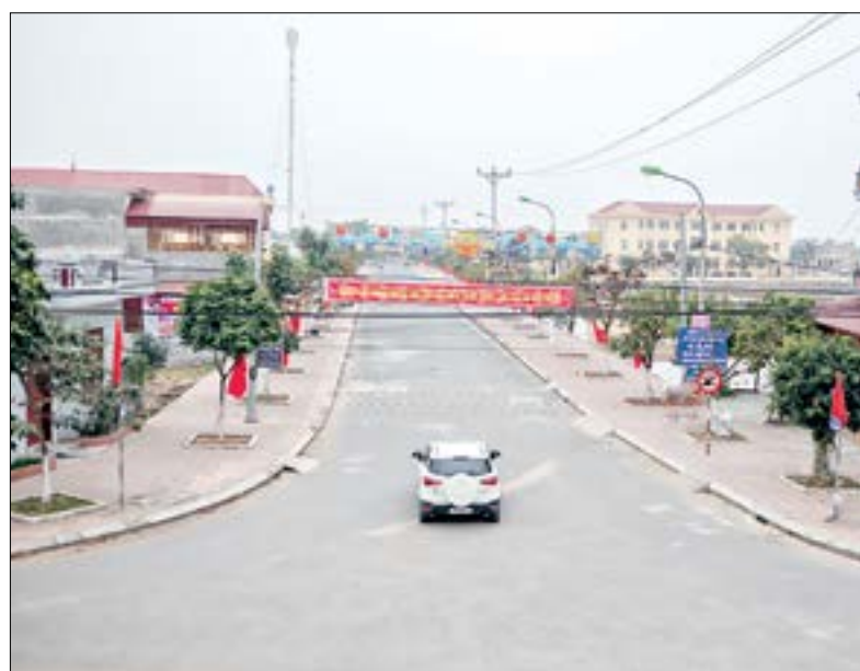
Xã nông thôn mới Hồng Minh (Hưng Hà).