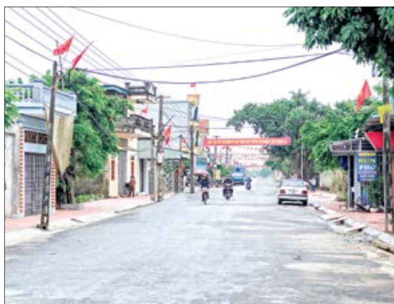
Đường giao thông xã Thanh Tân (Kiến Xương).