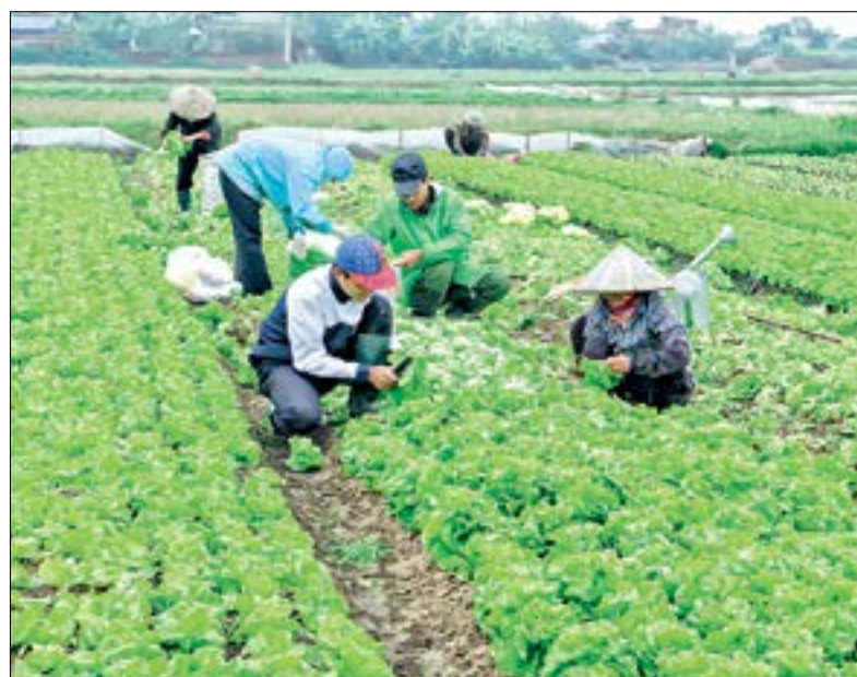
Thu hoạch cây màu vụ đông.