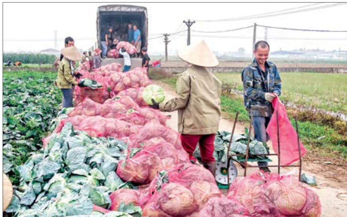
Thu mua rau cải bắp tại xã Diệp Nông (Hưng Hà).

Với những nỗ lực trong việc tập trung đầu tư phát triển nông nghiệp, nông thôn, đặc biệt là về hạ tầng cơ sở, Thái Bình đang có nhiều lợi thế thu hút đầu tư vào nông nghiệp, nông thôn, nhất là trong lĩnh vực trồng trọt.