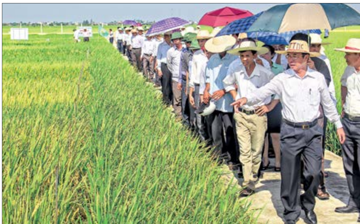
Công ty Cổ phần Tổng công ty Giống cây trồng Thái Bình nghiên cứu, chọn lọc các giống lúa cho ra sản phẩm gạo chất lượng cao.