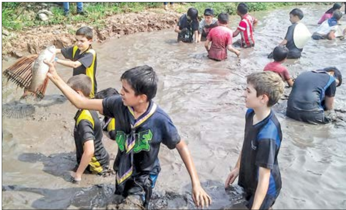
Một tour du lịch trải nghiệm được tổ chức bởi Công ty TNHH Du lịch Trang Long.

Đối với nhiều tỉnh, thành phố, du lịch đã trở thành ngành kinh tế mũi nhọn, đóng góp tích cực vào phát triển kinh tế - xã hội. Thái Bình cũng đang phấn đấu để du lịch trở thành một trong những ngành kinh tế quan trọng. Để du lịch phát triển, rất cần những cái “bắt tay” giữa nhà nước với doanh nghiệp, giữa doanh nghiệp với người dân. Bên cạnh đó là sự chung sức của tất cả các sở, ban, ngành, địa phương, các cơ quan truyền thông để tạo đà cho du lịch Thái Bình cất cánh.