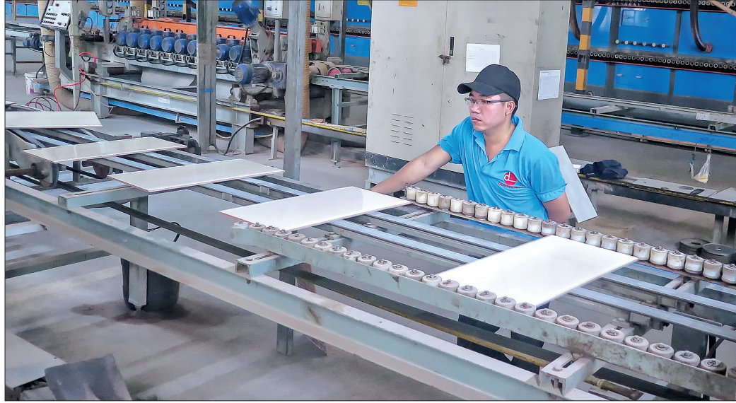
Nhờ có những giải pháp quyết liệt của Đảng ủy, 6 tháng đầu năm, Cục Thuế tỉnh đã thực hiện tốt nhiệm vụ thu ngân sách trên địa bàn.

Những năm qua, Đảng ủy Khối các cơ quan tỉnh luôn chú trọng chỉ đạo đổi mới, nâng cao chất lượng sinh hoạt các đảng bộ, chi bộ trực thuộc, góp phần nâng cao năng lực lãnh đạo, sức chiến đấu của tổ chức đảng, thực hiện thắng lợi nhiệm vụ chính trị được giao.