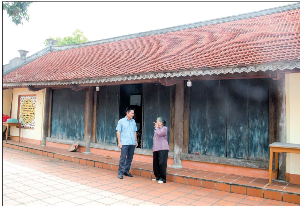
Chùa Đông An, xã Đông Quan (Đông Hưng) - nơi tập trung đầu tiên của đoàn biểu tình tiến về phủ Thái Ninh giành chính quyền.

Nhiều địa phương trên địa bàn huyện Đông Hưng là cái nôi của phong trào cách mạng, ghi vào lịch sử Đảng bộ tỉnh Thái Bình như những mốc son trong hành trình 77 năm từ khi đất nước, quê hương giành được độc lập. Dưới sự lãnh đạo của Đảng, những vùng quê ấy nay đã "thay da, đổi thịt", khoác lên mình tấm áo của sự phát triển.