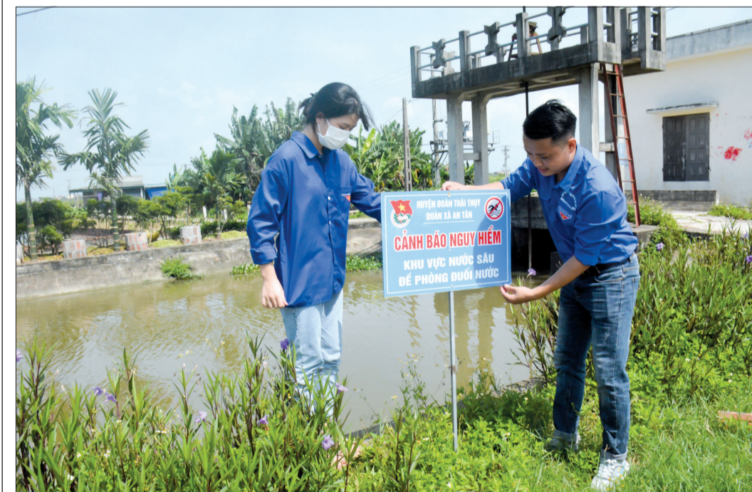
Lắp đặt biển cảnh báo để phòng đuối nước tại xã An Tân (Thái Thụy).