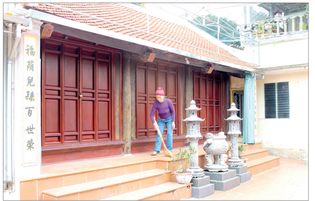
Từ đường dòng họ Đỗ, xã Song Lăng - nơi thờ Trạng nguyên Đỗ Lý Khiêm và Tiến sĩ Đỗ Lý Oánh.