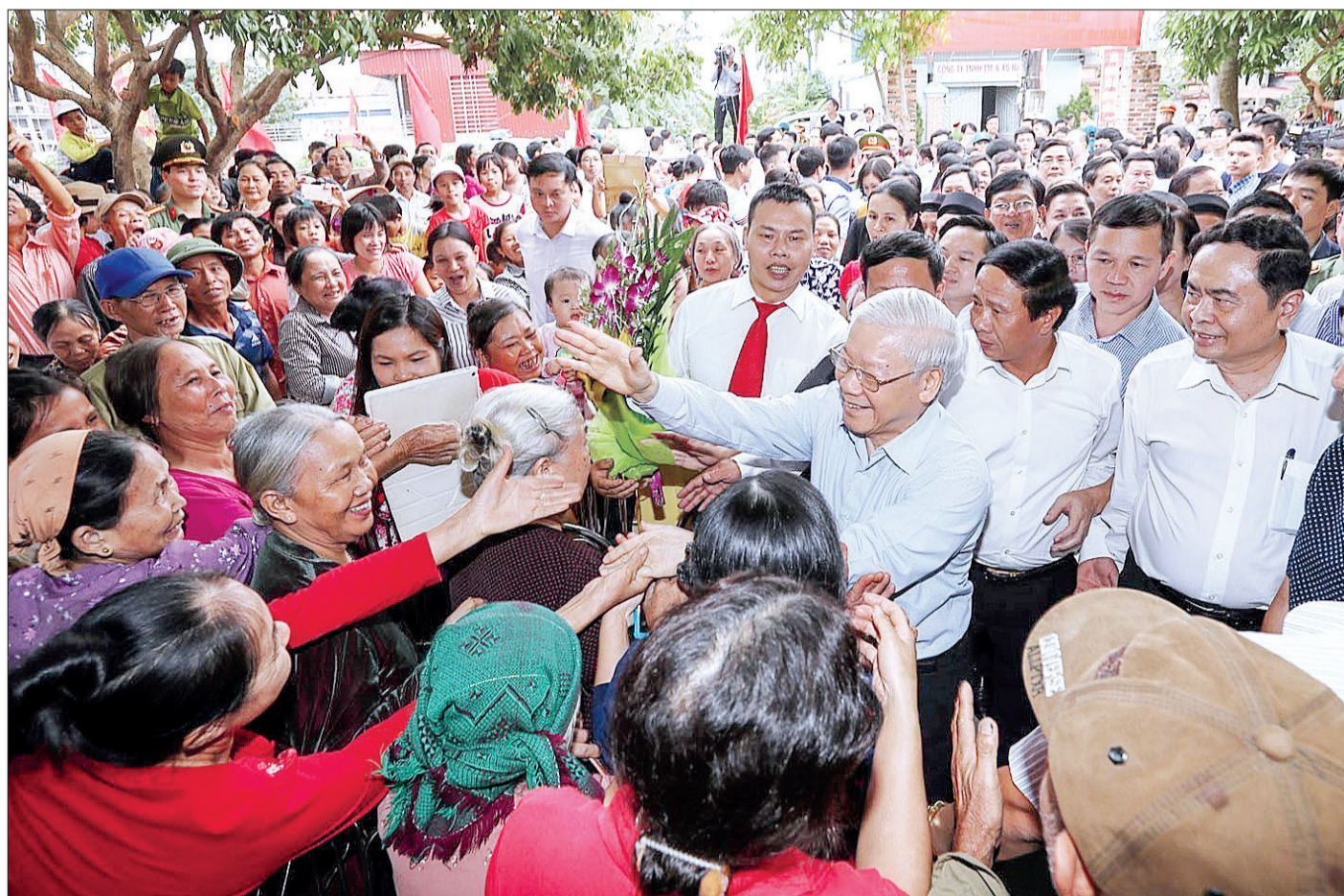
Tổng Bí thư Nguyễn Phú Trọng với nhân dân thôn Thượng Điện, xã Vinh Quang, huyện Vinh Bảo trong ngày hội đại đoàn kết toàn dân tộc thành phố Hải Phòng, ngày 15/11/2017.

Đặc biệt, trong 3 nhiệm kỳ qua, Tổng Bí thư Nguyễn Phú Trọng đã có những cống hiến to lớn đối với công cuộc phát triển đất nước, nhất là trong thời kỳ đầy mạnh công nghiệp hóa, hiện đại hóa, hội nhập quốc tế, thực hiện chiến lược bảo vệ Tổ quốc trong tình hình mới.