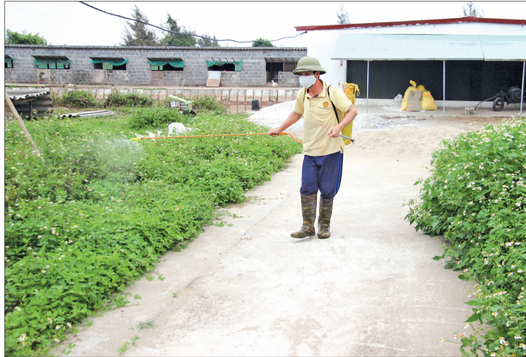
Các hộ chăn nuôi lợn ở xã Nam Hồng tăng cường tiêu độc, khử trùng tại khu vực chăn nuôi.

Để bảo vệ đàn lợn trước nguy cơ của bệnh dịch tả lợn châu Phi, xã Nam Hồng (Tiền Hải) đã chủ động tổ chức thực hiện đồng bộ các giải pháp phòng và ngăn chặn nguy cơ xâm nhiễm bệnh dịch tả lợn châu Phi vào địa bàn. Tại vùng chuyển đổi chăn nuôi tập trung thôn