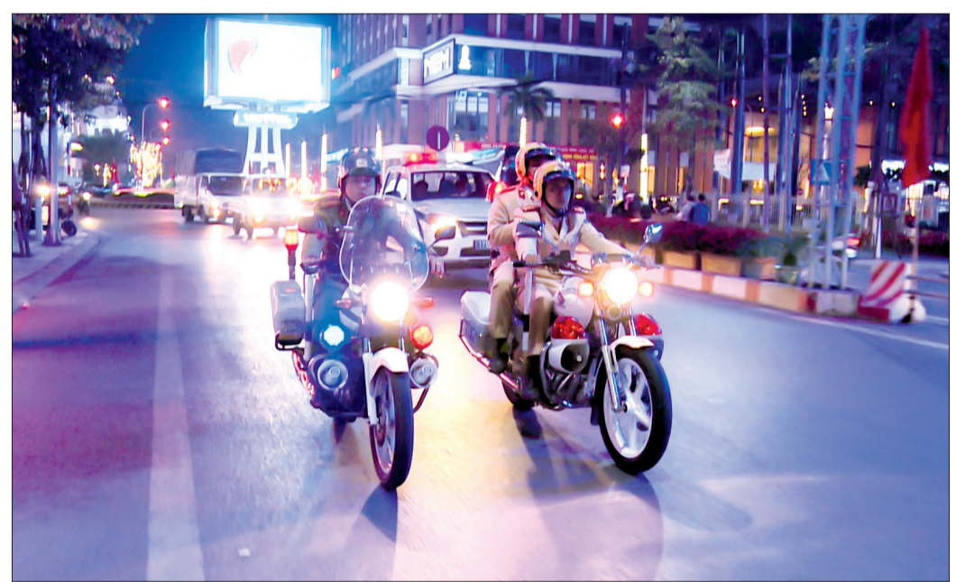
Công an tỉnh mở đợt cao điểm tấn công trấn áp tội phạm, bảo vệ đại hội đảng bộ các cấp.

Kịp thời phát hiện, đấu tranh ngăn chặn, làm thất bại âm mưu, hoạt động chống phá của các thế lực thù địch, các đối tượng phản động lưu vong, số chống đối trong nước. Tăng cường phối hợp giải quyết kịp thời các vấn đề phức tạp nảy sinh và những nguy cơ gây mất an ninh trên các lĩnh vực, địa bàn trọng điểm. Triển khai đồng bộ các giải pháp bảo đảm an ninh chính trị nội bộ, an ninh văn hóa tư tưởng, an ninh thông tin - truyền thông, an ninh xã hội. Tham mưu, phối hợp chặt chẽ với các cấp ủy đảng trong việc ngăn chặn, đẩy lùi các biểu hiện "tự diễn