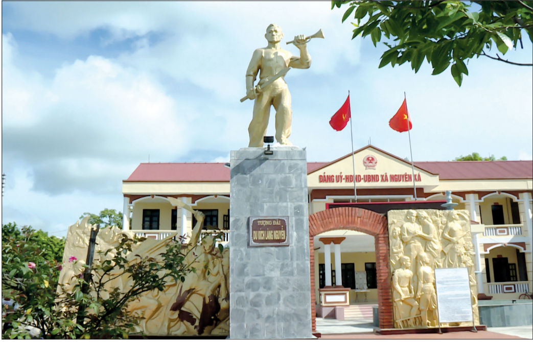
Tượng đài du kích làng Nguyễn, xã Nguyễn Xá (Đông Hưng).

Đúng ngày này 75 năm trước (19/8/1945 - 19/8/2020), hòa chung với khí thế cách mạng sôi nổi trong cả nước, dưới sự lãnh đạo của Đảng bộ tỉnh, quân và dân Thái Bình chủ động nắm bắt thời cơ, vùng lên đấu tranh giành chính quyền về tay nhân dân.