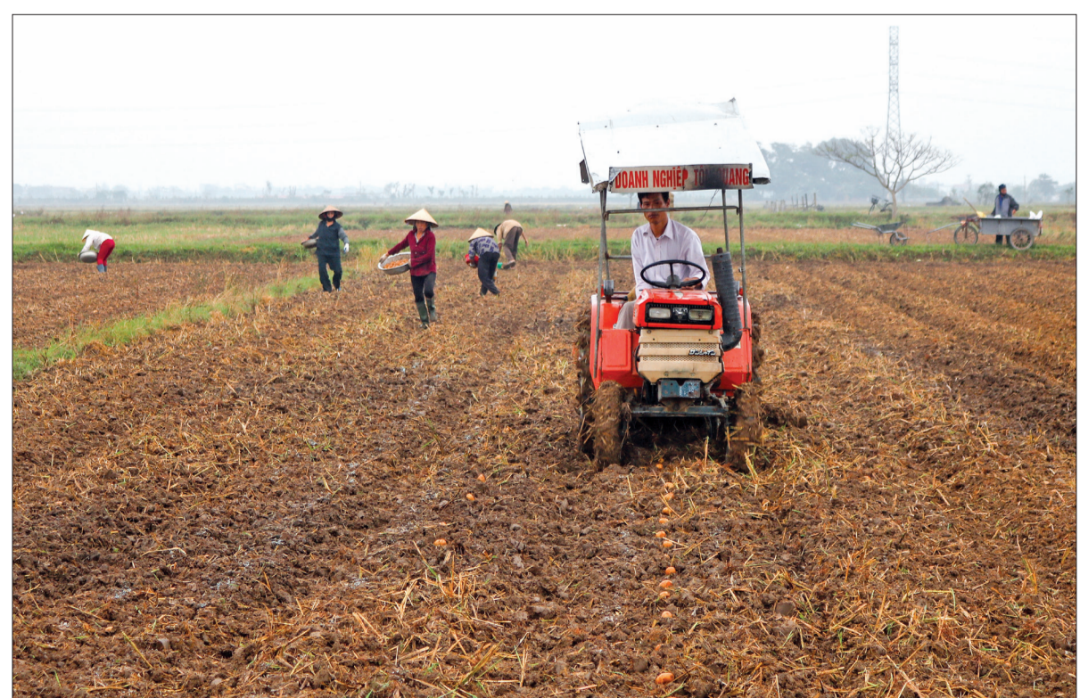
Xã Minh Lăng thuê máy về làm đất cho người dân gieo trồng khoai tây.