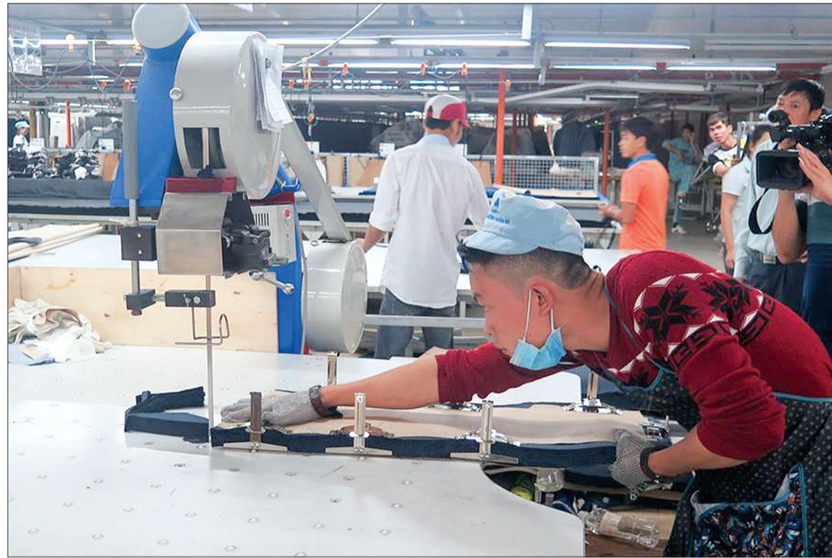
Sản xuất ở Xi nghiệp May veston Hưng Hà.

Đến ngày 31/10, tổng thu nội địa tính cân đối chỉ thực hiện được 4.832,7 tỷ đồng, đạt 79,8% dự toán, bằng 91,8% so với cùng kỳ. Nếu trừ tiền sử dụng đất, tổng số thu từ thuế và phí đạt 3.451 tỷ đồng, đạt 68% dự toán, bằng 85,6% so với cùng kỳ. Để hoàn thành dự toán 6.057 tỷ đồng thu nội địa tính cân đối năm 2017, từ nay đến cuối năm đòi hỏi các ngành và các địa phương, đặc biệt là ngành Thuế cần phải quyết liệt hơn nữa trong công tác lãnh đạo, chỉ đạo nhằm khai thác triệt để mọi nguồn thu trên địa bàn.