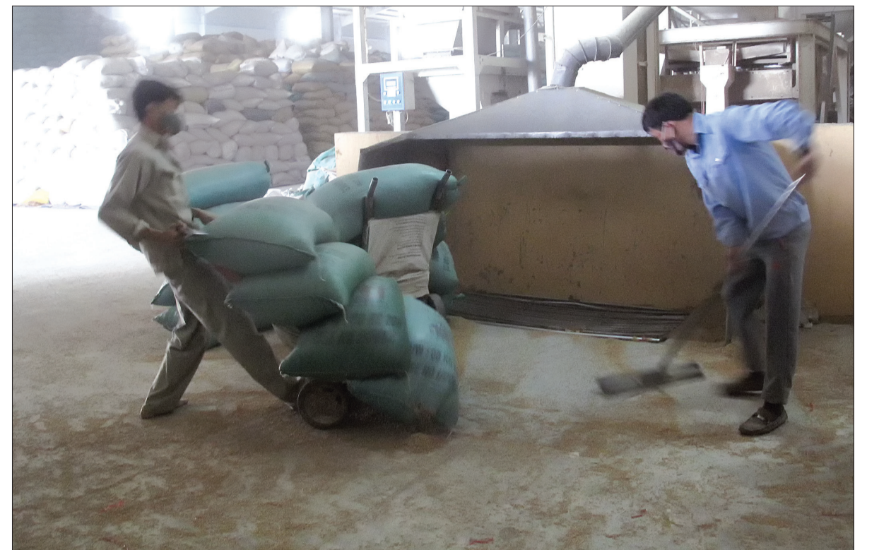
Để bảo đảm sản xuất, Công ty TNHH Liên Hạng thu mua thóc từ thị trường miền Trung, miền Nam.

Giá thóc, gạo thay đổi từng ngày nhưng đều cao hơn so với trước khi thu hoạch lúa mùa và cùng kỳ nhiều năm là nhận định của nhiều thương lái, nông dân. Để bảo đảm thực hiện hợp đồng, một số doanh nghiệp đã phải thu mua thóc từ thị trường miền Trung, miền Nam.