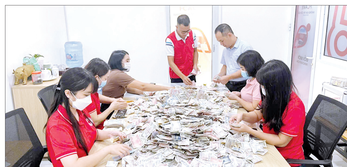
Cán bộ, hội viên Hội Chữ thập đỏ tỉnh kiểm đếm số tiền thu được từ thùng quỹ nhân đạo.