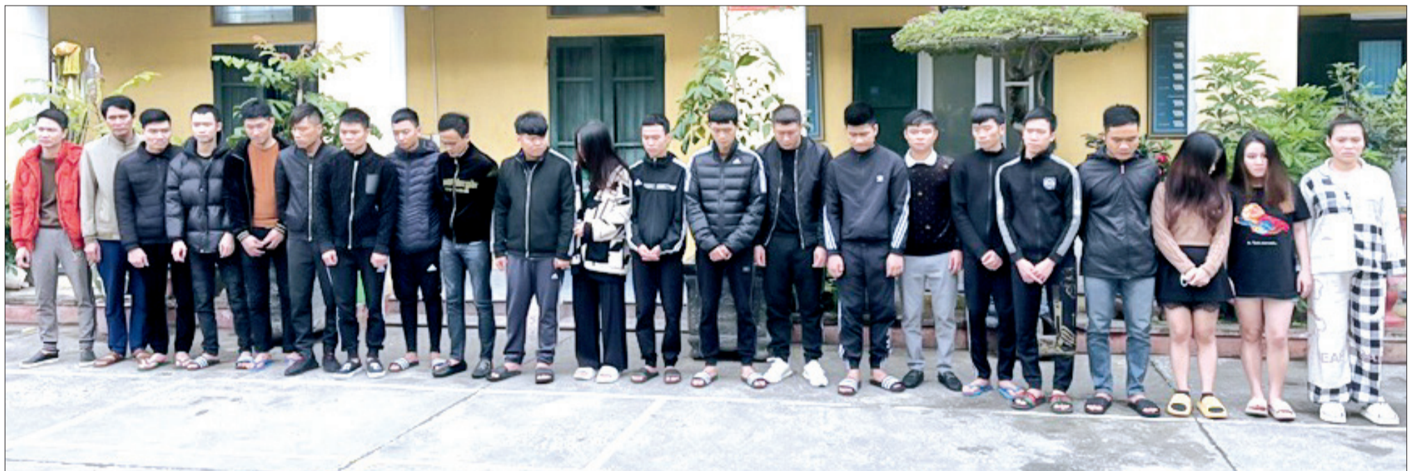
Công an thành phố Thái Bình bắt giữ các đối tượng lừa đảo chiếm đoạt tài sản trên không gian mạng vào tháng 1/2023.

đảo chiếm đoạt tài sản dưới hình thức bán nước hoa, tặng quà qua mạng xã hội với số lượng bị hại lên đến hơn 9.800 người ở 700 đơn vị hành chính cấp quận, huyện trên cả nước với số tiền chiếm đoạt hàng tỷ đồng.