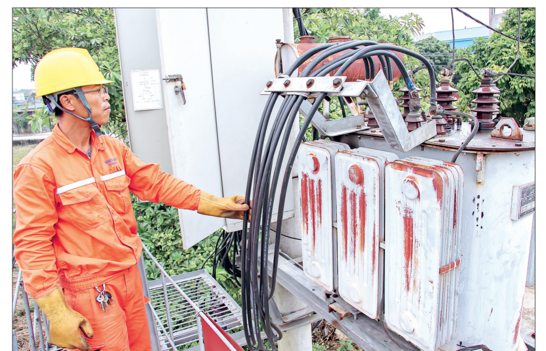
Công nhân điện lực kiểm tra trạm biến áp.