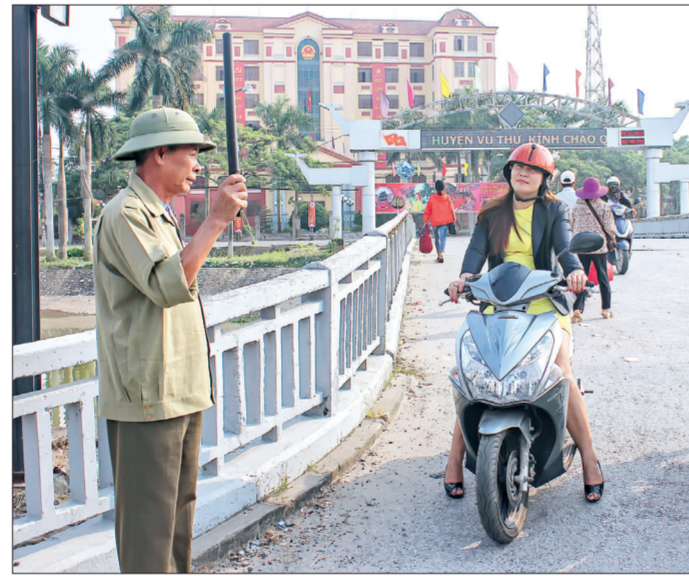
Cựu chiến binh thị trấn Vũ Thư tham gia phân luồng giao thông khu vực cầu Thắm.