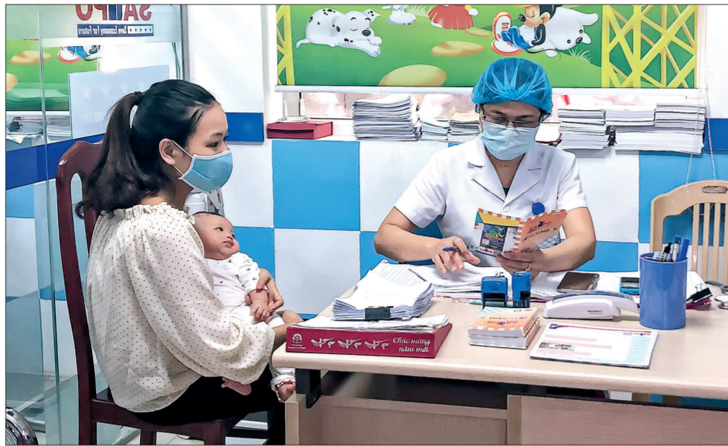
Nhiều gia đình cho con tiêm vắc-xin phòng bệnh tại Trung tâm Kiểm soát bệnh tật tỉnh.