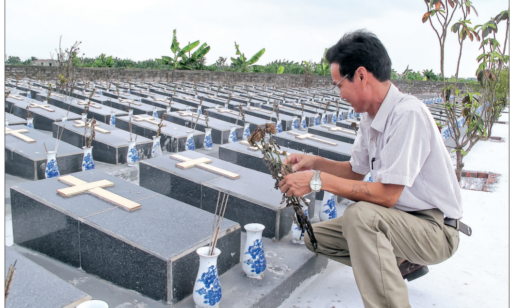
Các ngôi mộ không có thân nhân được quy tập lại từ nguồn kinh phí xã hội hóa.

tập các ngôi mộ không có thân nhân. Toàn bộ kinh phí được sử dụng từ nguồn xã hội hóa và quy hoạch người dân đóng góp ngày công. Đến nay, thôn đã quy tập được 421 ngôi mộ không có thân nhân về vị trí với tổng kinh phí gần 500 triệu đồng. Bên cạnh đó, ban mục vụ cùng bà con giáo dân còn tổ chức xây tường bao và nhà tang lễ trong khuôn viên nghĩa trang; xây dự trữ 10 phần mộ chờ, với quy mô kích thước mỗi mộ chiều rộng là 1,2m, dài 2m, cao 0,7m, khoảng cách giữa hai ngôi mộ là 0,2m, giữa các hàng mộ có lối đi rộng 1m, ốp lát đồng nhất 1 mẫu gạch. Trong khuôn viên nghĩa trang hộ giáo còn bố trí một khu vực an táng các hài nhi xấu số. Đến nay, có gần 200 hài nhi được gom từ các nơi về được an táng tại đây. Cùng với việc làm tốt công tác quy hoạch lại nghĩa trang hộ giáo, thời gian qua, dưới sự lãnh đạo của Chi bộ thôn, bà con đã tích cực tham gia phong trào "Toàn dân đoàn kết xây dựng đời sống văn hóa". Các hoạt động trong việc cưới, việc