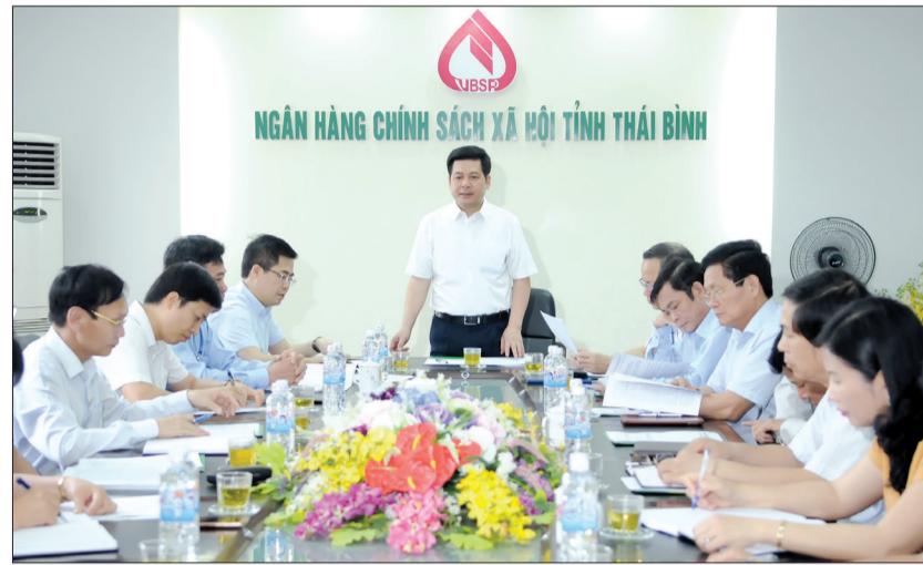
Đồng chí Nguyễn Hồng Diên, Ủy viên Trung ương Đảng, Phó Bí thư Tỉnh ủy, Chủ tịch UBND tỉnh phát biểu tại cuộc họp Ban đại diện Hội đồng quản trị Ngân hàng Chính sách xã hội tỉnh.