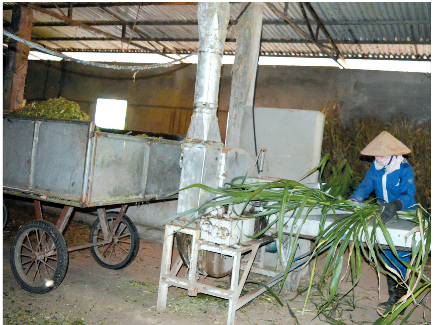
Nhân công nghiền cỏ voi cho bò.

Tác phẩm dự thi viết về đề tài người Thái Bình - đất Thái Bình