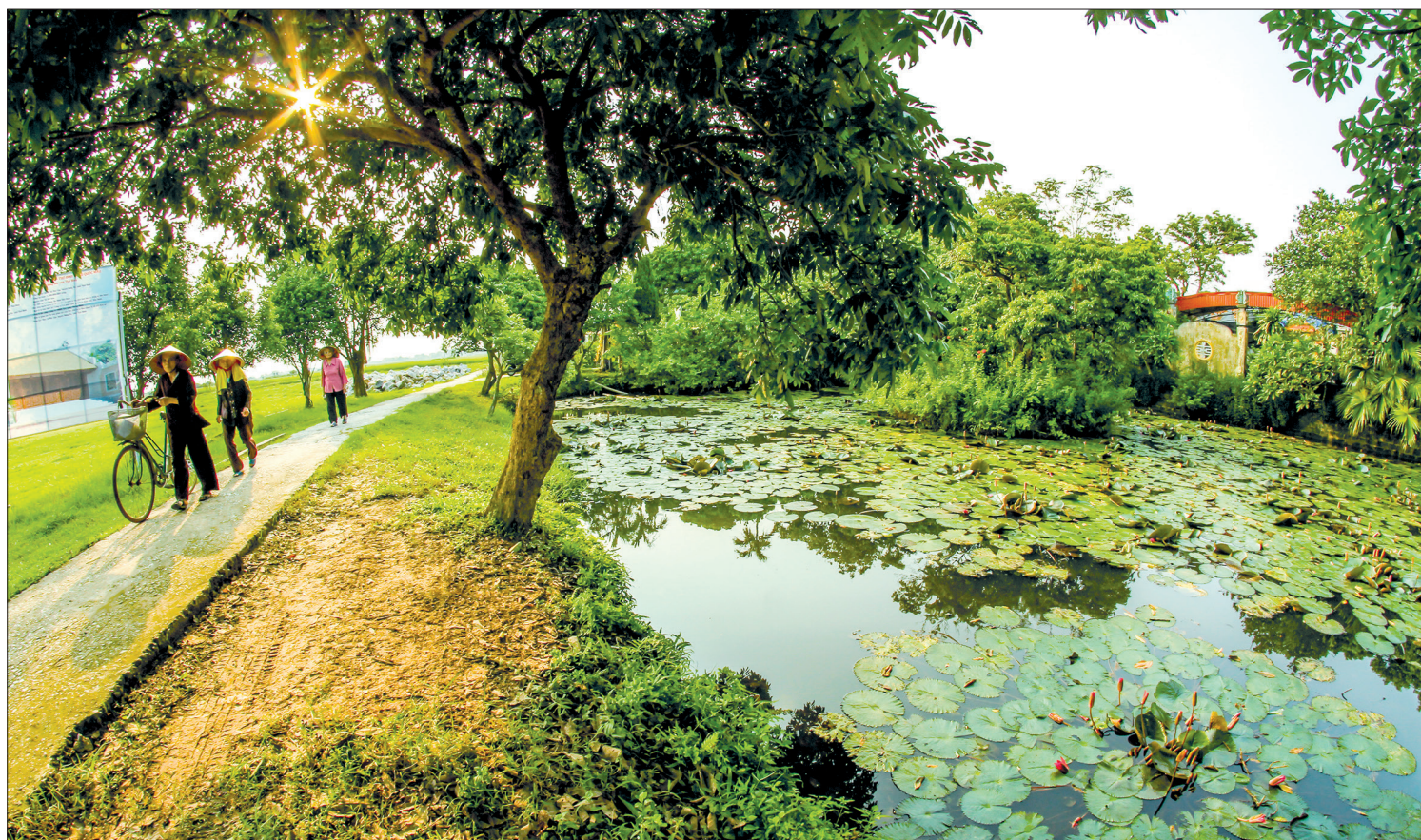
Hơn một ngàn năm qua, khu miếu mộ Quốc mẫu Đàm Hoàng Thái hậu làng Lộc Thọ vẫn giữ nguyên vẻ hoang sơ.