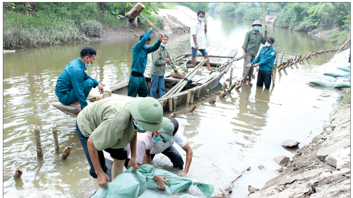
Diễn tập xử lý sạt trượt kè đê bao Trại phong Văn Môn (xã Vũ Văn, Vũ Thu).

độ lớn dễ xảy ra nguy cơ phá hỏng kè, tuyến đê bao, tường chắn sóng, ảnh hưởng đến tính mạng và sản xuất của nhân dân địa phương. Tỉnh hướng giả định được đưa ra là trời mưa, lũ lớn, kè đê bao Trại phong Văn Môn bị sạt trượt, cần xử lý kịp thời để bảo vệ an toàn đê bao. Ngay sau khi lãnh đạo huyện phát lệnh cứu hộ đã diễn ra cuộc diễn tập thực hành xử lý sạt trượt kè đê bao. Xã Vũ Văn huy động lực lượng xung kích, cử sách trên 60 người, máy xúc, máy trộn bê tông, hàng trăm bao cát, bê tông tươi đóng bao, hàng trăm chiếc cọc tre... để xử lý sạt trượt kè đê bao. Trên cơ sở thực hành diễn tập, huyện tổ chức họp, rút kinh nghiệm, khắc phục một số hạn chế, tồn tại trong công tác xử lý sạt trượt kè đê bao.