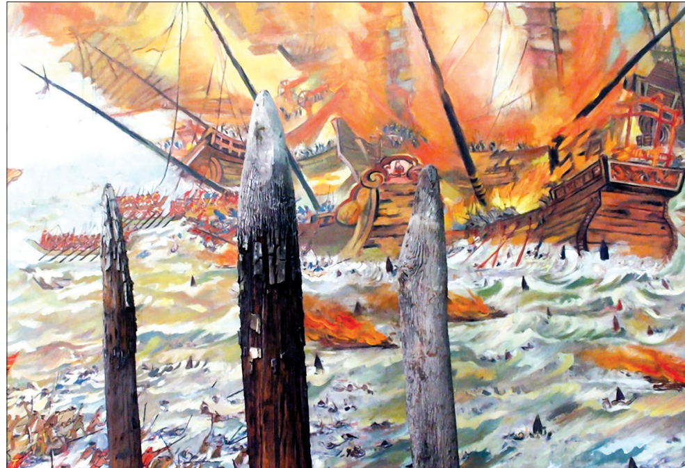
Tranh minh họa trận thủy chiến trên sông Bạch Đằng năm 1288 (nguồn internet).

Phó Chủ tịch thường trực Ban Chấp hành họ Trần Việt Nam (sưu tầm)