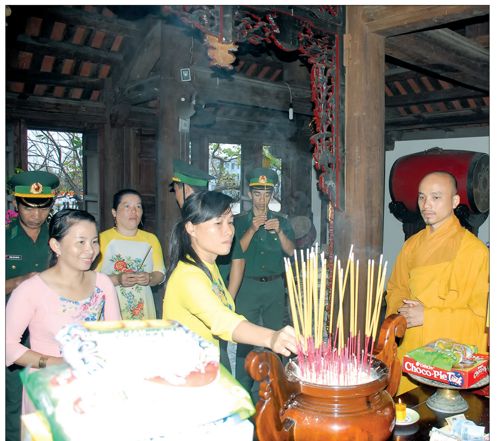
Người dân trên đảo cầu bình an, hạnh phúc trong năm mới.