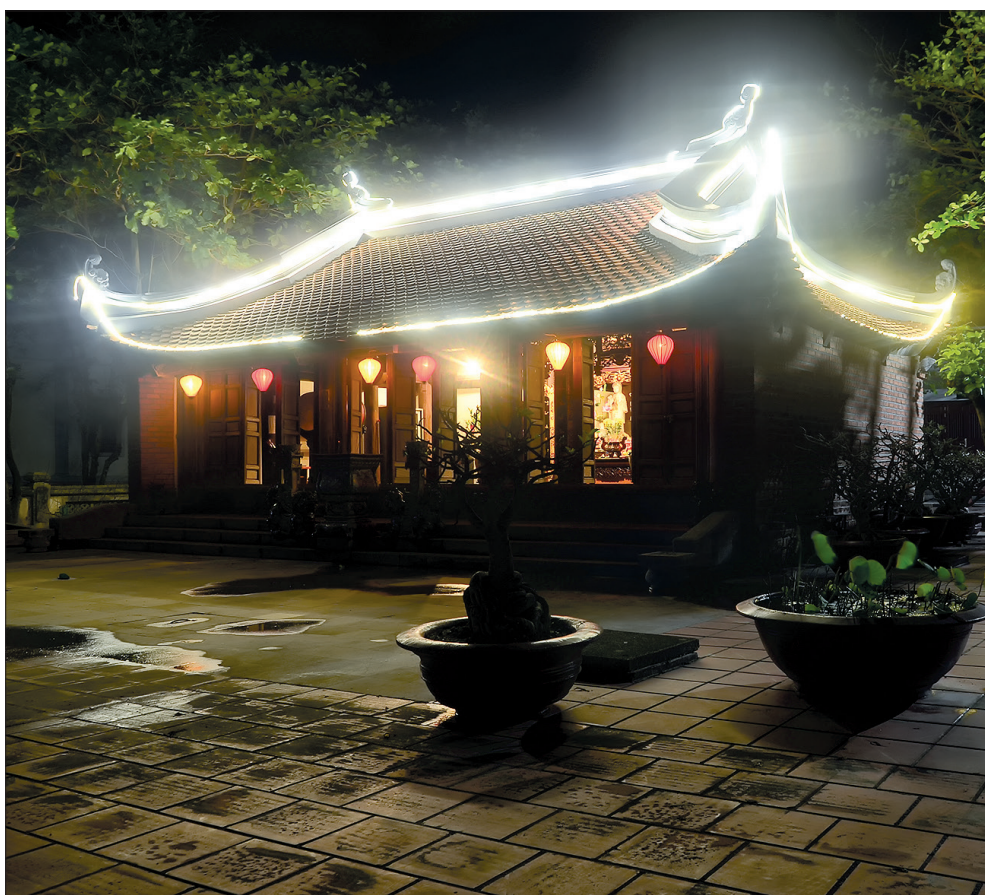
Chánh điện chùa Trường Sa.

Đi lễ chùa đầu năm mới là hoạt động văn hóa tín ngưỡng quan trọng của người dân và cán bộ, chiến sĩ ở Trường Sa. Bởi ở giữa trùng dương sóng nước mênh mông, được thắp hương họ như được sống giữa đất liền. Nỗi nhớ quê hương vì thế cũng phần nào được bù đắp. Mỗi chiến sĩ, mỗi người dân ở đây như được tiếp thêm sức mạnh từ đất liền, để họ trụ vững nơi đầu sóng ngọn gió, khẳng định chủ quyền thiêng liêng của dân tộc.