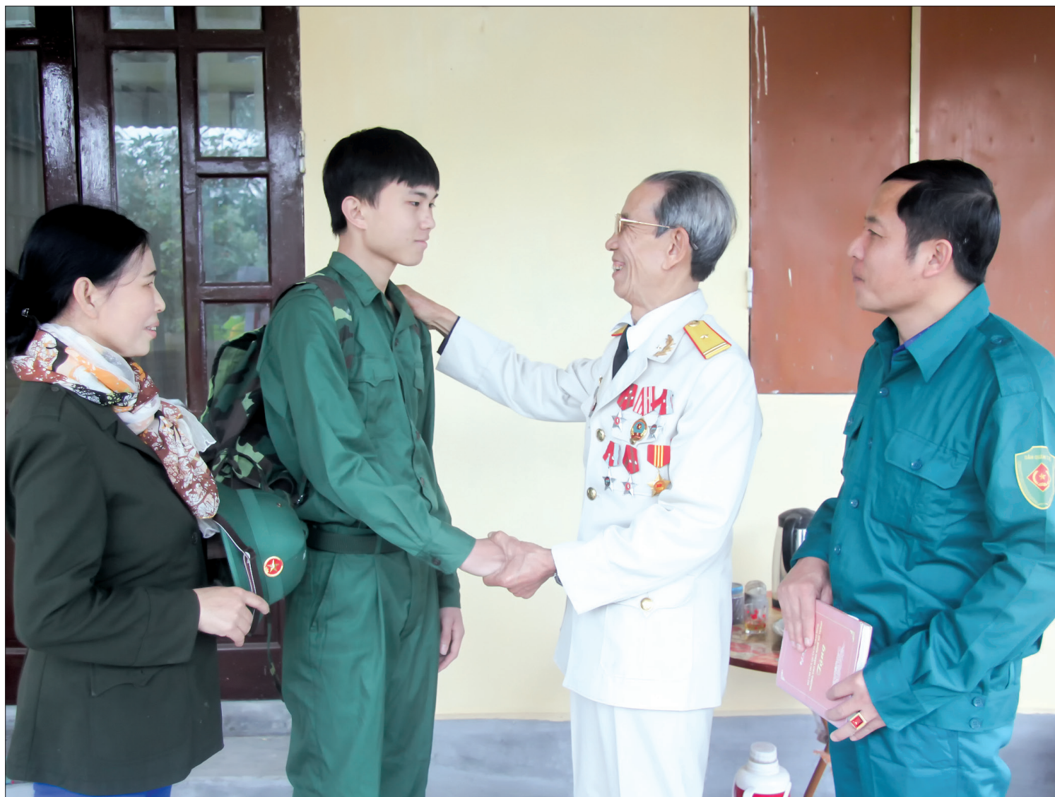
Động viên thanh niên lên đường làm nhiệm vụ xây dựng và bảo vệ Tổ quốc.

Ước mơ, hoài bão, nhiệt huyết của tuổi trẻ Thái Bình được nhân lên khi cấp ủy, chính quyền, các ban, ngành, đoàn thể địa phương và gia đình, người thân quan tâm, động viên các thanh niên trước lúc lên đường về đơn vị mới.