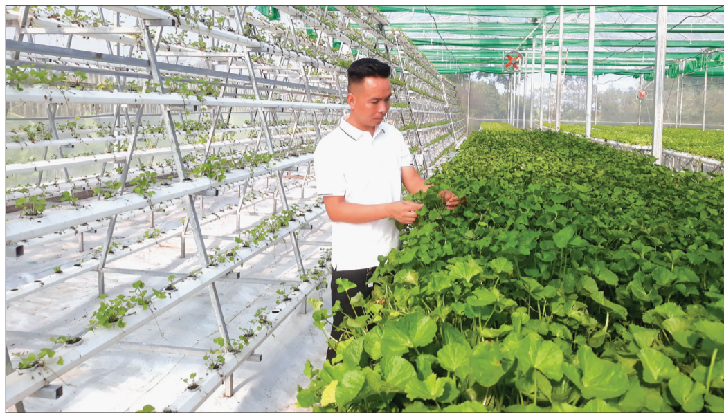
Mô hình trồng rau má thủy canh tại xã Hòa Bình (Kiến Xương) mang lại hiệu quả kinh tế cao.

Ngày 14/11/1945, Bộ Canh nông - tiền thân của Bộ Nông nghiệp và Môi trường ngày nay được thành lập. Theo đó, ngành nông nghiệp Thái Bình được thành lập với tên gọi ban đầu là Ty Nông Lâm Thái Bình.