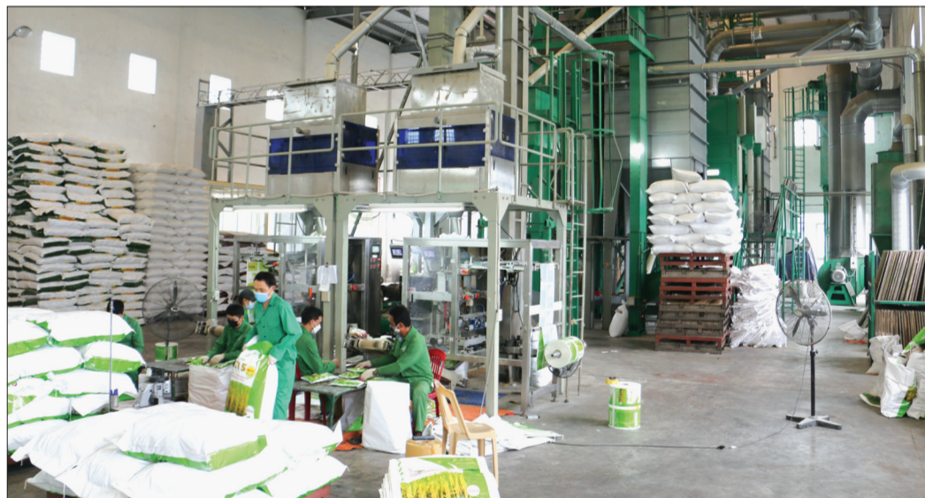
Sản xuất lúa giống tại Công ty Cổ phần Tập đoàn Thái Bình Seed.

Với quyết tâm tăng trưởng kinh tế hai con số trong năm 2025, thành phố Thái Bình tạo ra sức mạnh cộng hưởng từ cộng đồng doanh nghiệp. Về phía doanh nghiệp, tất cả đều thể hiện sự đồng lòng, quyết tâm cao với mục tiêu tăng trưởng của thành phố, đặt kế hoạch, chỉ tiêu tăng trưởng năm sau cao hơn năm trước.