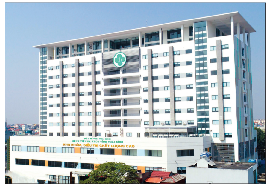
Khu khám, điều trị chất lượng cao Bệnh viện Đa khoa tỉnh.