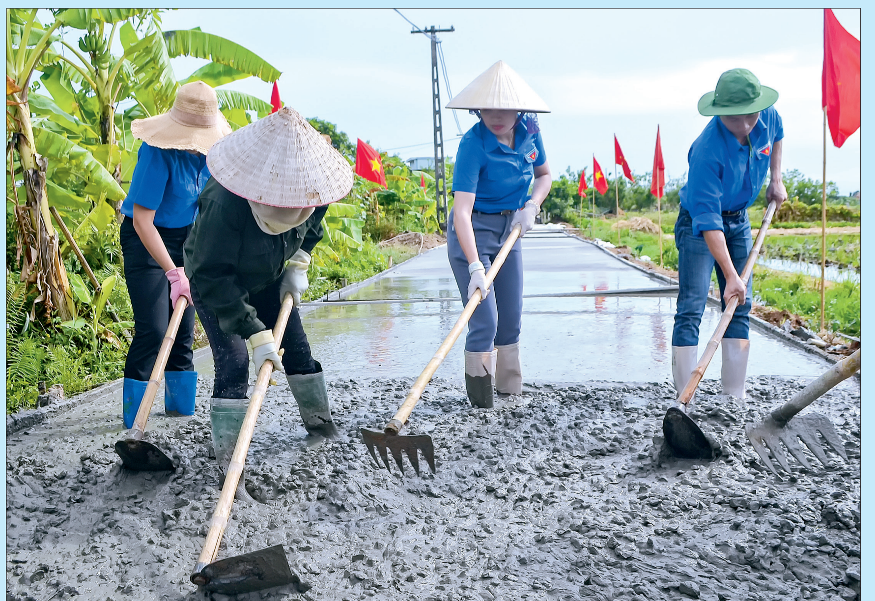
Cùng với việc hỗ trợ kinh phí, các cấp bộ đoàn trong tỉnh đã huy động ngày công hỗ trợ xã Thái Dương, nay là xã Dương Hồng Thủy, huyện Thái Thụy xây dựng cơ sở hạ tầng nông thôn mới.