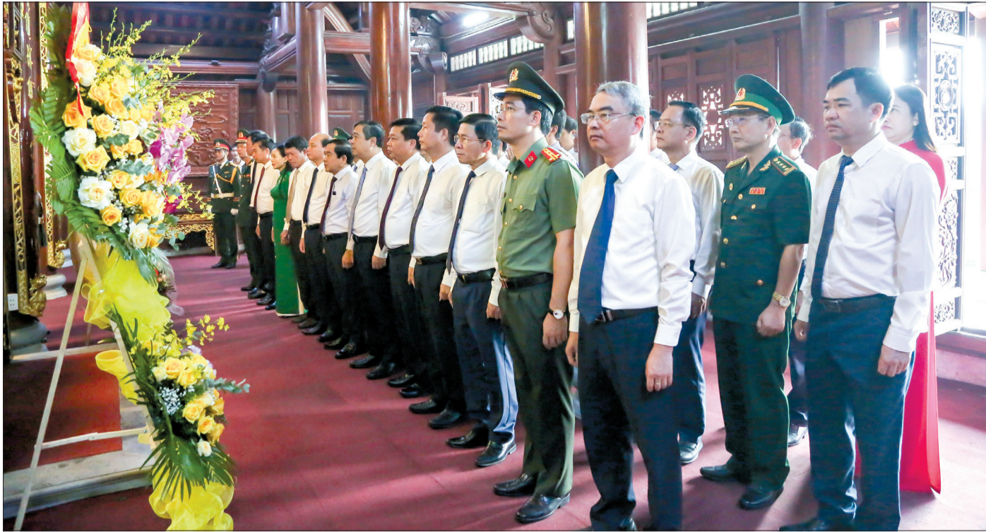
Các đồng chí lãnh đạo tỉnh dâng hương tưởng niệm Chủ tịch Hồ Chí Minh tại Đền thờ Bác Hồ (phường Hoàng Diệu, thành phố Thái Bình).