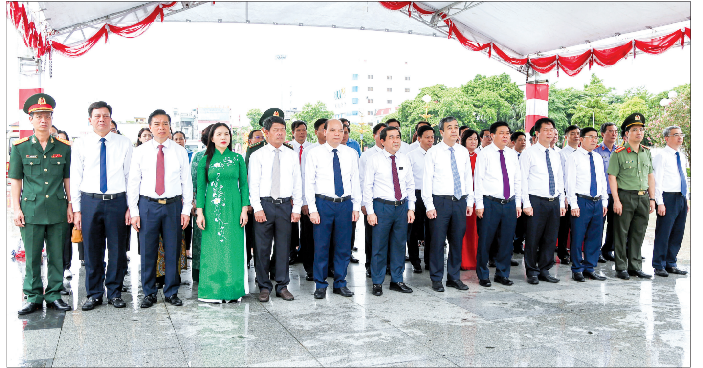
Các đồng chí lãnh đạo tỉnh dâng hương tưởng niệm đồng chí Nguyễn Đức Cảnh tại Tượng đài đồng chí Nguyễn Đức Cảnh.

Kỷ niệm 77 năm ngày Thương binh - Liệt sĩ (27/7/1947 - 27/7/2024), sáng ngày 24/7, Ban Thường vụ Tỉnh ủy tổ chức lễ dâng hương, dâng hoa tưởng niệm Chủ tịch Hồ Chí Minh tại Đền thờ Bác Hồ, Tượng đài Bác Hồ với nông dân Việt Nam (phường Hoàng Diệu, thành phố Thái Bình), đồng chí Nguyễn Đức Cảnh tại Tượng đài đồng chí Nguyễn Đức Cảnh (Quảng trường 14/10) và các anh hùng liệt sĩ tại Đền thờ Liệt sĩ tỉnh.