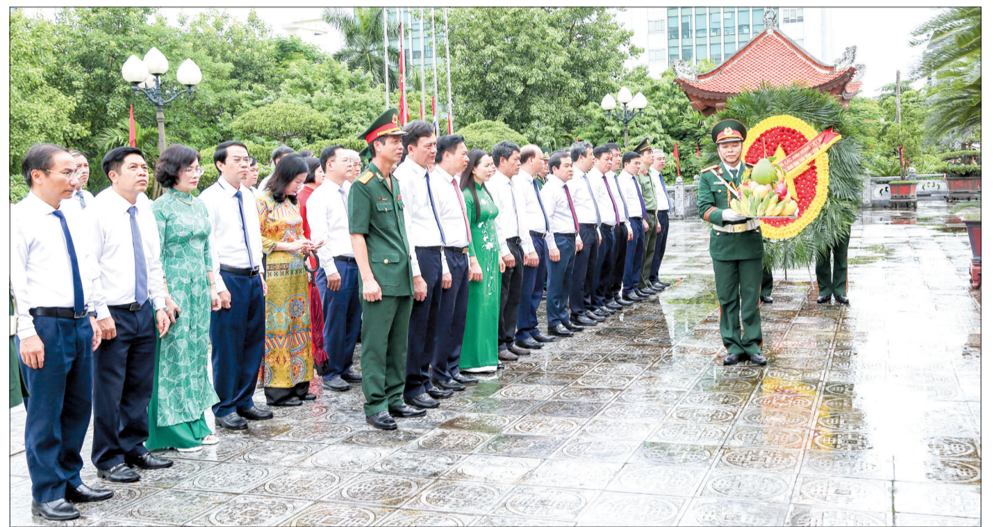
Các đồng chí lãnh đạo tỉnh dâng hương tưởng niệm các anh hùng liệt sĩ tại Đền thờ Liệt sĩ tỉnh.