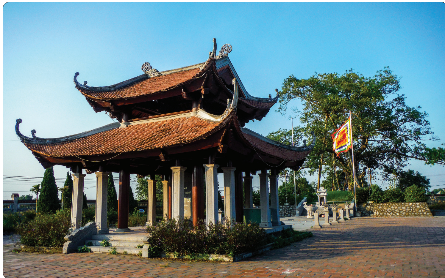
Lăng mộ Thái sư Trần Thủ Độ ở làng Ngồi, xã Liên Hiệp (Hưng Hà); cách lăng của ông khoảng 800m là đền thờ Linh từ quốc mẫu Trần Thị Dung.

Theo các nguồn khảo luận, khoảng năm 1226 - 1227, bà lấy Trần Thủ Độ. Có nghiên cứu cho rằng Trần Thị Dung và Trần Thủ Độ yêu nhau từ thuở hàn vi ở làng quê nên cùng còn là tôn nghi. Việc Trần Thị Dung