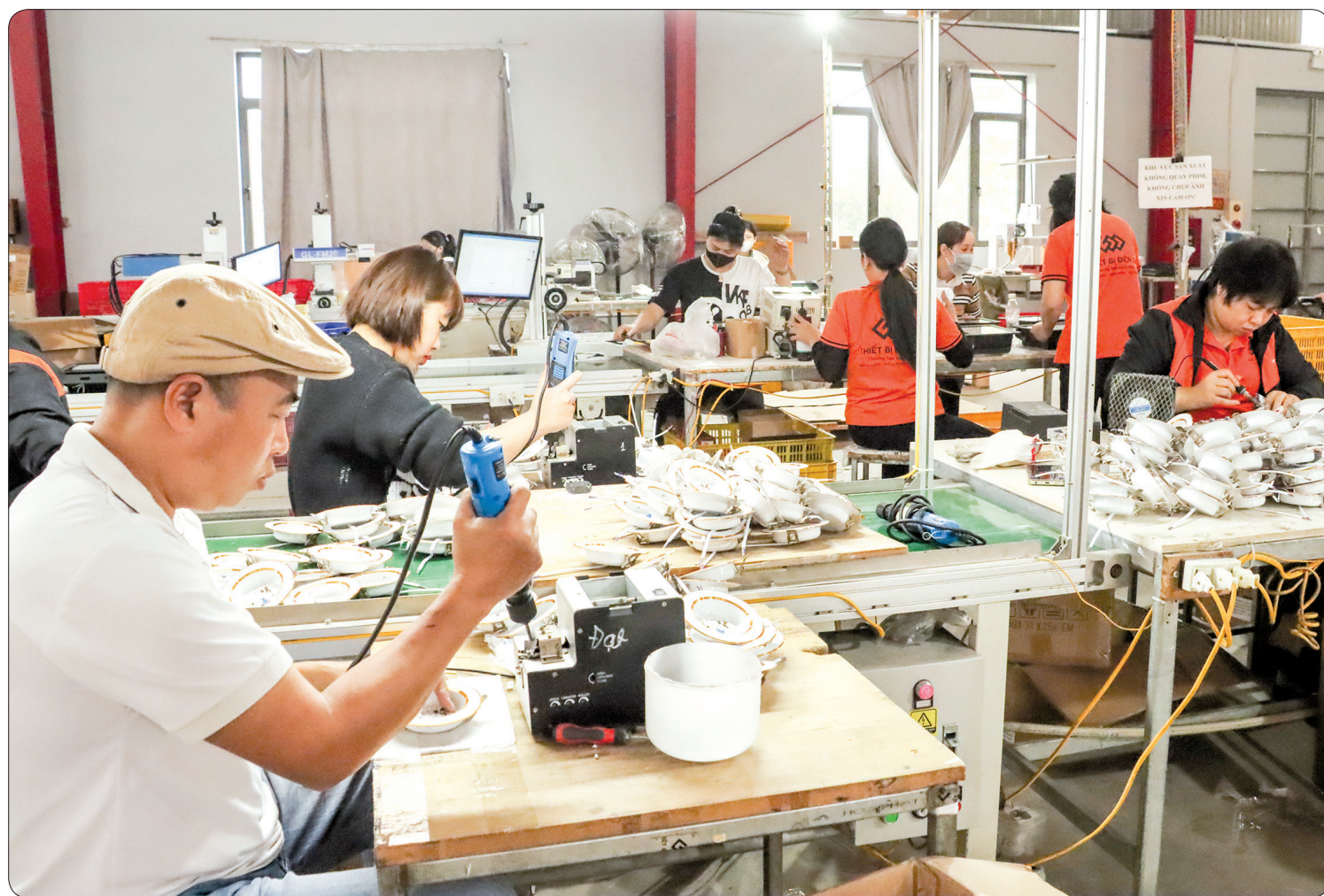
Công nhân Công ty TNHH Sản xuất đèn pin, vệt muối G8 tích cực sản xuất ngay từ những ngày đầu năm.

Một năm khởi đầu từ mùa xuân. Tinh thần phấn khởi, nỗ lực thi đua đẩy mạnh sản xuất, kinh doanh ngay từ những ngày đầu xuân của các doanh nghiệp trên địa bàn huyện Đông Hưng tạo khí thế hướng tới mục tiêu thực hiện thắng lợi các nhiệm vụ phát triển kinh tế - xã hội năm 2024 và nghị quyết đại hội đảng bộ các cấp đã đề ra.