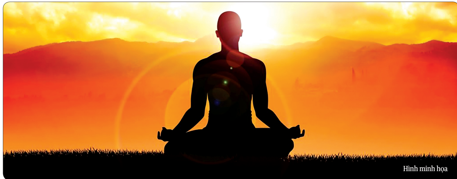
Hình minh họa

a) Bạn hãy tiếp cận môn thiền định để vừa tĩnh tâm vừa chữa bệnh và làm giảm đi tiếng thở dài.