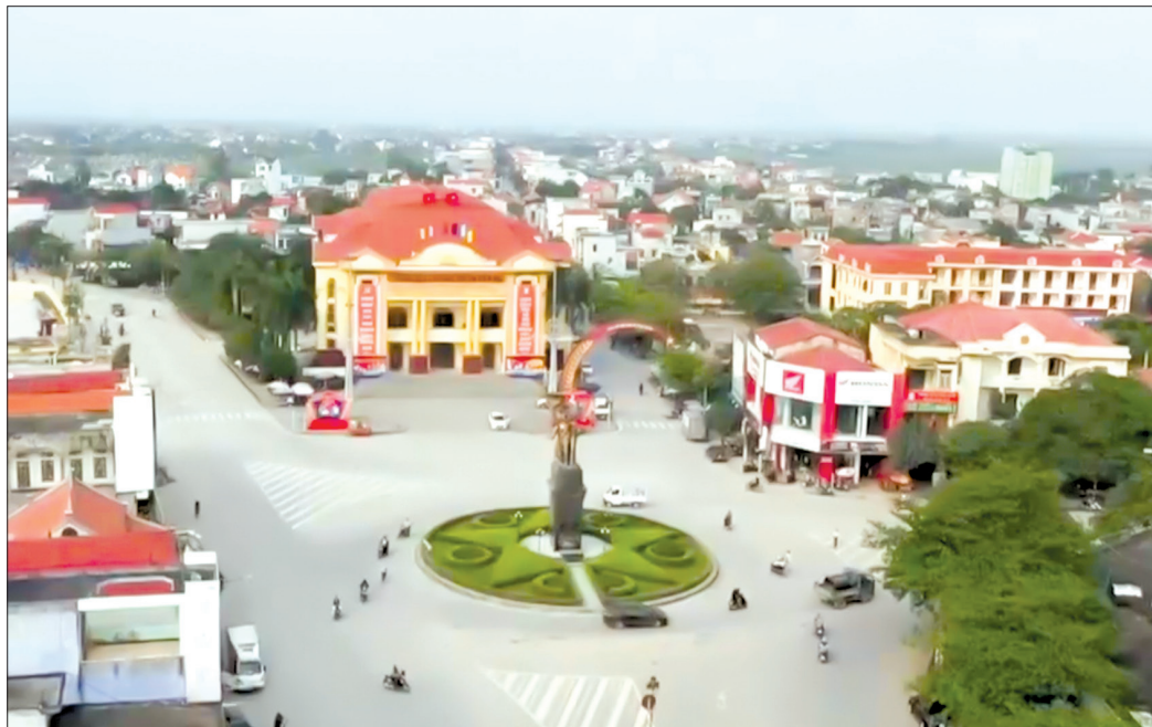
Tiền Hải hôm nay.

60 năm qua, từ lần thứ tư Bác Hồ về thăm Thái Bình, Đảng bộ và nhân dân toàn tỉnh phát huy truyền thống yêu nước, cách mạng của quê hương, một lòng theo Đảng, đoàn kết, nỗ lực vượt qua mọi khó khăn, quyết tâm thực hiện lời dạy của Bác, giành được nhiều thành tích to lớn, đóng góp quan trọng vào sự nghiệp đấu tranh giải phóng dân tộc, xây dựng và bảo vệ Tổ quốc. Ngày trong khói lửa chiến tranh, nam giới huy động cho chiến trường, lao động ở địa phương 70% là nữ nhưng Thái Bình luôn dẫn đầu năng suất lúa toàn miền Bắc, đạt 5 tấn thóc/ha năm 1966, 6 tấn/ha năm 1972, 7 tấn/ha năm 1974. "Quê hương năm tấn" Thái Bình là niềm tự hào, là biểu tượng về tinh thần nỗ lực thi đua lao động sản xuất nông nghiệp của cả miền Bắc khi đó. Với tinh thần "Thái Bình đốc lòng chi