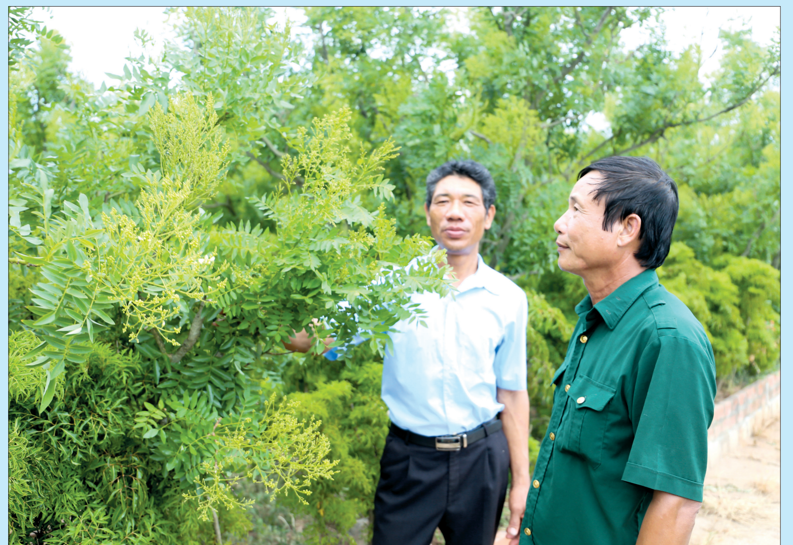
Mô hình phát triển kinh tế của cựu chiến binh xã Đông Tiến (Quỳnh Phụ).