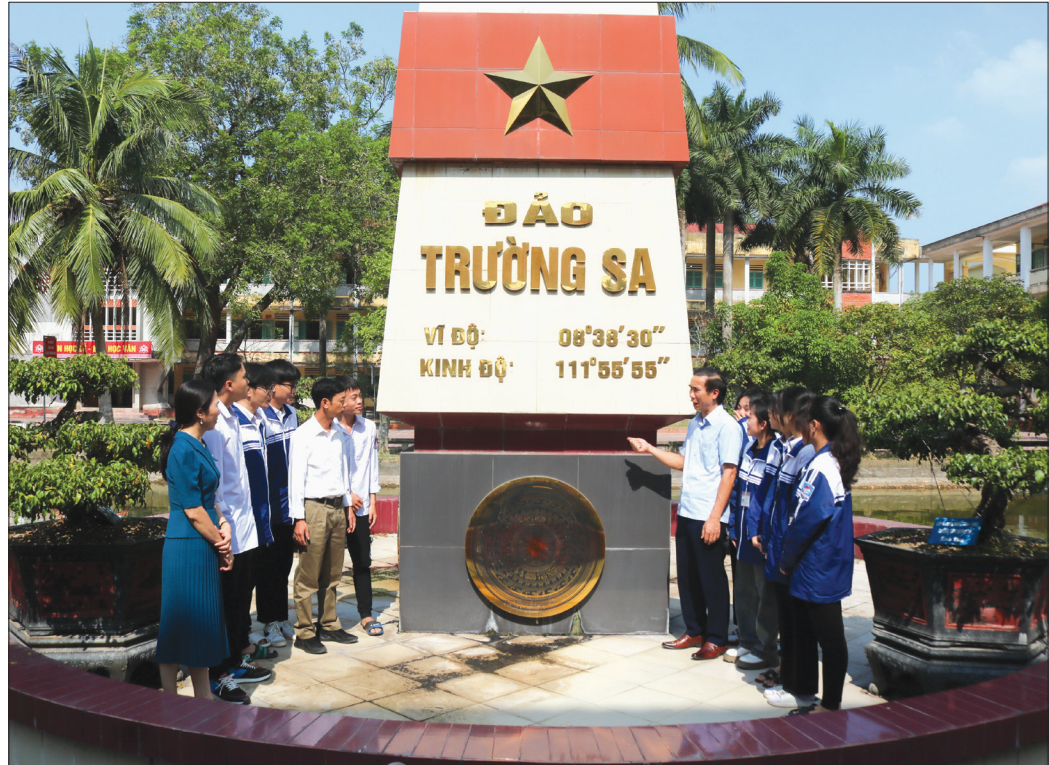
Vào mỗi dịp kỷ niệm, thầy và trò Trường THPT Quỳnh Côi cùng nhau ôn lại truyền thống cách mạng cũng như quá trình xây dựng và phát triển của nhà trường.

Ngày 1/9/1962, Trường Phổ thông cấp III Quỳnh Côi, nay là Trường THPT Quỳnh Côi được thành lập. Trải qua 60 năm xây dựng và phát triển với biết bao khó khăn, thăng trầm song tập thể cán bộ, giáo viên cùng các thế hệ học sinh luôn đoàn kết, thống nhất xây dựng ngôi trường có bề dày truyền thống, chấp cánh ước mơ cho các thế hệ học sinh.