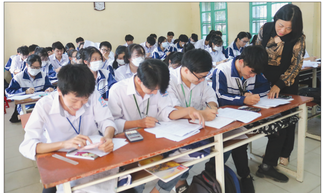
Giờ học của cô và trò Trường THPT Quỳnh Côi.