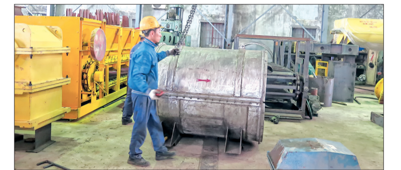
Sản xuất tại Công ty TNHH Cơ khí Tam Long (xã Vũ Lạc, thành phố Thái Bình).