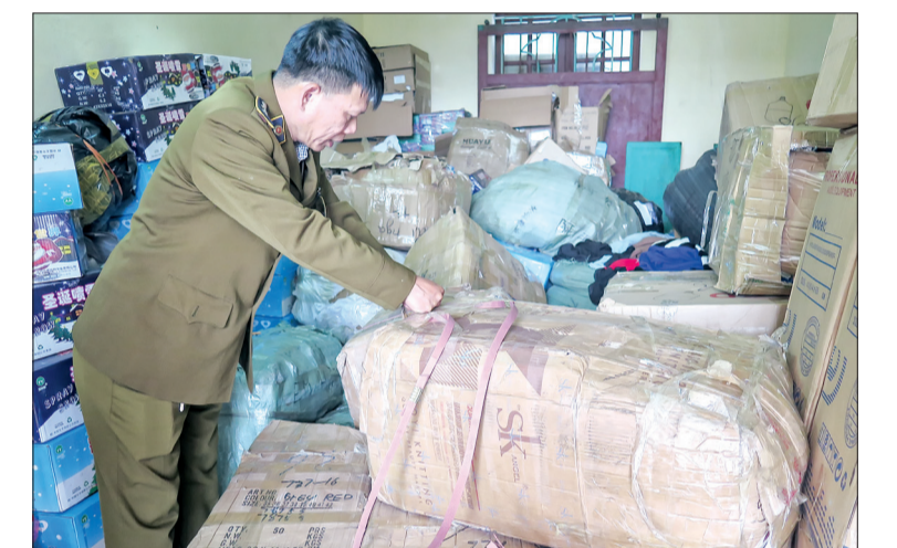
Nhiều sản phẩm không rõ nguồn gốc xuất xứ bị các đội quản lý thị trường thu giữ.

Trong tháng 4, Chi cục Quản lý thị trường tăng cường công tác quản lý phòng, chống ngộ độc rượu và bảo đảm an toàn thực phẩm, kiểm soát các cơ sở sản xuất, kinh doanh lĩnh vực vật tư nông nghiệp như phân bón, thuốc bảo vệ thực vật, thức ăn chăn nuôi, thuốc thú y, giống cây trồng, vật nuôi. Đặc biệt, đã triển khai đợt cao điểm kiểm tra và xử lý trong lĩnh vực thuốc bảo vệ thực vật và phân bón. Kết quả, trong tổng số 233 lượt kiểm tra Chi cục đã phát hiện 88 vụ vi phạm với số tiền xử phạt, nộp ngân sách nhà nước gần 142 triệu đồng.