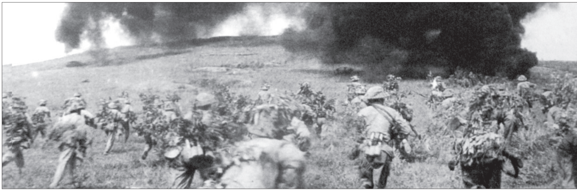
Đợt xung phong của các chiến sĩ Việt Minh trong chiến dịch Điện Biên Phủ.