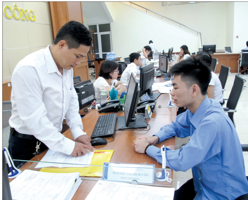
Cán bộ Trung tâm Hành chính công tỉnh hướng dẫn người dân thực hiện các thủ tục hành chính.

Đánh giá hiệu quả quản lý, năng lực điều hành của chính quyền trong thực