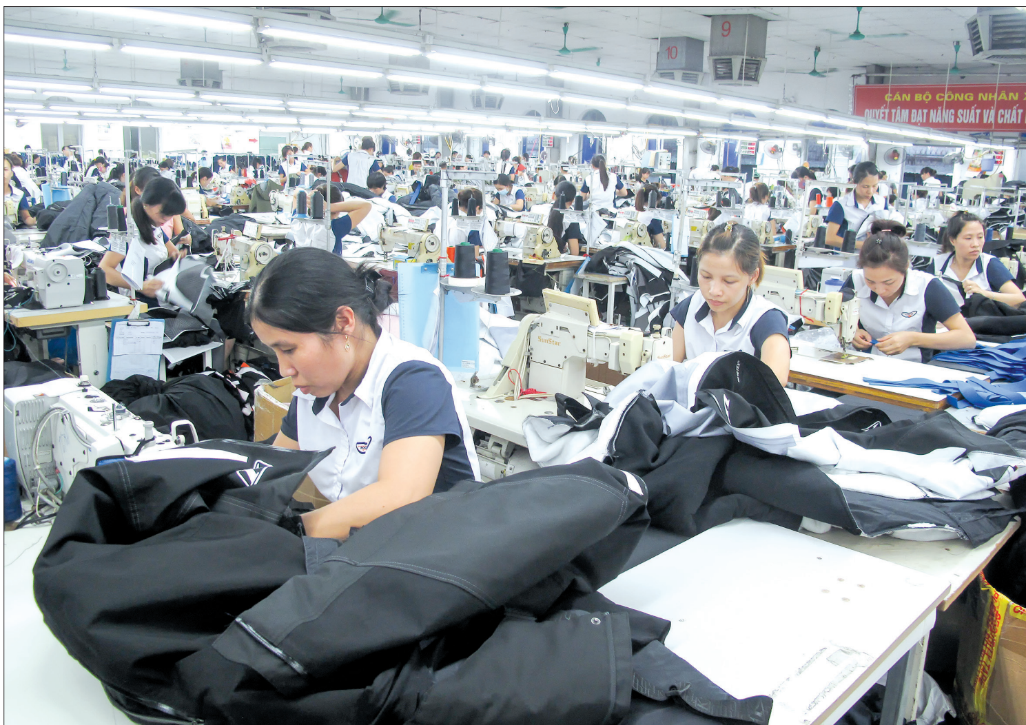
Sản xuất tại Công ty TNHH Poongshin Vina (khu công nghiệp Phúc Khánh).