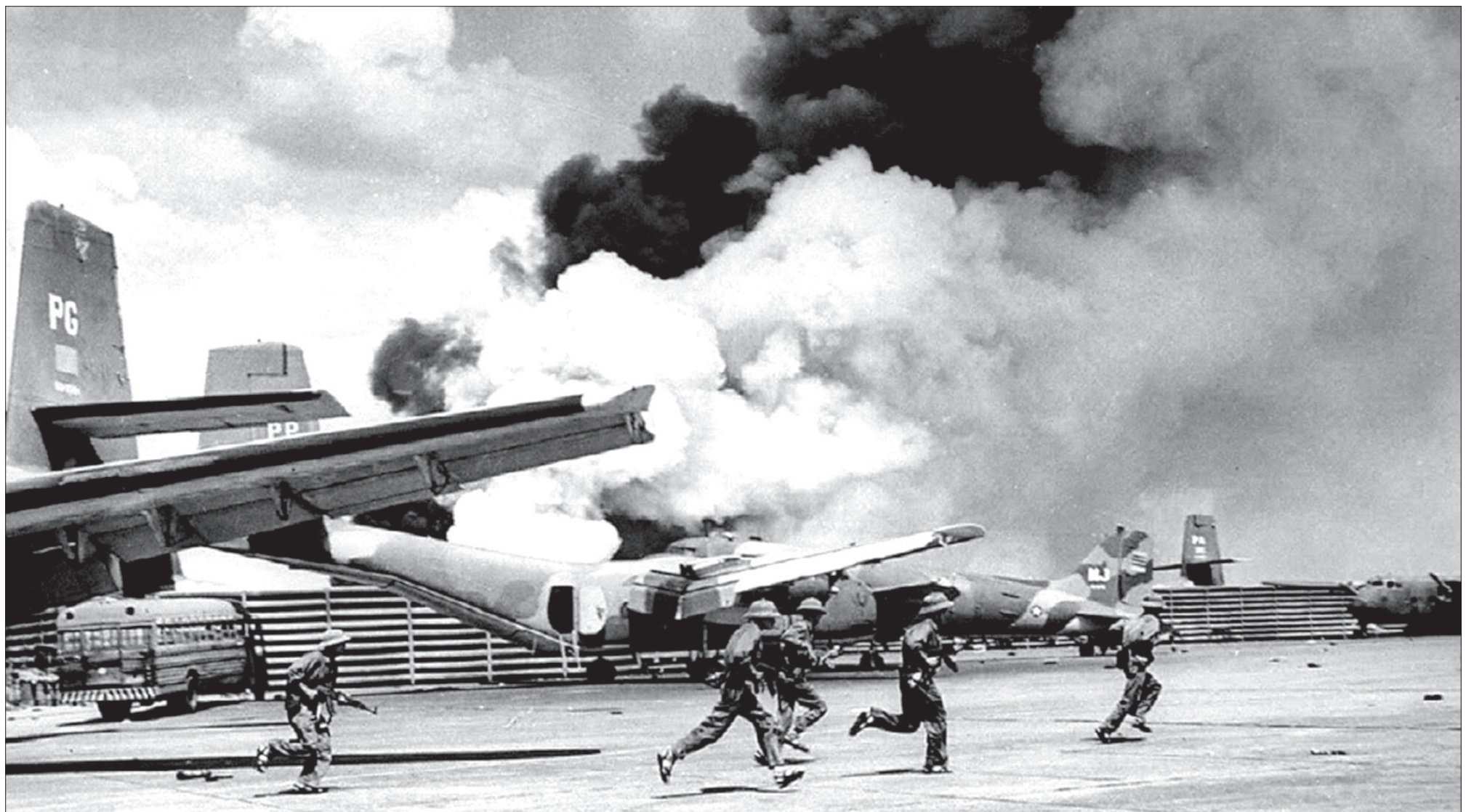
Quân giải phóng đánh chiếm căn cứ không quân Tân Sơn Nhất, phía sau là cuộn khói bốc ra từ những chiếc máy bay bị phá hủy, ngày 30/4/1975.